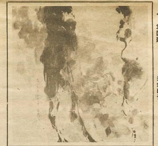
▲ 袁国建 多余的话