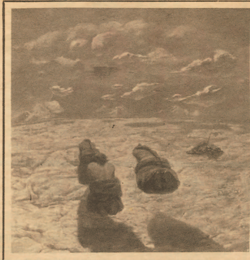
▲ 张晓红 第三极 (选自西藏山地艺术家作品展)