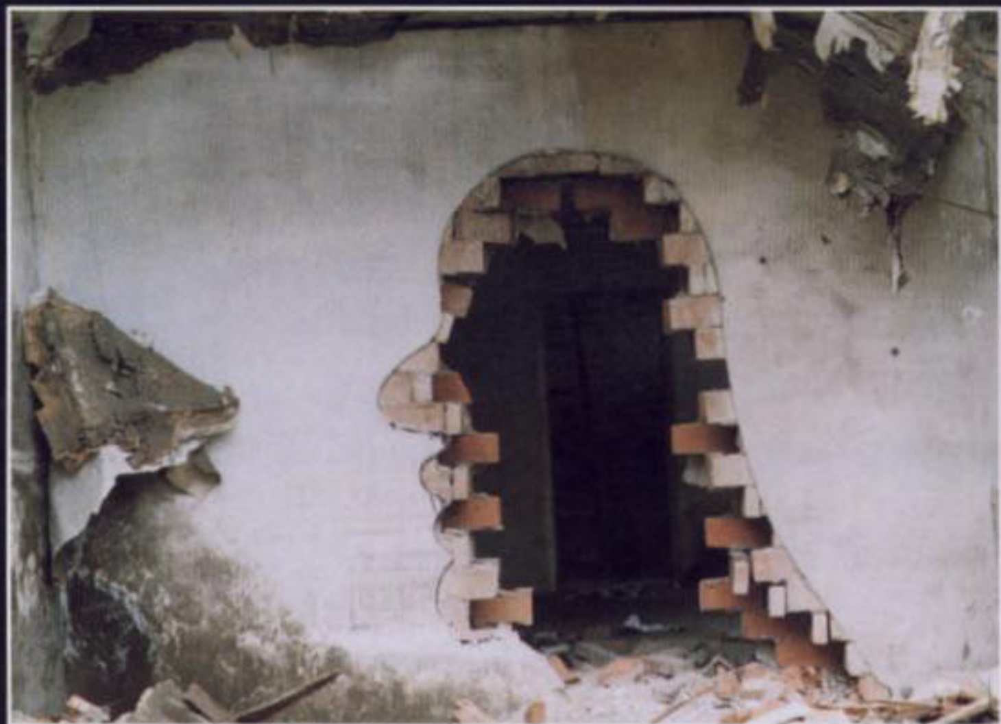
Sopra ZHANG DALI Demolizione, Pechino, 1999