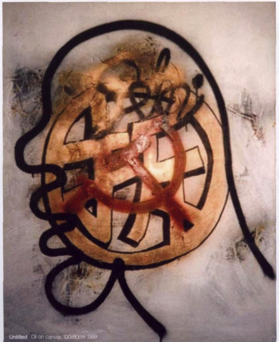
Untitled Oil on canvas 100x80cm 1999

내 작품은 중국의 현실과 매우 관련이 깊다. 나는 항상 실제 삶의 다양한 측면에 관해 관심이 많다. 경제적 변화, 도시의 발전, 현실의 변화와 이해에 영향을 주는 감성적 지적 접근, 정치적 인식론 등. 어떤 특정한 상황에서 보통 사람들이 하는 생각, 행동, 상황의 해결방식 등이 내 작품의 원천이 된다. 나는 중국사회의 리얼리즘 비평이야말로 예술의 중요한 부분이라고 항상 생각했다. 세계의 다른 나라들과 비교해보면 이것은 매우 다른 관점이다. 현실은 예술의 발전에 있어서 현대 미술 그 자체보