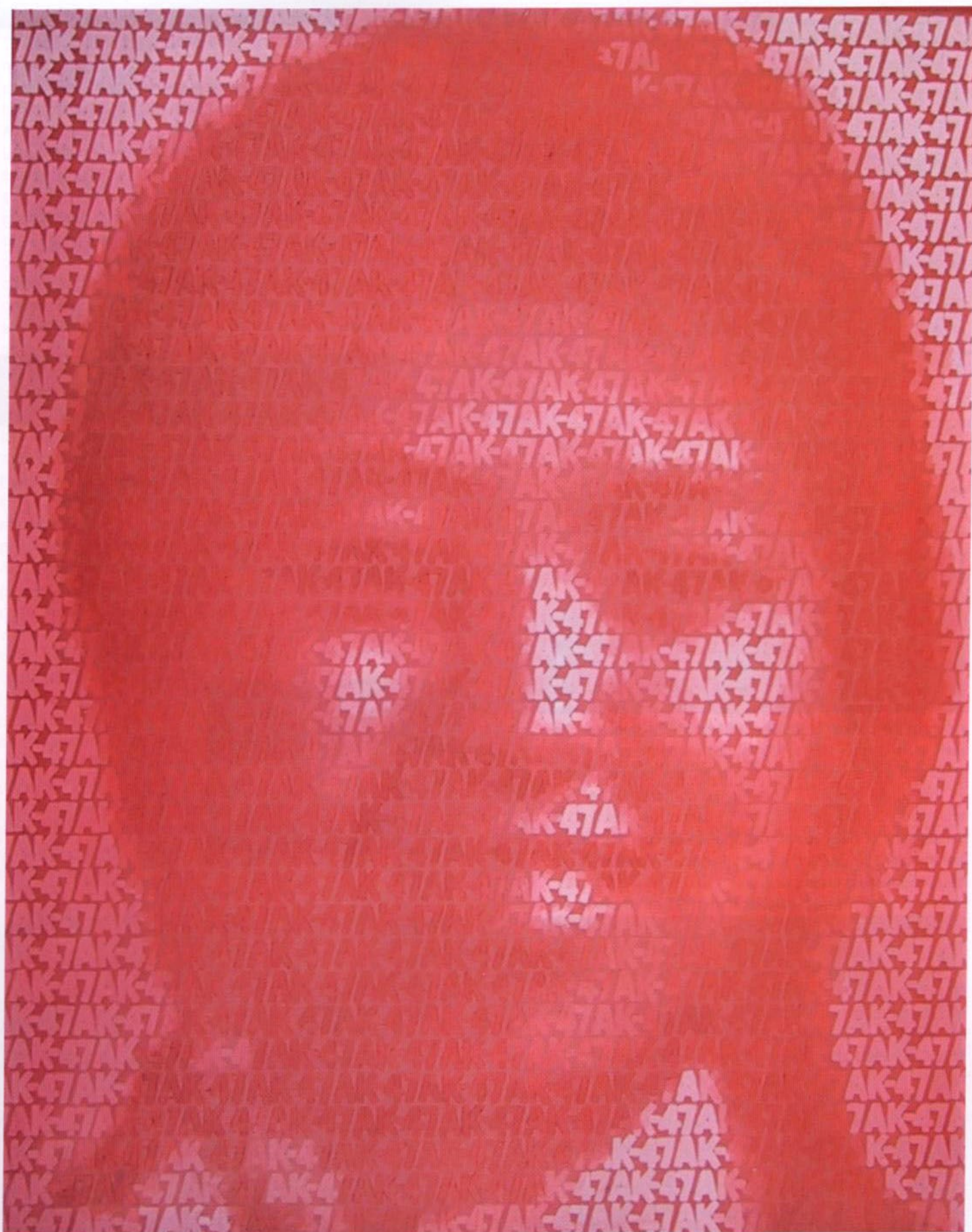
AK-47 acrylic on vinyl 150x150cm 2004