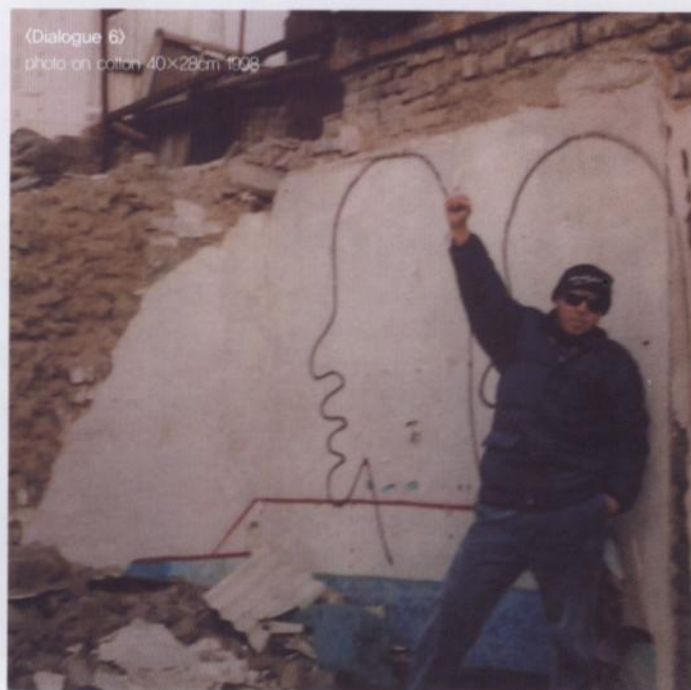
(Dialogue 6) photo on cotton 40x28cm 1998

내 작품은 내 의견을 표현하는 나만의 언어이다. 말하기를 원하지 않거나 말할 수 없는 사람들이 말할 수 있도록 도와준다고도 할 수 있다. 우리가 느끼는 감정에 대해서 말하는 것은 우리의 권리이다. 그래서 나는 이러한 감정들을 표현하기 위해 예술이라는 언어를 사용한다. 무엇을 변화시키는 데 있어서 나 자신만의 힘과 노력에만 의지 할 수 없다는 것을 알고 있다. 그러나 나는 사람들이 각자의 책임을 다해야 한다고 믿는다. ♪