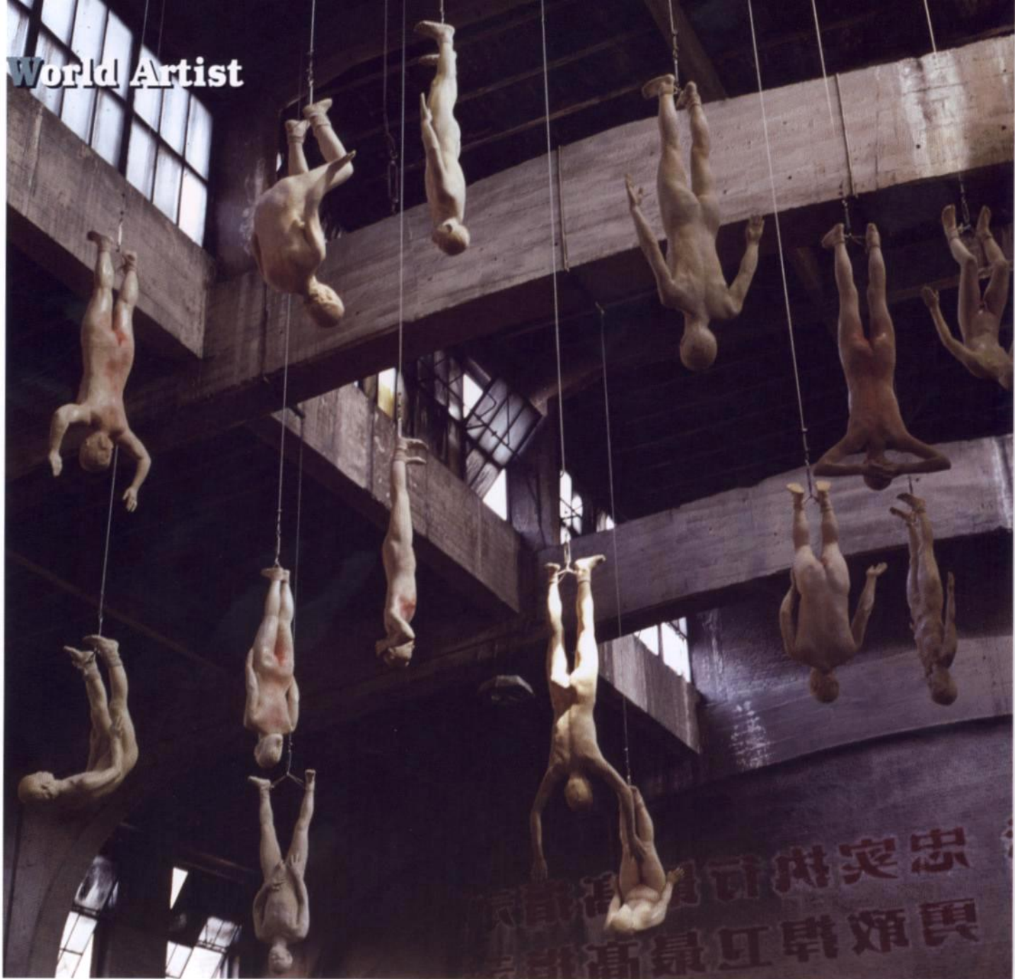
《Chinese Offspring》 2003-2004