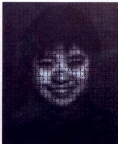
口号/布面丙烯/223cm x 181cm/2007年