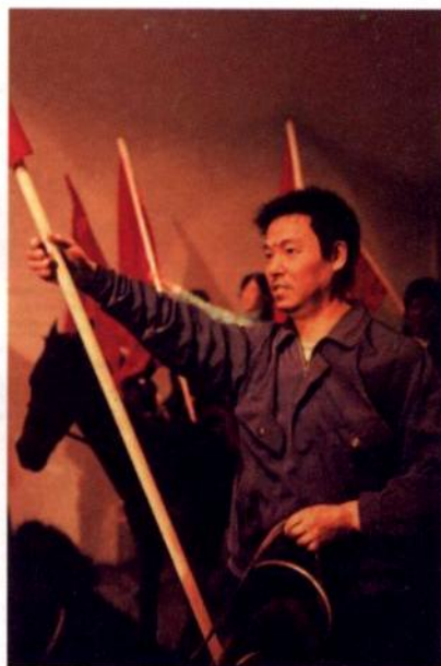
“风/马/旗”/装置·综合材料