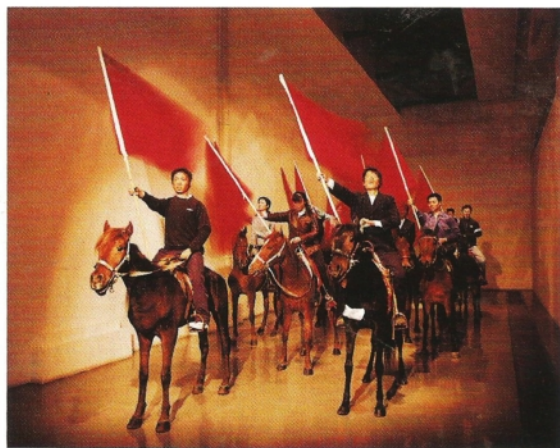
风·马·旗 综合材料 Wind · Horse · Flag mixed material 2008

《种族》此前在英国萨奇画廊 (Saatchi Gallery) 举办的《革命在继续：中国新艺术》(The Revolution Continues) 当代艺术品展览中展出过，数个与实物等大的外来劳工的雕塑被倒吊在展厅里，特定的数字、艺术家的签名和作品的标题“Chinese Offspring”被刺在每一个铸像的身上，恐怖的情景令人联想到塔罗牌里那个代表“牺牲”的“倒吊男”。张大力告诉笔者，“我本人就曾像这些外来劳工一样漂泊着，没什么两样。”这因为这种切身的体会，艺术家把这种不安定的生活、地位极低的底层生活和对命运的无力感，深深地刻画在这些雕塑的每一块紧锁的肌肉里。