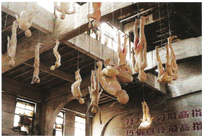
种族 玻璃钢 Chinese Offspring resin mixed with fibreglass 2003