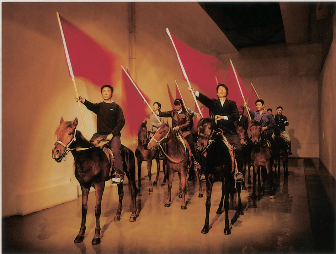
7. 張大力 | 風·馬·旗 複合媒材 2008