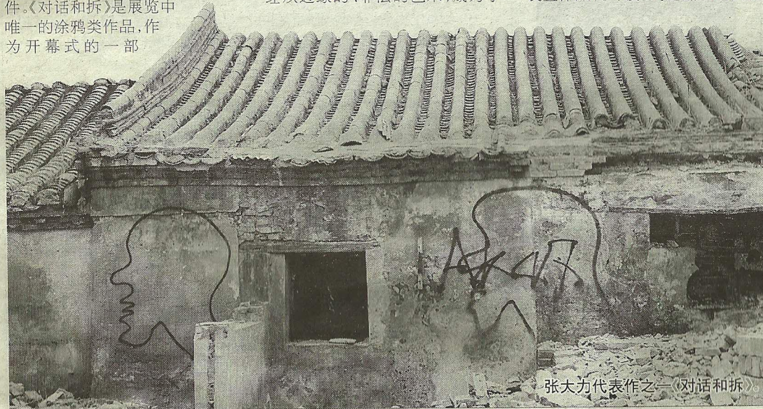
张大力代表作之一《对话和拆》。

张大力的作品具有细节感,重视技术,在2008年完成的《风·马·旗》中,他使用硅胶材料,毛发毕现,冯博一称,《风·马·旗》恍若让你进入了蜡像馆,配饰的衣服、鞋帽像是刚从工地归来或风尘仆仆的归途人群,张大力谈到他在创作时说,“一个作品要有力量,就要做到真实,我的狠劲在于直接地表达意见”,张大力认为,他将逼真的民工带入美术馆,就是希望观众能一眼就能看出他们的受到社会的束缚以及对自由的麻木感。