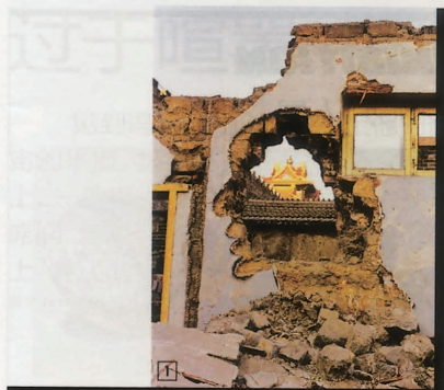
1. 1998年张大力创作的《拆-故宫》 2.《风-马-旗》中的人、马、衣都充满了大量耐人寻味的细节 3.《我们》的解剖草图 4. 张大力在现场装订巨幅的《AK-47》 5.《AK-47》系列表现张大力从城市环境破坏现象，直击“万恶之源”终究是人