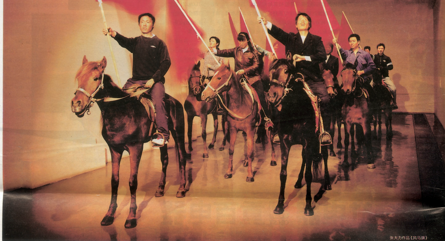
张大力作品《风马旗》