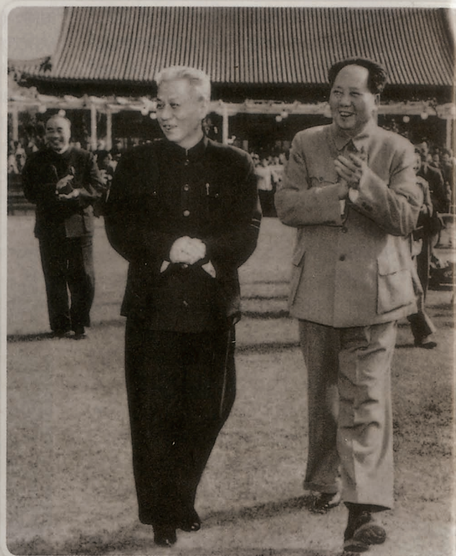
1959年4月，第二届全国人大一次会议期间，毛泽东与刘少奇一起步出会场。后来这张照片再次发表时，明显做过了“修饰”（右图）