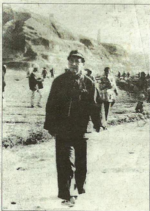
张大力在文物出版社1989年第一版第二次印刷的《纪念毛泽东》一书中发现了未被修改的原图(下)。修改后的图片(上)中毛泽东身后所有的人都被抹去了。