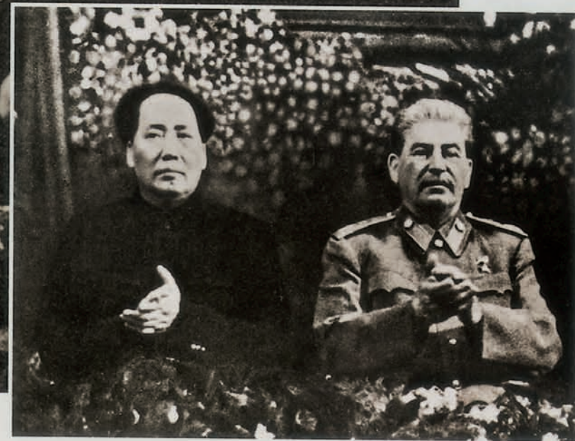
1950年2月，毛泽东同斯大林在一起 刊登于《纪念毛泽东》，中国革命博物馆编，文物出版社1989年3月出版。

1950年2月14日，在前苏联克里姆林宫举行了《中苏友好同盟互助条约》签字仪式。签字仪式前，毛泽东和斯大林在谈判过程中，发生了不愉快的事情。原来，为了反对美国攻击苏联，当时的前苏联外交人民委员莫洛托夫建议由中、蒙、苏三国各发表一个官方声明，对美国国务卿艾奇逊予以驳斥。第二天，毛泽东即以中央人民政府新闻总署署长胡乔木的名义，写了一篇对新华社记者的谈话稿，发回北京。这与苏、蒙用外交部长名义发