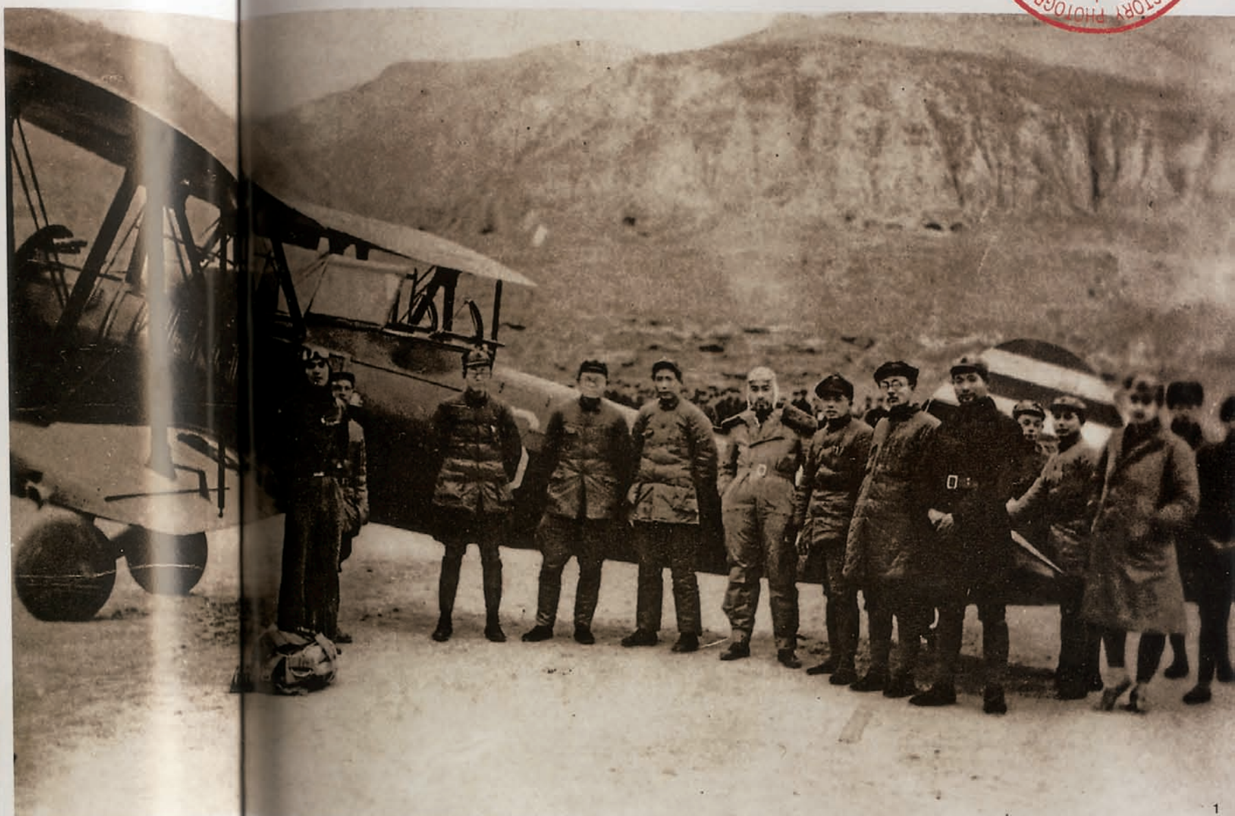
1936年12月周恩来从西安回到延安 刊登于《一代伟人毛泽东》，中央文献研究室第一编研部编，中央文献出版社2003年10月出版。

共抗日。25日蒋介石获释，周恩来等中共代表完满返回延安。代表们在延安东关机场受到毛泽东等人的热烈欢迎，图1是目前能找到的最原始的照片，其中毛泽东左手边身穿飞行服的人即为周恩来。这张图片在后来的政治斗争中被修改了两次，第一次是将周恩来左手边的彭德怀修掉（图2），再后来又毛泽东右手边的张闻天和秦邦宪修掉了（图3）。他们3人都曾与毛泽东政见不一。此时，照片上所剩之人，便寥寥无几了。