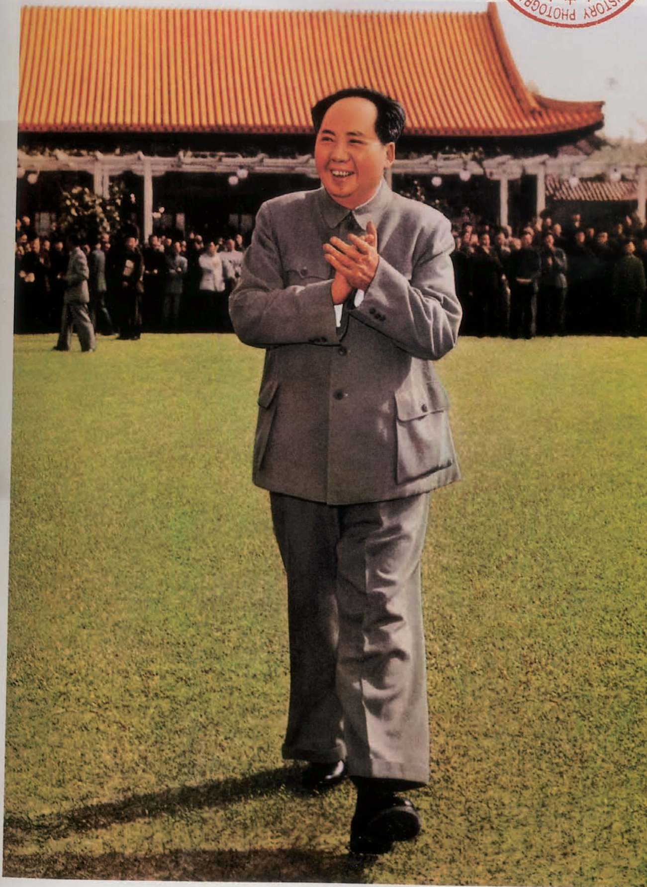
1959年4月在第二届全国人民代表大会上 刊登于《毛泽东主席照片选集》，《中国摄影》编辑部编，人民美术出版社、外文出版社1978年出版。

历史的真实面貌是什么？大概从未有人见过。自有史以来，文字所记载的历史，总会遭到各式各样的质疑。然而自近代有摄影技术以后，颇为直观的影像，就一定与历史的真实划等号吗？答案仍是未必。诸如我们所刊登的这几组照片，它们是中国艺术家张大力多年搜集的成果，有些留存于浩如烟海的出版图册中，有些则尘封在报刊的档案室里……翻看、比对之后，不禁令人唏嘘，原来记录历史的老照片也曾被“二道贩子”经手，留给世人的只有“二手”历史，以及满腔的疑惑与彷徨。