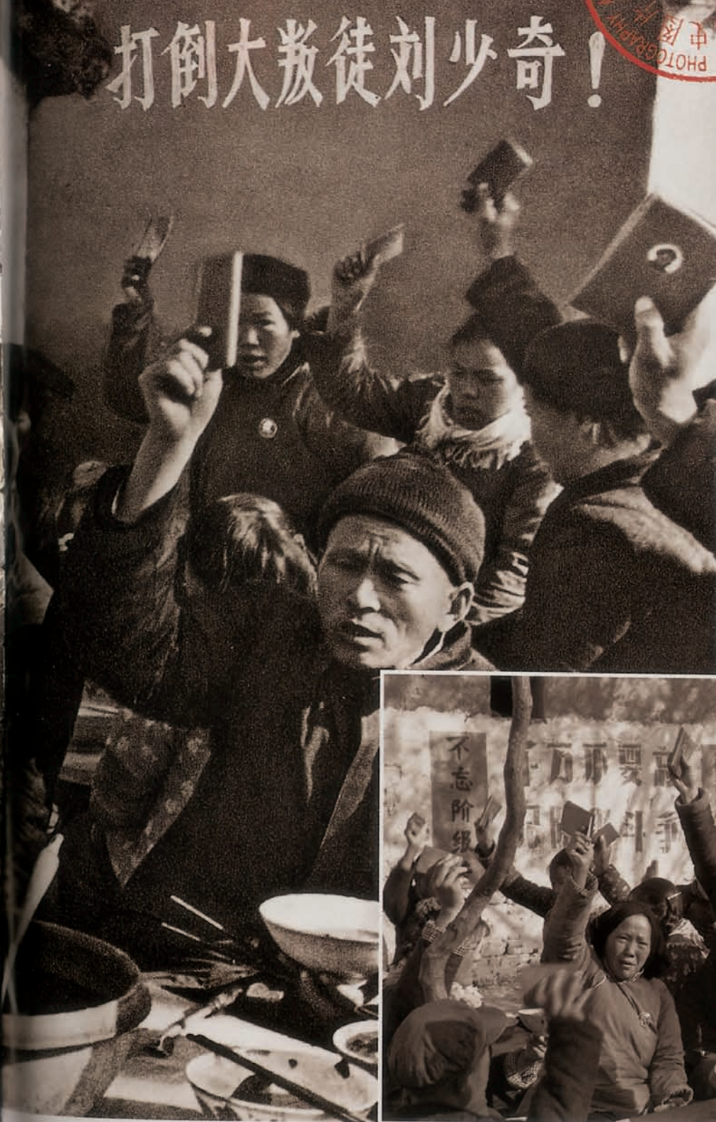
程庄农业劳动学校 原版黑白底片档案