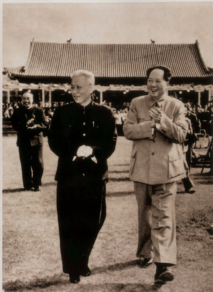
1959年4月在第二届全国人民代表大会上 刊登于《纪念刘少奇》，中国革命博物馆编，文物出版社1986年12月出版。