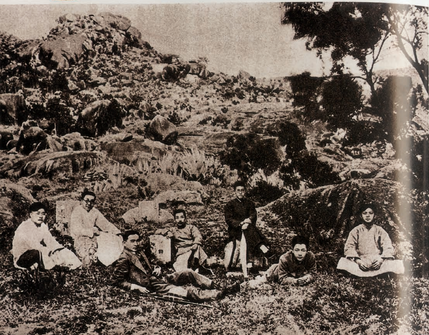
1927年1月2日，鲁迅在厦门南普陀与“决决社”青年合影 刊登于《A Pictorial Biography of Lu Xun》，人民美术出版社出版。