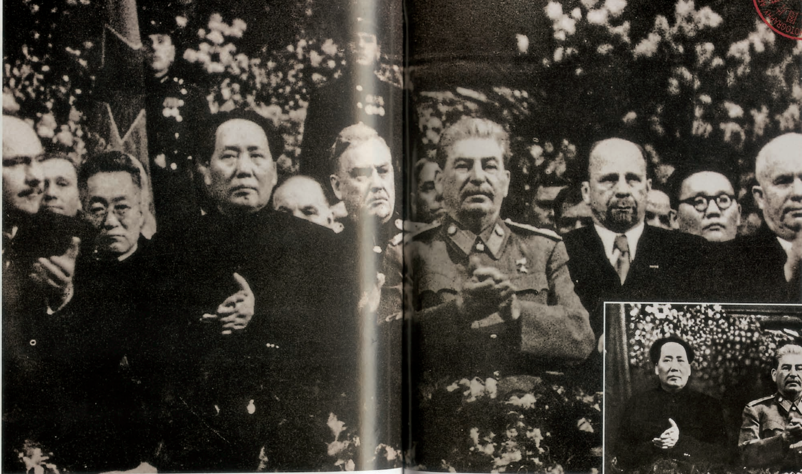
1950年2月，毛泽东同斯大林在一起 刊登于《一代伟人毛泽东》，中央文献研究室第一编研部编， 中央文献出版社2003年10月出版。