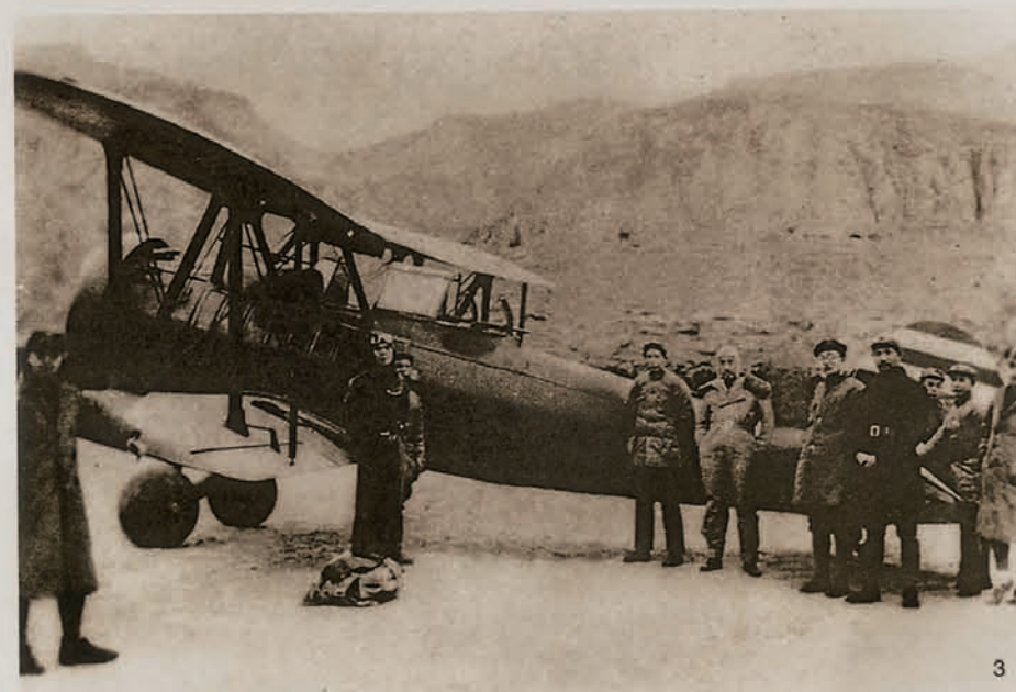
1936年12月周恩来从西安回到延安 刊登于《景仰》，警官教育出版社1993年5月出版。