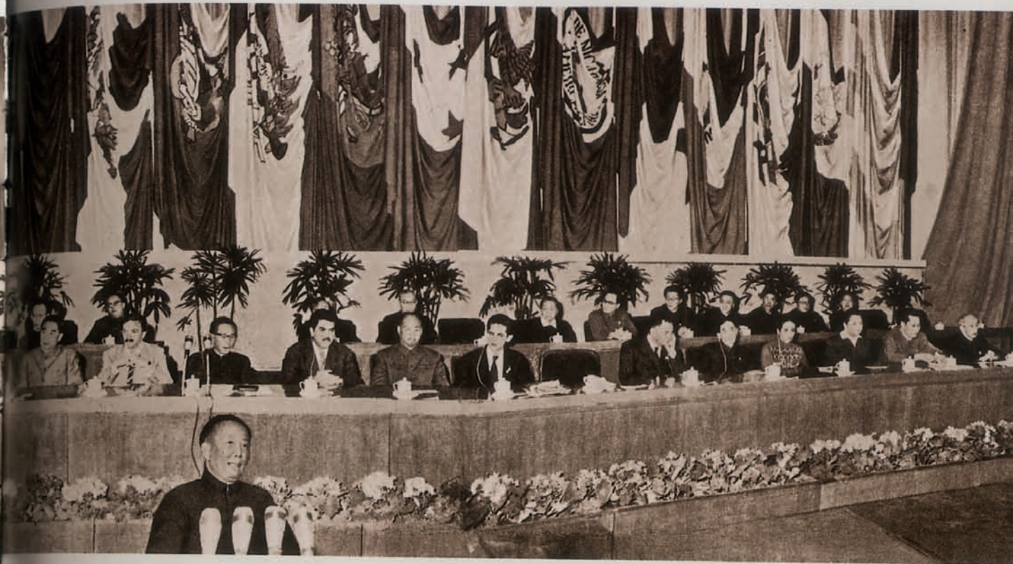
郭沫若在支援拉丁美洲大会上讲话 刊登于《人民画报》1960年8期（俄文版）第2页