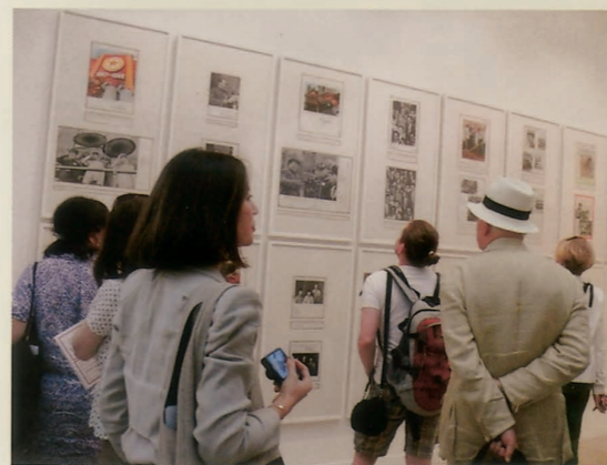
张大力 | 第二历史 | 展览现场

图像和历史关系的研究计划。图片作为我们这个世界最伟大的发明，它不仅记录了现实，在某种情况下它也代替了历史，或者说它就是历史的影子。张大力通过有计划的研究向我们展示了世界存在的形态以及是如何构成的。在这个跨越了七年时间的项目里，张大力利用和仔细研究了中国的旧书、杂志、报纸以及不对外公开的档案馆等等，通过阅读和图片对比的方法找出了图片原来的出处和原始的记录，每一次政治变动都会使记录原始事件的图片改变一次面貌：有的人从他原来的位置消失了、有的被换了头、而有的被增加和美化、还有一些图片根本就不存在，是由好几张不同的图片拼贴在一起的结果。它们都是权力的产物，这些权力来自于政府、摄影师和编辑，他们决定大众的眼睛和头脑能接受什么和不能接受什么；决定了大众能够记忆什么和不能够记忆什么。这个庞大的作品计划由两部分组成，一是从1910年以来的所拍的中国照片，在1949年以后被修改和出版，它是这个国家60年来的世界观的写照；作者在研究中国国内图片时跑遍了从南到北的大多数杂志社和档案馆，通过关系接触到早期的原始资料。有些图片更复杂，但主要是图片内容和历史发生的事件之间的关系是模糊和没边界的或者是没关系的。现在总共有130件图像对比的作品组成，它们的形态有不同出版时间和不同版本的书籍、报纸、杂志以及原始图片底片扫描、拼贴图片扫描等等。展示这些图片能让观者看到人类对图片的野心及权力是如何操控历史的，在不道德的权力面前真实也许是唯一的良心。ARTI