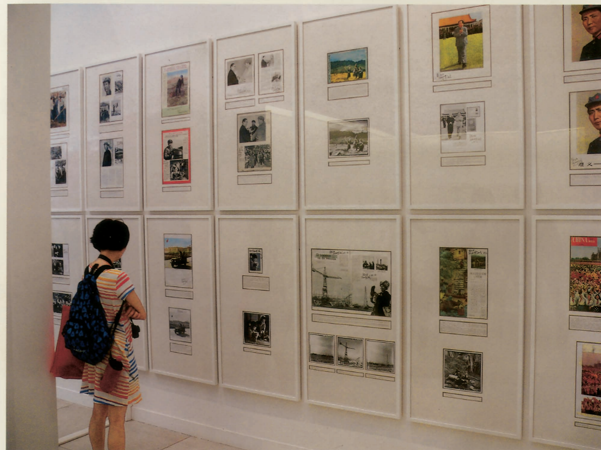
张大力 | 第二历史 | 展览现场