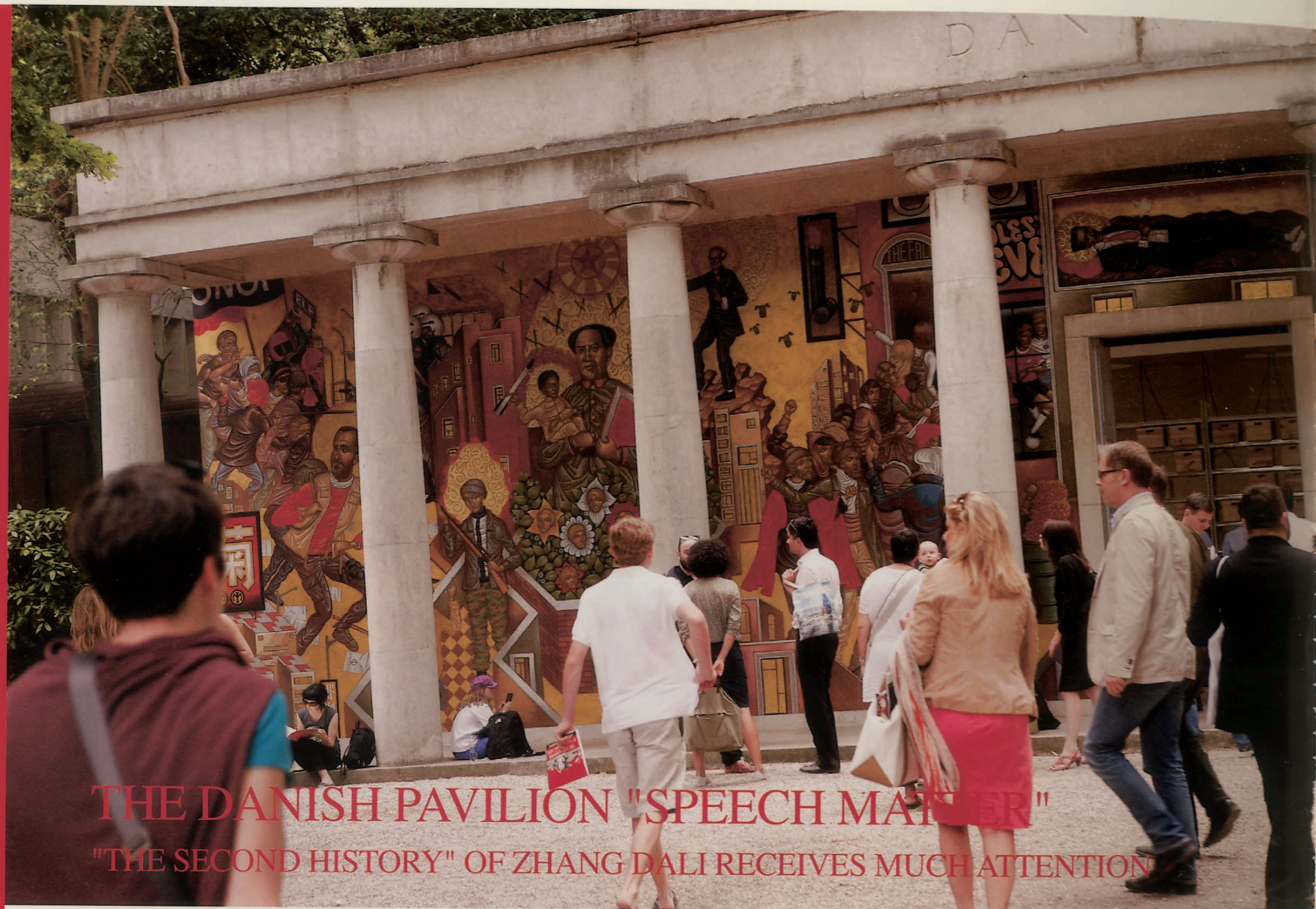
THE DANISH PAVILION "SPEECH MATTER" "THE SECOND HISTORY" OF ZHANG DALI RECEIVES MUCH ATTENTION