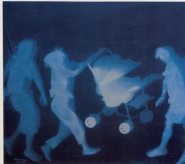
生活(1) | 纯棉布蓝晒 | 240 x 280cm | 2011-7-30