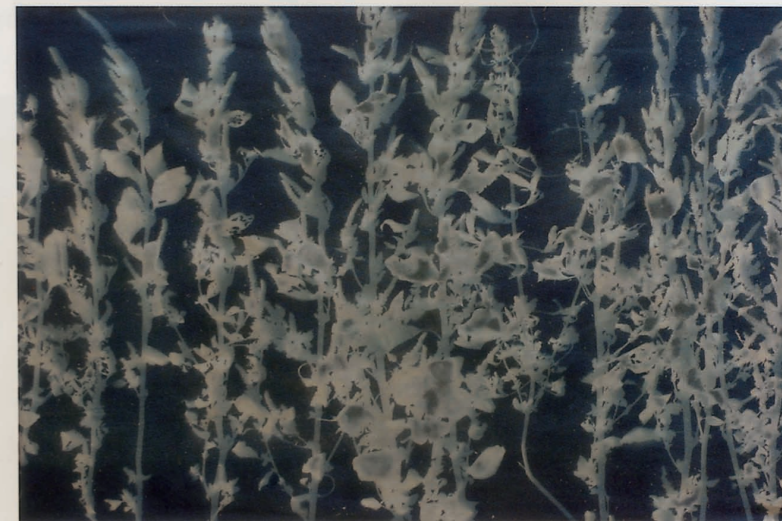
紫色的花 | 11.74 x 150cm | 2009-8