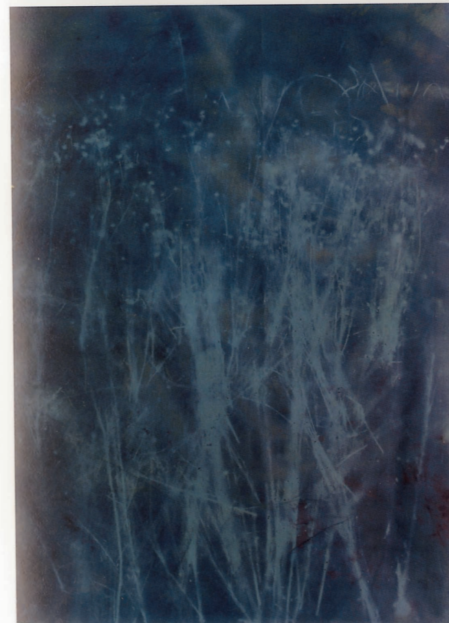
荒野19 | 116 x 190cm | 2009

在这个如绞肉机般的城市里，人们没有多少机会可以欣赏和享受到自然的风光，公路两旁都是人工剪裁和修得整整齐齐的树木以及在节日来临时摆放的花坛。我们忘记了我们曾经的生活方式：“宁可食无肉，不可居无竹”，也无法亲近自然，珍贵的古迹被愚蠢和贪婪、短视的人们所毁灭，我们离传统越来越远。2009年春天，我经过那块荒地时，突然想到在这个快速发展的现代都市里，环境由谁来做主？谁才是城市的真正主人？我们永远被改造？永远被别人安排？