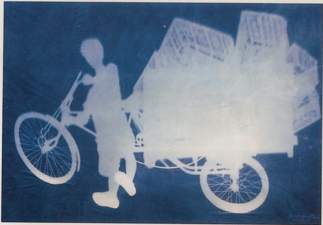
车夫(8) | 纯棉布蓝晒 | 220 x 320cm | 2011-8-18