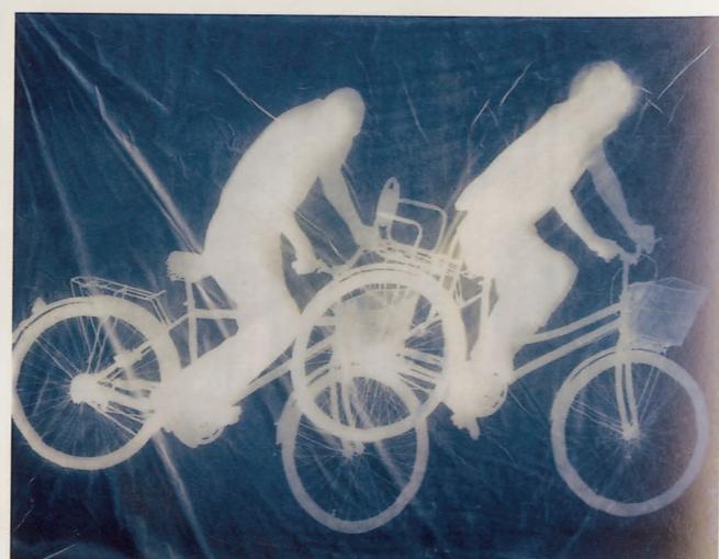
骑自行车的人 | 纯棉布蓝晒 | 230 x 300cm | 2010-5-29