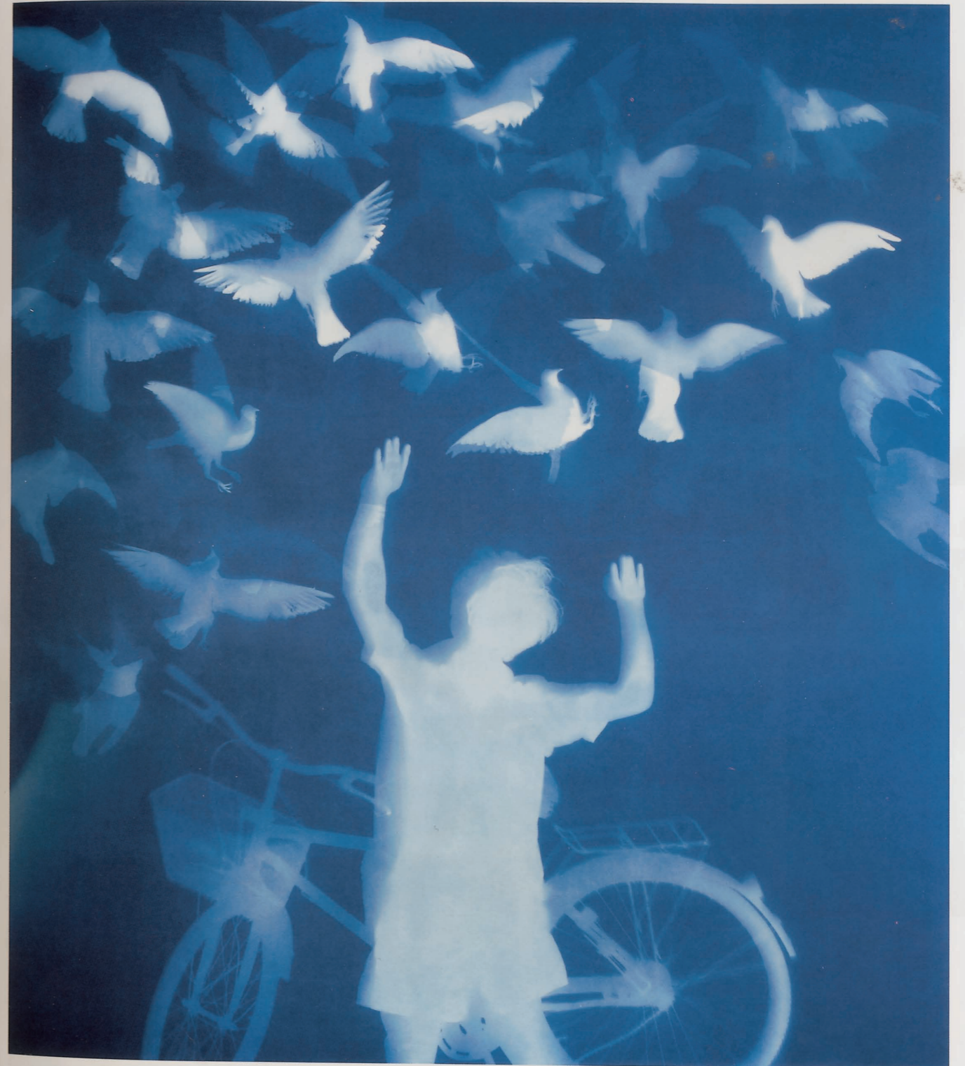
鸽子2 | 纯棉布蓝晒 | 270 x 246cm | 2011-9-2