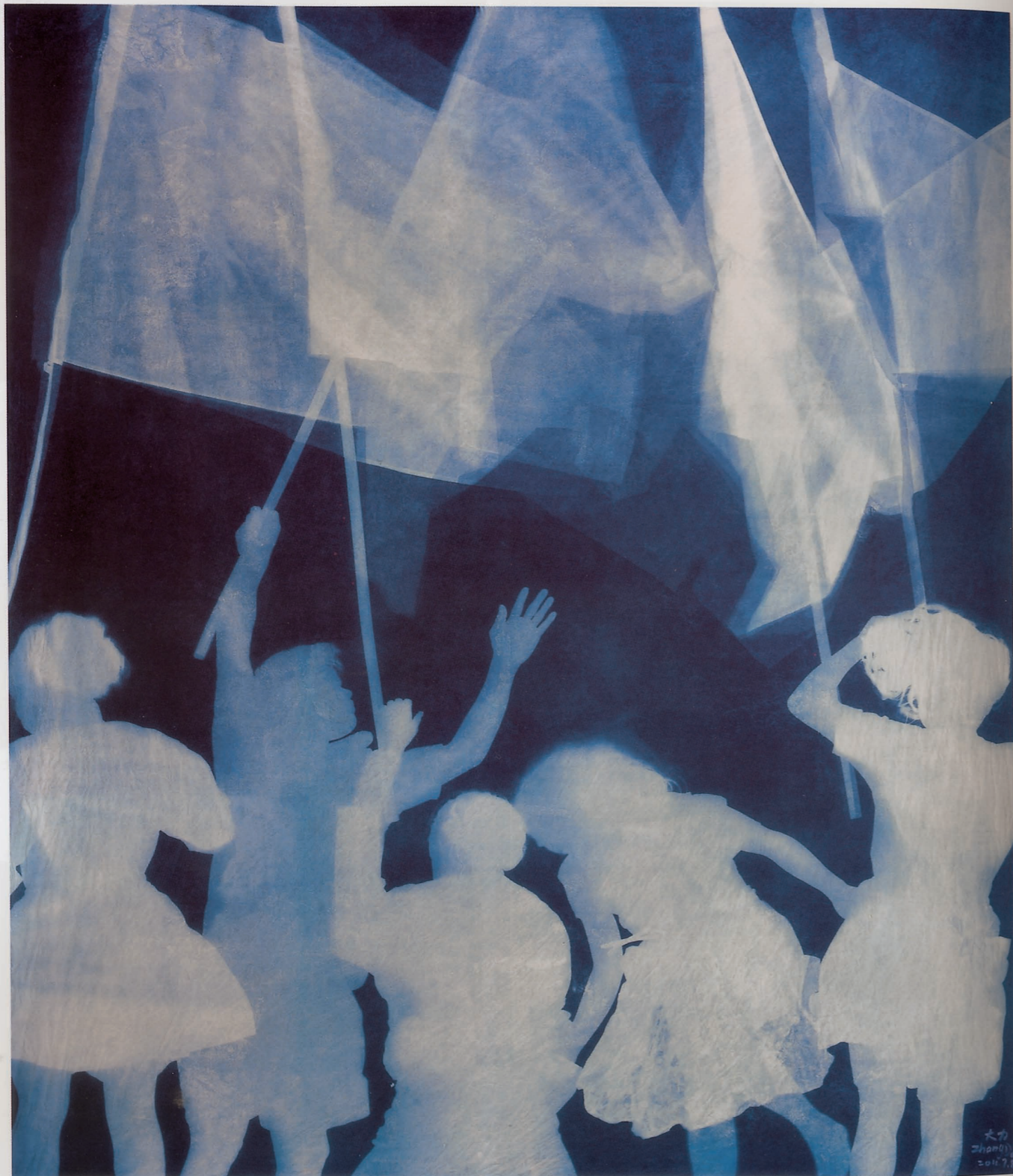
7月(4) | 纯棉布蓝晒 | 280 x 237cm | 2011-7-8

在此之前，我已经对蓝晒成像技术做了一些研究：蓝晒成像法不需要用相机，而是将柠檬酸铁铵与铁氰化钾混合试剂涂抹在画布的表面上，然后曝光于太阳下，紫外线与试剂发生反应产生氯化铁，没有受光区域的影子形成白色，而曝光部分则会变成蓝色，仿佛X光片。