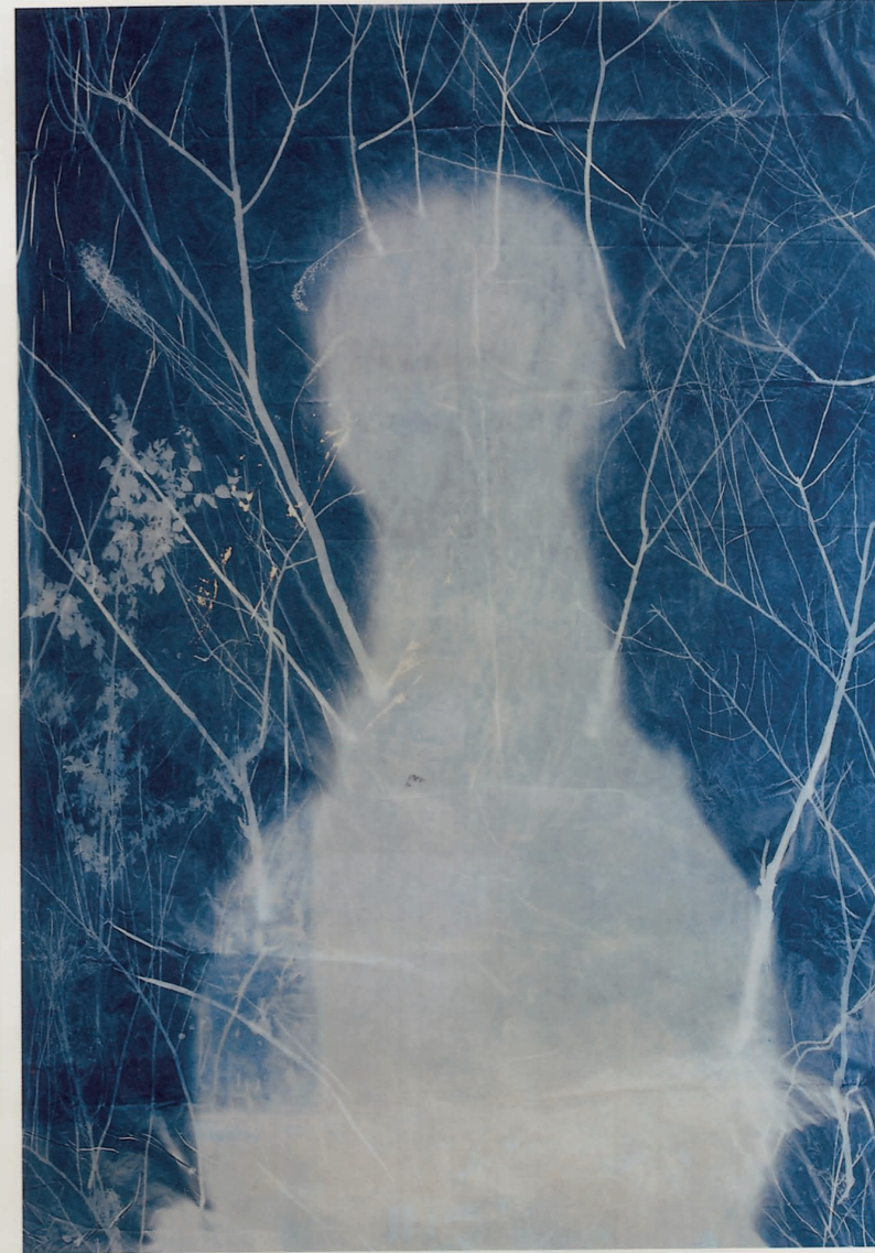
4号辽塔 | 纯棉布蓝晒 | 360 x 260cm | 2010-5-20 昌平