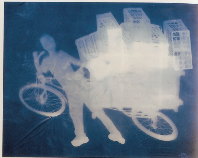
车夫(5) | 纯棉布蓝晒 | 258 x 330cm | 2011-8-17