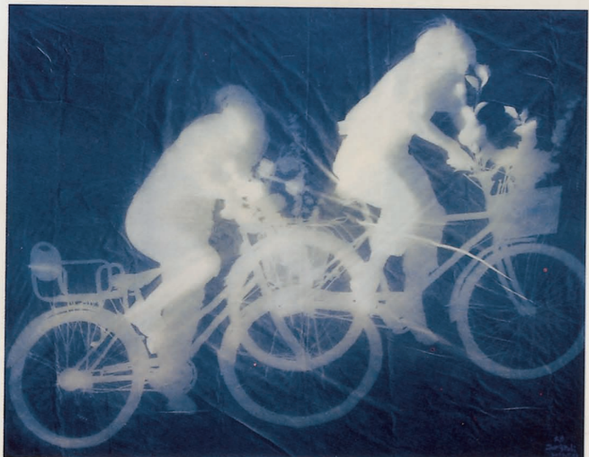
骑自行车的男女 | 纯棉布蓝晒 | 230 x 300cm | 2010-5-31