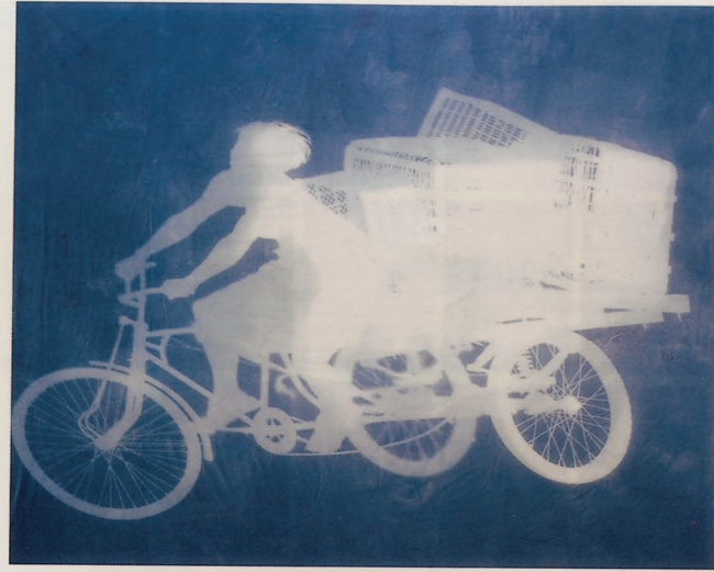
车夫(7) | 纯棉布蓝晒 | 258 x 330cm | 2011-8-18