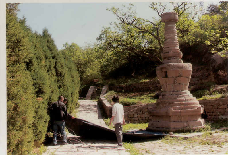
昌平辽塔工作记录