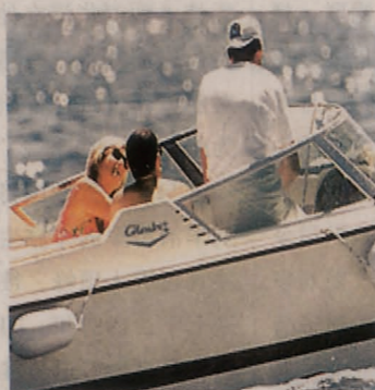
..... 1997年夏天，威尔士王妃戴安娜与男友多迪·艾尔-法耶德乘游艇度假，被狗仔队偷拍。英国《每日镜报》将两人谈话修改为两人亲热的镜头刊登。这年8月6日，戴安娜曾写信感谢多迪安排的六日游艇旅行，称“我要给你世界上全部的爱，我还要一如既往地一百万次衷心地感谢你给这个女子的生命带来如此大的欢乐”。9月1日凌晨，这对情侣双双死亡。