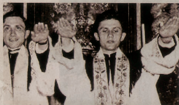
..... 1999年，被修改成行纳粹礼的罗马教皇。