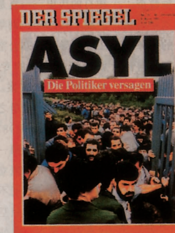
..... 1993年，德国《明镜》周刊为加强新闻效果，在申请难民场景的图片上增加了两名边防警察。