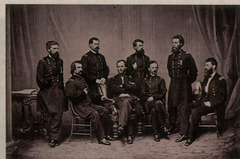
..... 1865年，美国内战时的将军们。摄影者马修·布拉迪是世界公认的第一位成功的商业摄影记者，但同时也是最熟练的修改者之一。这幅照片是内战时以火烧亚特兰大而闻名于世的将军威廉·谢尔曼（前排左二）与手下高级将领的合影，摄影师在前排最右添加了小弗朗西斯·布莱尔，他曾跟随谢尔曼在亚特兰大与南卡罗来纳州的战役中作战。