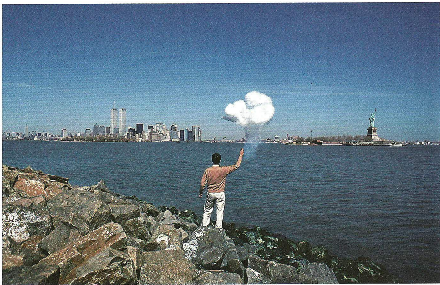
图7 蔡国强面向曼哈顿实施其系列作品《有蘑菇云的世纪：为二十世纪作的计划》，1996年4月20日