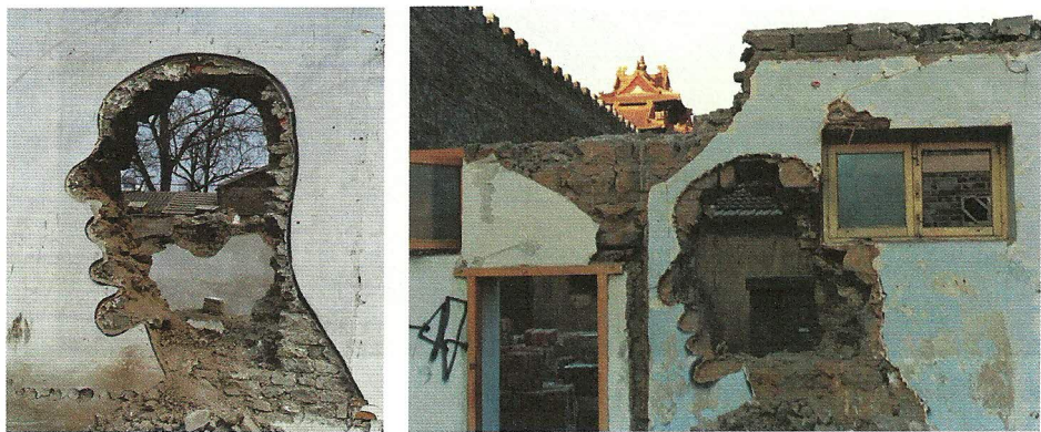
图2左 张大力 拆·西单时代广场 柯达相纸手工放大 150X100cm 1999.3