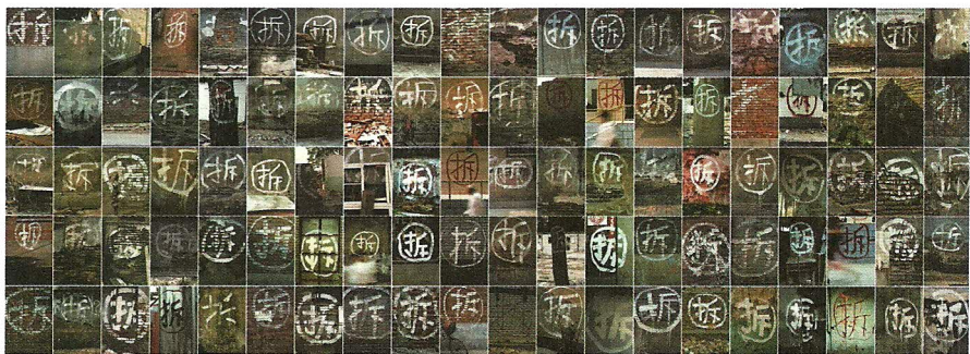
图1 王劲松 百拆图 概念摄影 彩色照片 125×340cm 1999

模城市建设活动也随之展开，很多老旧建筑，或是被认为妨碍规划的建筑都被划入拆迁的范围，我们随处可见圈写在旧建筑上的“拆”字。艺术家王劲松在1999年以北京乃至全国的城市建设中随处可见的圈写在要拆除的旧建筑上的“拆”字为对象，拍摄了百幅“拆”字，命名为《百拆图》(图1)，并把这百幅作品顺序编号为1900至1999。王劲松在《有关〈百拆图〉百幅摄影作品简述》中说：“‘拆’似乎是一条临界线，左边是毁灭，右边是重建。‘拆’的意义藉此显现，那么何谓新、何谓旧呢？我感到既悲凉，又激动。”王劲松多年对“破”的疑虑，使他为找到能宣泄内心情感的语言而“激动”，同时，也为“拆”的现实及其文化背景而“悲凉”。《百拆图》体现的是一个艺术家的良知和反省的能力。 1