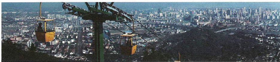
图3 缪晓春 海市蜃楼 概念摄影 彩色照片 2004

外衣下对现有城市景观的破坏，而这种破坏正是一种暴力。在这个暴力关系中，国家是发出合法指令的唯一源泉，但暴力的实施者却是身为劳动者的民工，人们直接看到的是民工挥舞大锤砸毁、拆除房屋建筑。 2