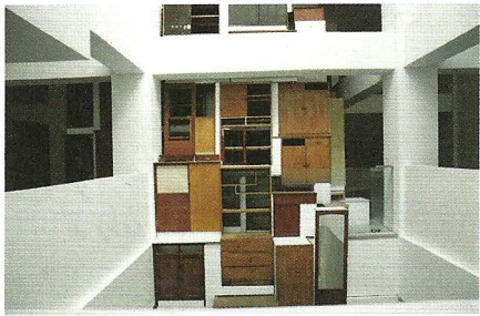
图5 汪建伟 隔离 409个旧家具 2009

以及它们在今日中国的现实呈现，散发着一种对中国现代化进程的隐喻和思考，正如徐冰本人所言：“事实上凤凰在这两年的过程中，和中国的现实状况，中国的经济高涨，中国的进程、变化等等，这样一个历史阶段的具体时间有非常密切的联系，包括奥运会、经济危机。”再者，讨论了中国历史及现实的伤痕与美好梦想的关系。两只巨大的“凤凰”既凶悍又华丽，它们通过每一片翎羽散发着神性，这神性是通过每一个劳动者之手的触碰传递的，如同中国人集体情感和愿望的写照，每一个在现场正视它的人都会在它身上看到自己的能量。同时，也深切关注环保主题。