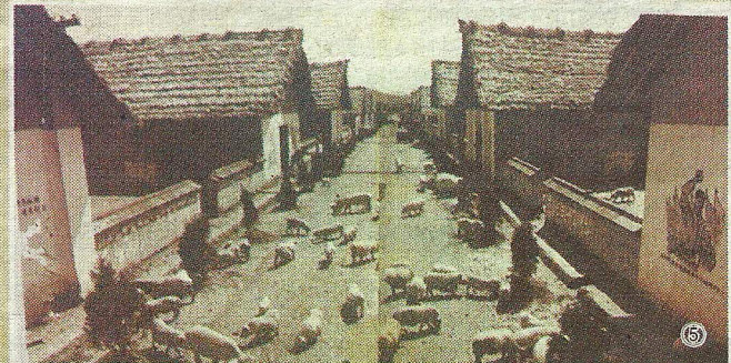
⑤1960年第9期俄文版的《人民画报》上刊登的“养猪事业大发展”的图片:是经过黑白手工拼接的图片。仔细看地上走的猪都是一样的。