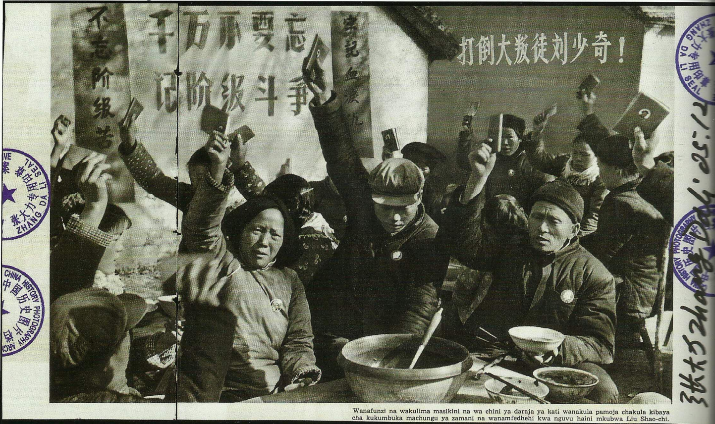
Wanafunzi na wakulima masikini na wa chini ya daraja ya kati wanakula pamoja chakula kibaya cha kukumbuka machungu ya zamani na wanamfedhehi kwa nguvu haini mkubwa Liu Shao-chi.