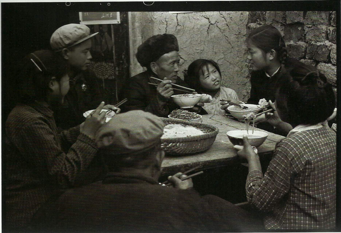
张大力：《中国历史图片档案86，程庄农业劳动学校（2）Chengzhuang Agriculture Labour School》原版黑白底片档案 14466