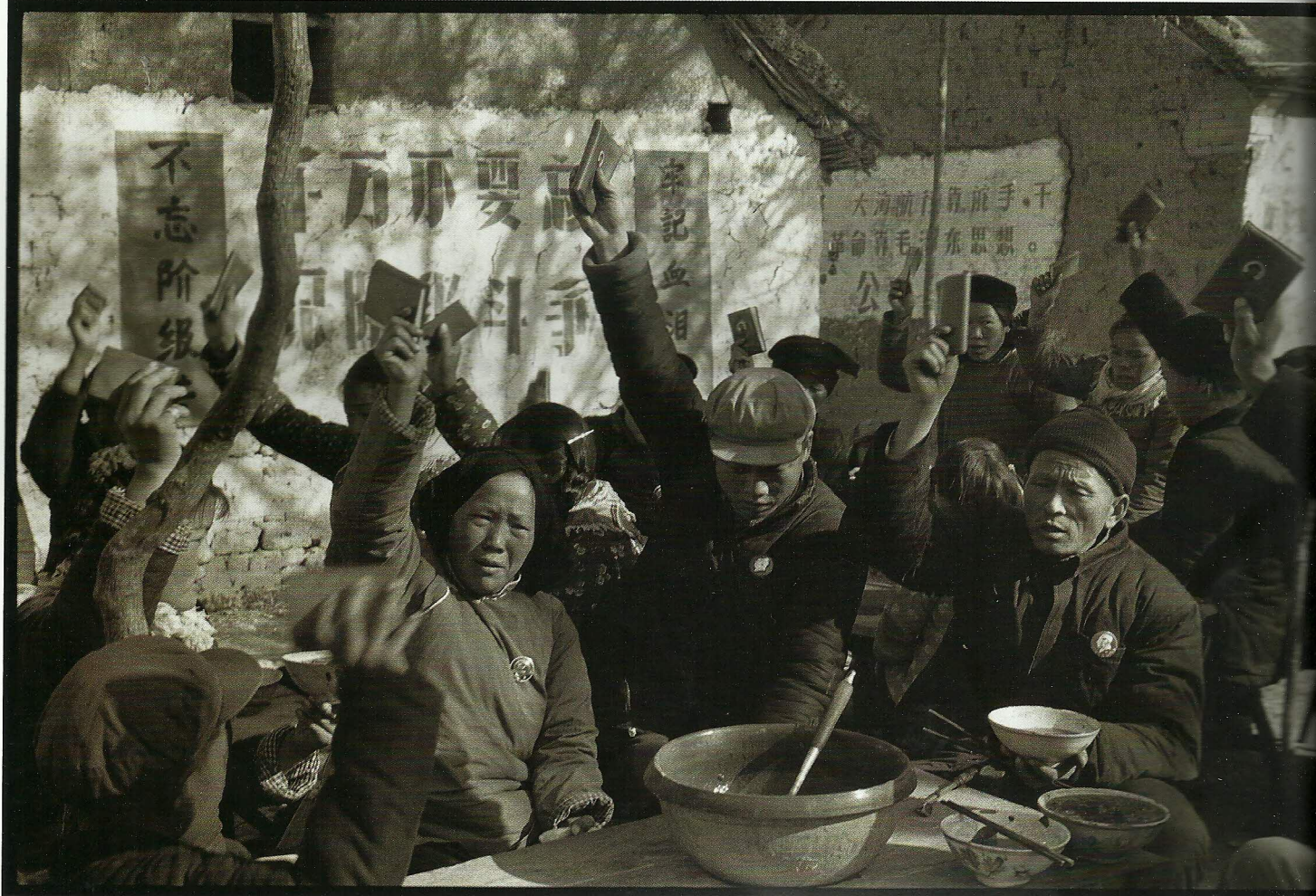
张大力:《中国历史图片档案85_程庄农业劳动学校(1)Chengzhuang Agriculture Labour School》原版黑白底片档案144465