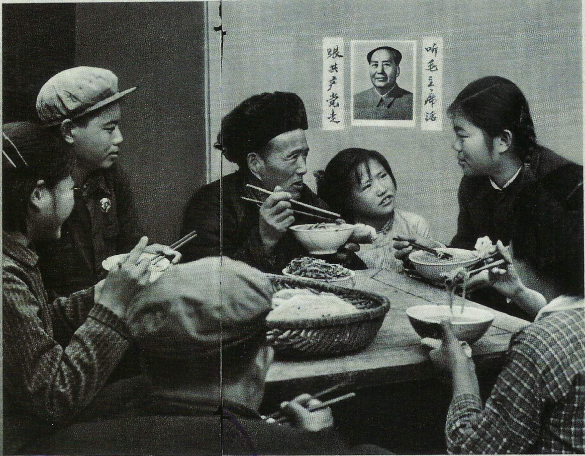
张大力：《中国历史图片档案86，程庄农业劳动学校（2）Chengzhuang Agriculture Labour School》图片，2005