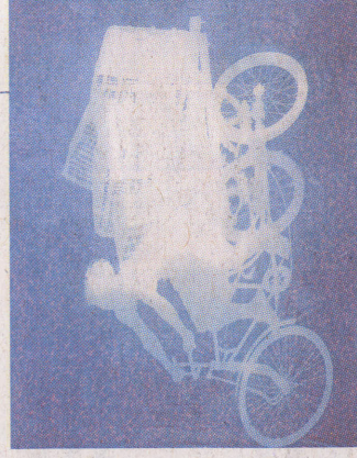
▲《车夫-7》纯棉布蓝晒 2011年