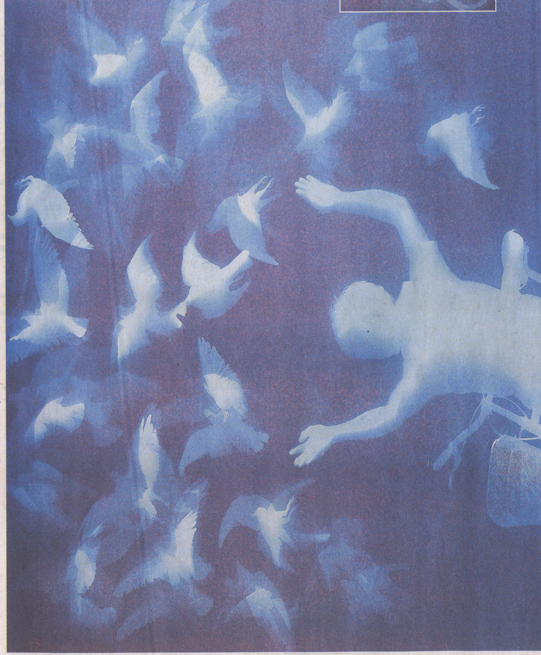
◀《鸽子-2》(局部)(局部) 纯棉布蓝晒 2011年

编辑 刘洋 美编 宋媛媛 黄校 杨少坤 电话: 84285566-3104 zgyhzk@126.com