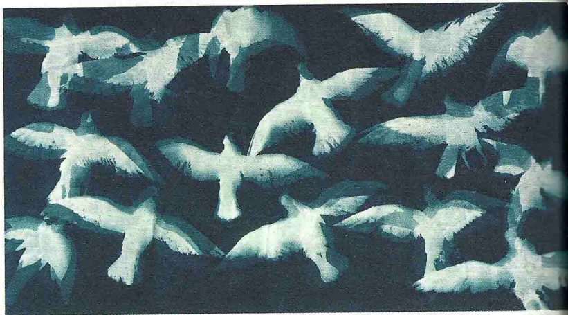
01 / 广场1号 布面油画 103×149cm 2013