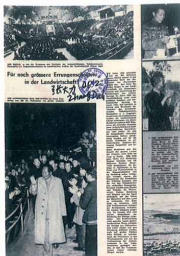
111. 为了农业的巨大成就 A. 《人民画报》1959年1月(2期)(德文版) P.2 “为了农业的巨大成就” 编辑者: 人民画报社, 社址: 北京阜成门外百万庄, 电话: 9.2127 电报挂号: 3973 出版者: 外文出版社, 社址: 北京阜成门外百万庄, 电话: 9.0951 转 036 电报挂号: Folapress, 印刷者: 北京新华印刷厂, 厂址: 北京阜成门外北礼士路, 电话: 9.5073, 总发行处: 邮电部北京邮局, 订购处: 全国各地邮电局、所, 代订代售处: 全国各地新华书店, 国内售价: 道林纸本每册7角、报纸本每册3角5分, 本报图片文字如需复制请注明转载本报, 本刊代号: 2-7。 B. 原版黑白手工拼接图片档案