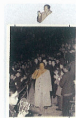
111. 为了农业的巨大成就 B. 原版黑白手工拼接图片档案

111. 为了农业的巨大成就 A. 《人民画报》1959年1月(2期)(德文版) P.2 “为了农业的巨大成就” 编辑者: 人民画报社, 社址: 北京阜成门外百万庄, 电话: 9.2127 电报挂号: 3973 出版者: 外文出版社, 社址: 北京阜成门外百万庄, 电话: 9.0951 转 036 电报挂号: Folapress, 印刷者: 北京新华印刷厂, 厂址: 北京阜成门外北礼士路, 电话: 9.5073, 总发行处: 邮电部北京邮局, 订购处: 全国各地邮电局、所, 代订代售处: 全国各地新华书店, 国内售价: 道林纸本每册7角、报纸本每册3角5分, 本报图片文字如需复制请注明转载本报, 本刊代号: 2-7。 B. 原版黑白手工拼接图片档案