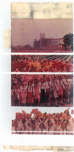
原图色彩手工拼贴档案 Original color photos pasted together by hand. Archive.