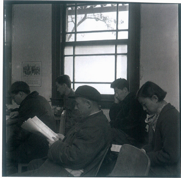
原版黑白底片档案 106136 Original black and white negative, Archive no. 106136