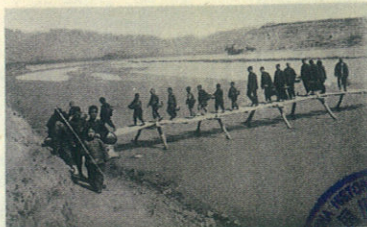
(1788) 一九四一年，唐县人民组成慰问团到前线慰问八路军。