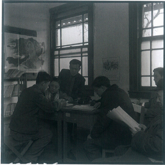
原版黑白底片档案 106136 Original black and white negative, Archive no. 106136