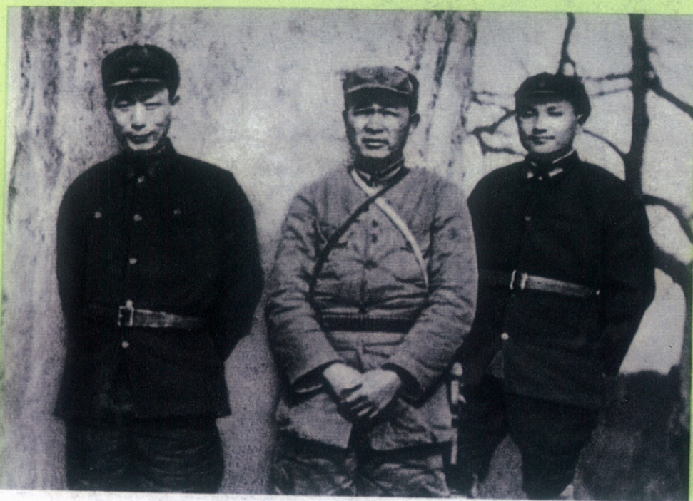
邓小平同志、聂荣臻同志、徐海东同志在陕北合影。