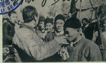
(1792) 乡亲们向参军青年敬酒。