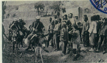
(1790) 群众自动组织村头慰劳站，慰问过往伤员。