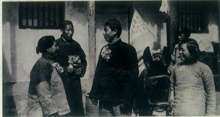
(1793) 解放区青年踊跃参加八路军，这是参军青年的父、母、妻子在欢送他入伍时的情景。