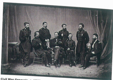
Civil War Generals, c. 1865

Generally regarded as the world's first commercially successful photojournalist, Matthew Brady was also one of the medium's most accomplished manipulators. In this group portrait of William Tecumseh Sherman and his top officers, he added one figure. For the record, the men are, standing, from left: Oliver Otis Howard, William Babcock Hazen, Jefferson Columbus Davis and Joseph Anthony Hawser; seated, from left: John Alexander Logan, Sherman, Henry Warner Stocum and Francis P. Blair.