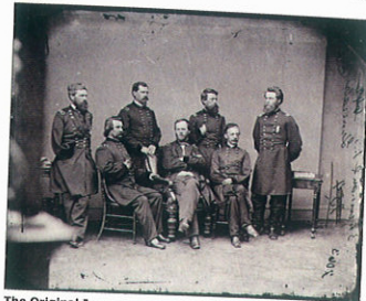
The Original Image