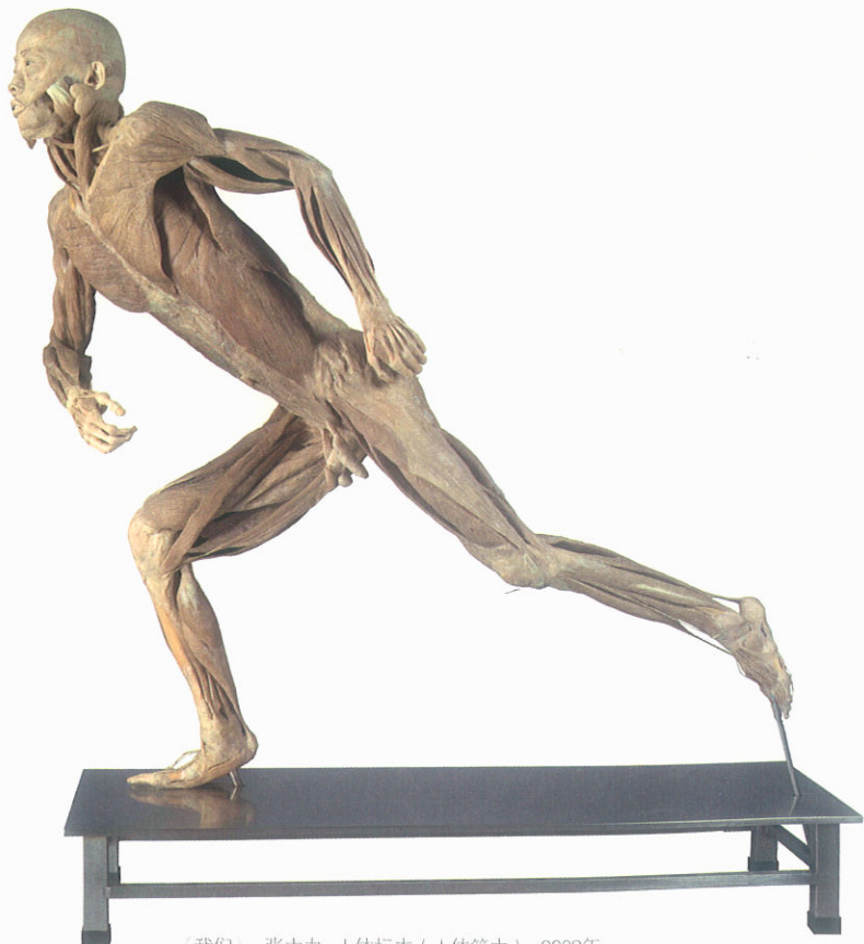
《我们》 张大力 人体标本（人体等大）2009年