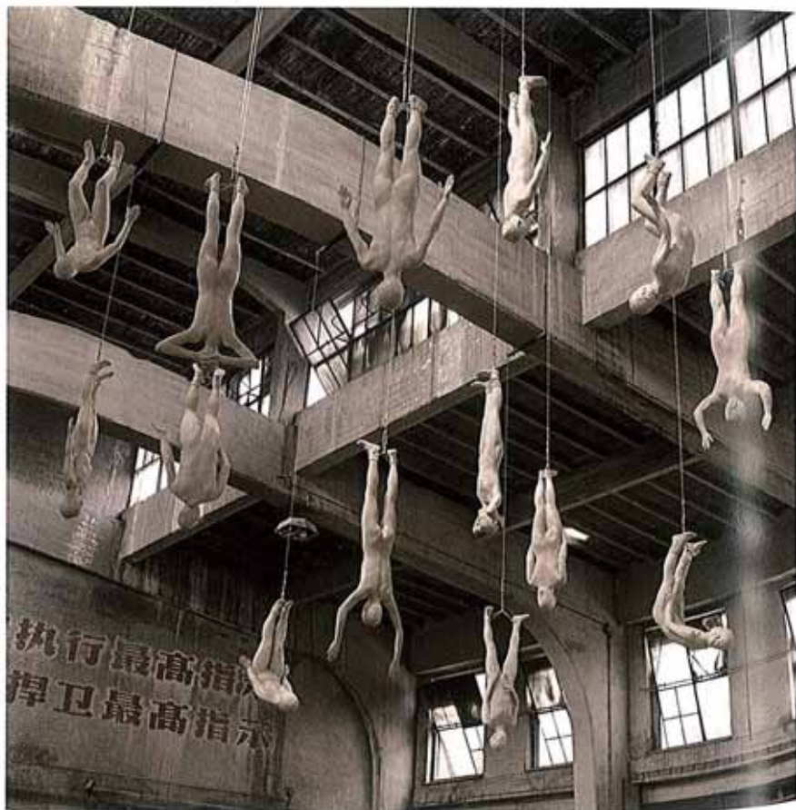
种族·红色记忆 展览现场 2003 张大力 798大窑炉北京