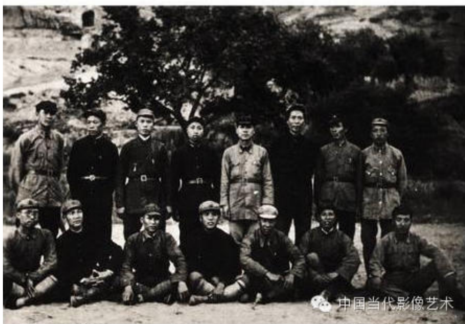
下图右下角的是林彪。九一三事件之后，林彪在相关的照片中被抹掉。上图，林彪则消失了