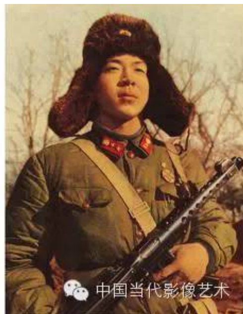
共产主义战士雷锋，1965年，原片中凌乱的灌木被修掉，换成了挺立的松柏。