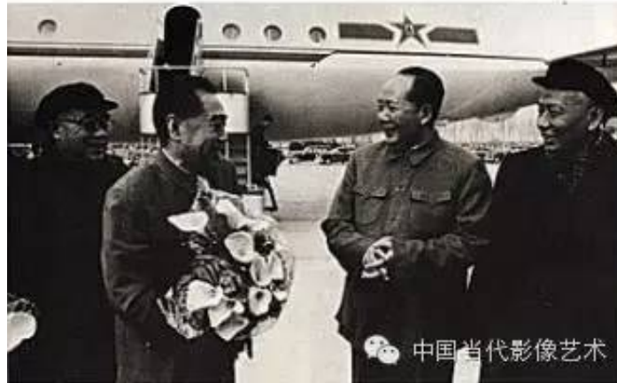
周恩来赴苏联参加十月革命47周年庆祝活动。毛泽东、刘少奇、朱德到机场迎接从莫斯科归来的周恩来。刘少奇被打倒后，在照片中被抹去。