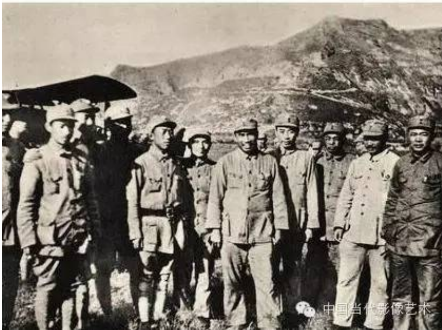
1938年10月延安机场。庐山会议之后，彭德怀被打倒，此后的照片被抹掉。