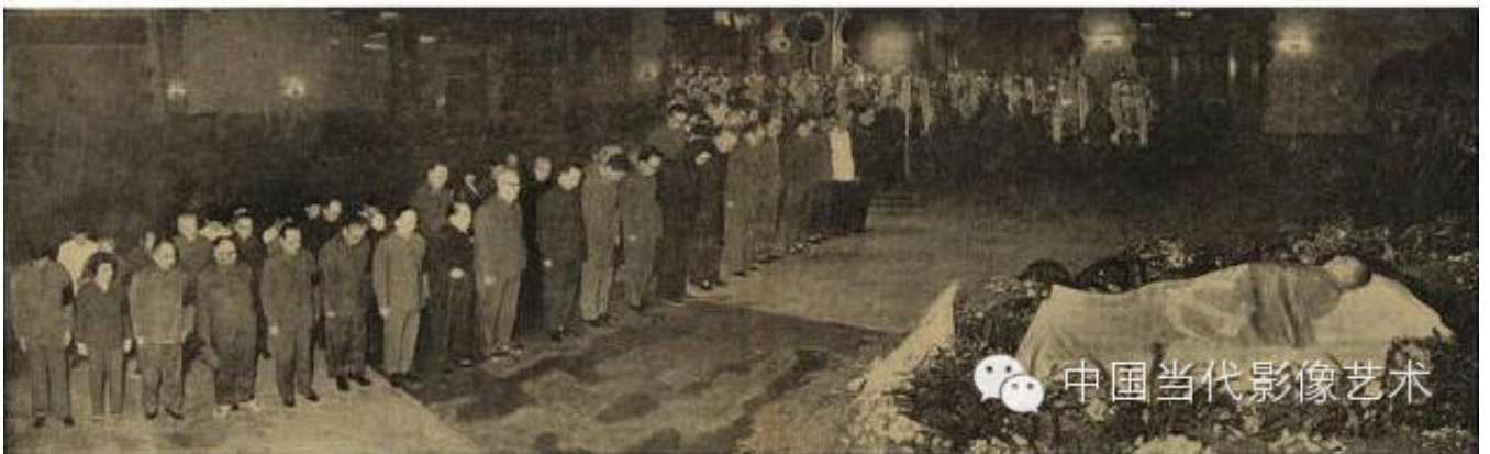
上图，粉碎四人帮后，官方宣传的报道紧急撤去了毛泽东遗体告别仪式中的四人帮照片，留下了空白。下图为毛泽东遗体告别时的原版照片。（以上图文来自：