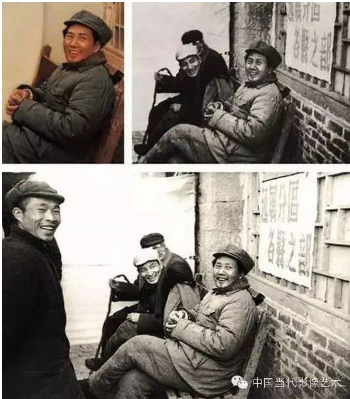
文革中，陈云被打倒，下放江西的农村。这是一张历史旧照被篡改的过程。