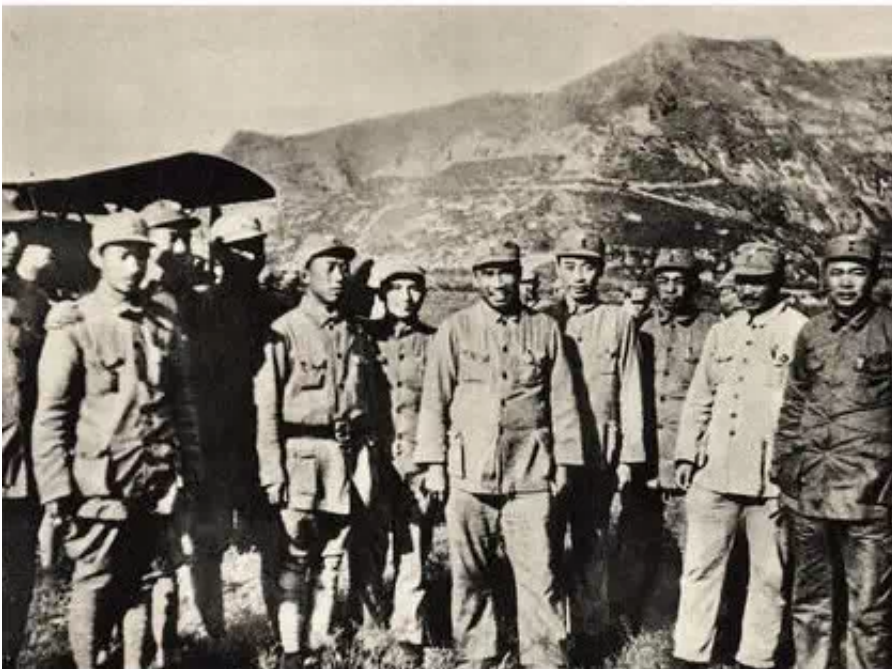
1938年10月延安机场。庐山会议之后，彭德怀被打倒，此后的照片被抹掉。