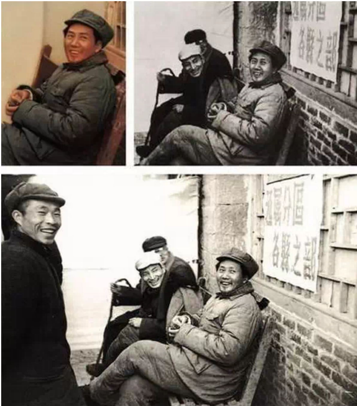
文革中，陈云被打倒，下放江西的农村。这是一张历史旧照被篡改的过程。