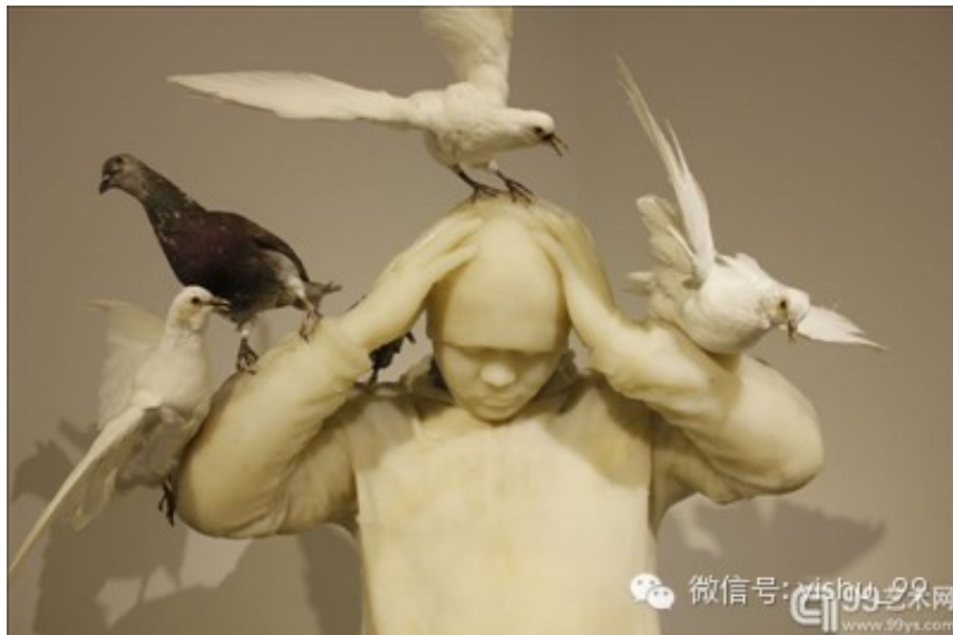
《广场6》硅橡胶 220x120x80 cm 2014