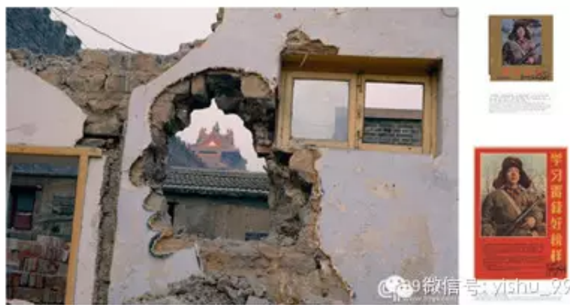
左：张大力早期作品《对话和拆》；右：第二历史系列作品中的《英雄》

谈到张大力的新作时，李峰用了“继续推进”这个词。广场作为公共性的空间，与私密空间有非常大的距离，他认为张大力关注的不仅仅是广场本身，而是将广场视为同整个城市、市民间的互动的场所。与其以往的作品拆迁、涂鸦一样，都体现了个人对城市的认知与互动，关注的点仍然是城市话题，城市问题，只是把它变得更为立体。很多艺术家只是关注形式本身、自我本身，张大力却是敏感的抓住了城市化进程这一问题，始终与中国社会的脉搏和节奏保持一致。李峰认为基于现实又能超越现实的艺术是据有长久生命力的艺术，张大力以其行为和装置、绘画、摄影做出重要成果，实践着基于现实又超越现实。