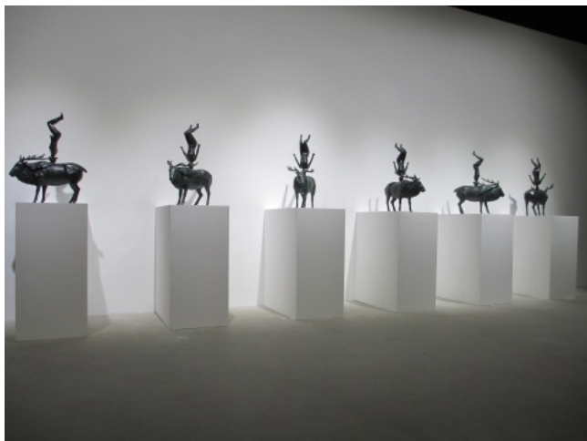
张大力作品《在空中》