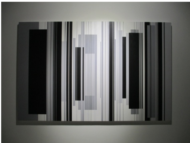
崔岫闻作品“轮回”系列