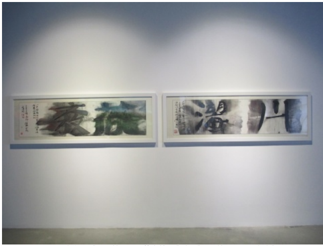
谷文达作品《谷氏简词·百花齐放#3》与《谷氏简词·山川湖海》

通过展墙的搭建，不同风格的艺术作品被巧妙地地区分开来。空间中的镇展之宝莫过于竖立在展厅入口处的向京的作品《异境——这个世界会好吗？》。面对它，似乎无需多言，回望的表情催生出一丝怜悯之情。崔岫闻展出了系列“轮回”中的部分作品。此次是该系列在去年九月于沪申画廊展出后的第二次亮相。艺术家强调，在观看作品的时候，需将视觉以外的感官功能打开，在这个特殊的空间中感受自我与艺术品的关系，感受身体与空间的关系。对于主题“社区植入计划”，崔岫闻表示，任何一位艺术家的作品都是植入社区的一部分，而观众在进入社区的时候，通过不同的空间层发现了自己思维空间以外的可能性才是艺术值得与人互动的形态。面对刘俐蕴的作品《联结》，观众不约而同地用安静、纯洁等词语形容各自对作品的第一感受，这恰好体现了艺术与群众之间无声的沟通。张大力的布面作品《深蓝的天空》是其“广场”系列中的一部分。站在一张张通过蓝晒法呈现出的白鸽在空中飞翔的景色前，个人记忆中的昔日美景，慢慢显现。虽然展出的作品并不是艺术家最新创作的，但其中暗含的社会性却让观者获得了与艺术沟通的机会。纵观展出的作品，并没有视觉语言太过激烈的，如艺术家曹晖所说，这考虑到展览的协调性、观众的接受度。他带了两组作品：一组是2006年左右创作的系列“揭开你”，一组是近几年创作的《如果我是...》和影像《不要忘记我》。前者是对环境、生物、人与自然间直白的追问；后者则在原有的基础上往前推进了一步。“面对美术馆内的金典名作，我们只看到了表象，通过解剖它们，查看表里如一的可能性。”