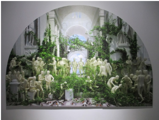
缪晓春作品《新雅典学院》