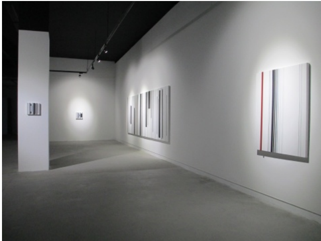
崔岫闻作品“轮回”系列