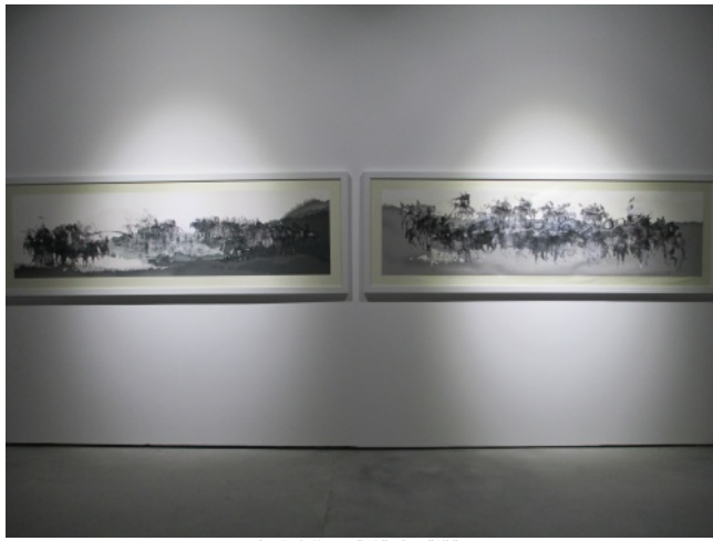
缪晓春作品《憩》与《往》