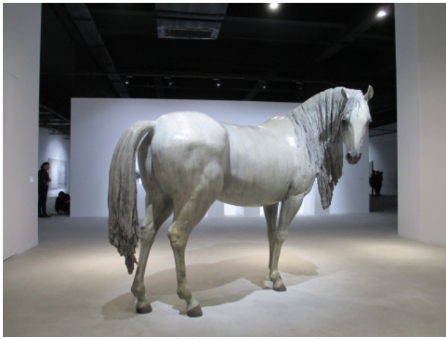
向京作品《异境——这个世界会好吗？》