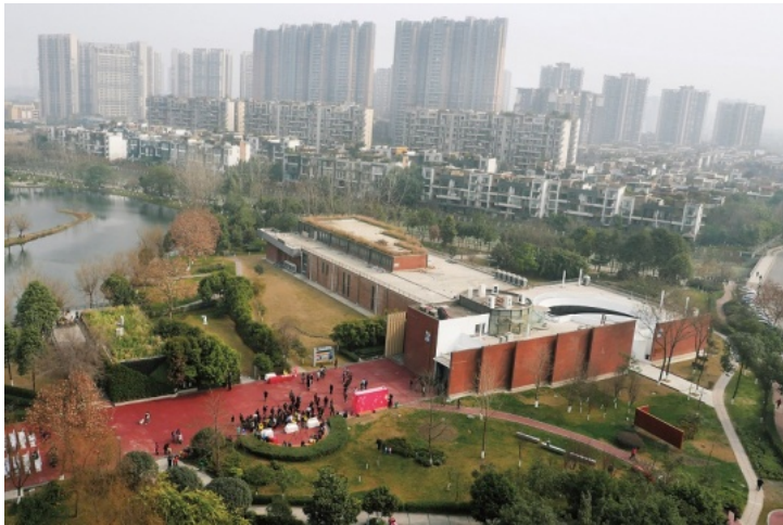
成都国际文化艺术中心外景