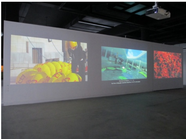
谷文达作品《天堂红灯》、《中国》、《基因与蜕变——大众当代艺术日系列》（从左至右）

“社区植入计划”与俞可去年在广州当代艺术中心策划的“8+1实验艺术”的方案”类似，都是在艺术圈的二线城市强调艺术与当地的关系。俞可表示无论是政府还是社区，都有艺术上的诉求，通过强调它们之间的关系，突出这类远离权力、远离殖民化的城市的特殊性。在艺术家的选择上，策展人并没有将成都当地人熟知的艺术家纳入，他解释“对于其他知名的艺术家，诸如崔岫闻、向京等，当地民众不太了解。而艺术如果一直在狭小的范围内行进，会出事。”在作品的挑选上，他坦言，作为植入的艺术作品，它需对当地具有一定的针对性。然而艺术家在为某一空间特别创作的时候会面临很多的问题，为此他尽可能挑选出一些对社会、文化等问题具有普遍针对性的艺术作品。如张大力对现实的关注，崔岫闻对空间的关注等都可让面对它们的民众有所感悟。