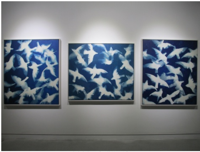
张大力作品《深蓝的天空》