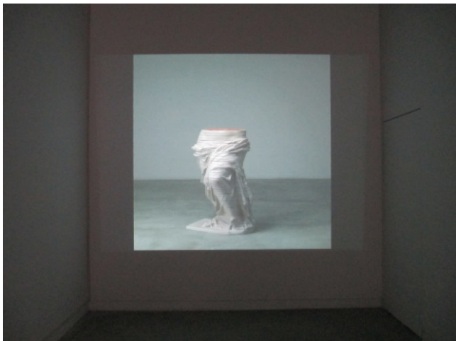
曹晖作品《不要忘记我》