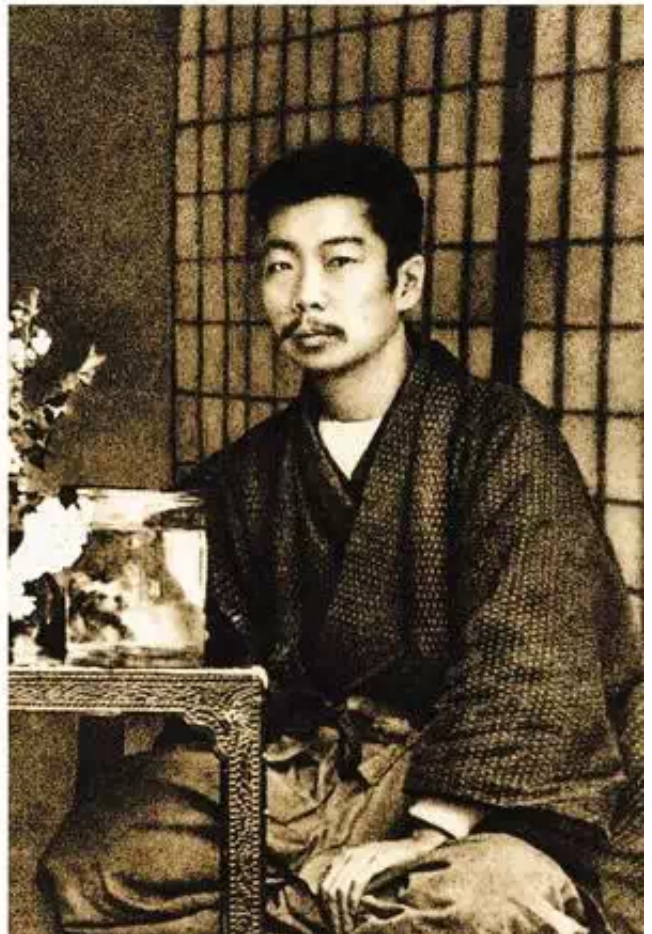
▲ 1910年，鲁迅在东京。图片编辑从杂乱的照片修裁出鲁迅的一张沉稳的肖像。上图和左下图：修改前。右下图：修改后。