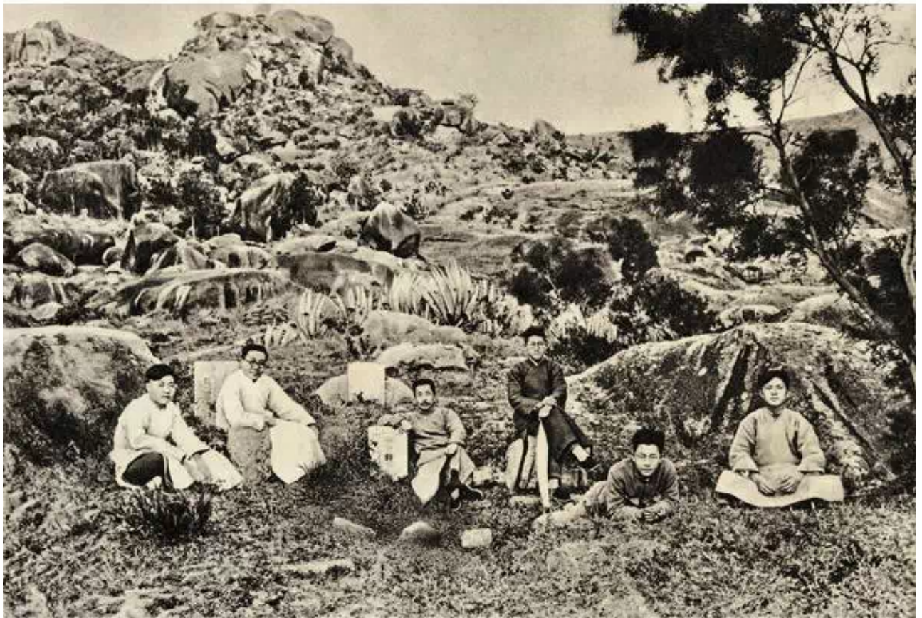
▲ 1927年，鲁迅在厦门与“泱泱社”青年的合影，前排的林语堂被修掉。上图：修改前。下图：修改后。