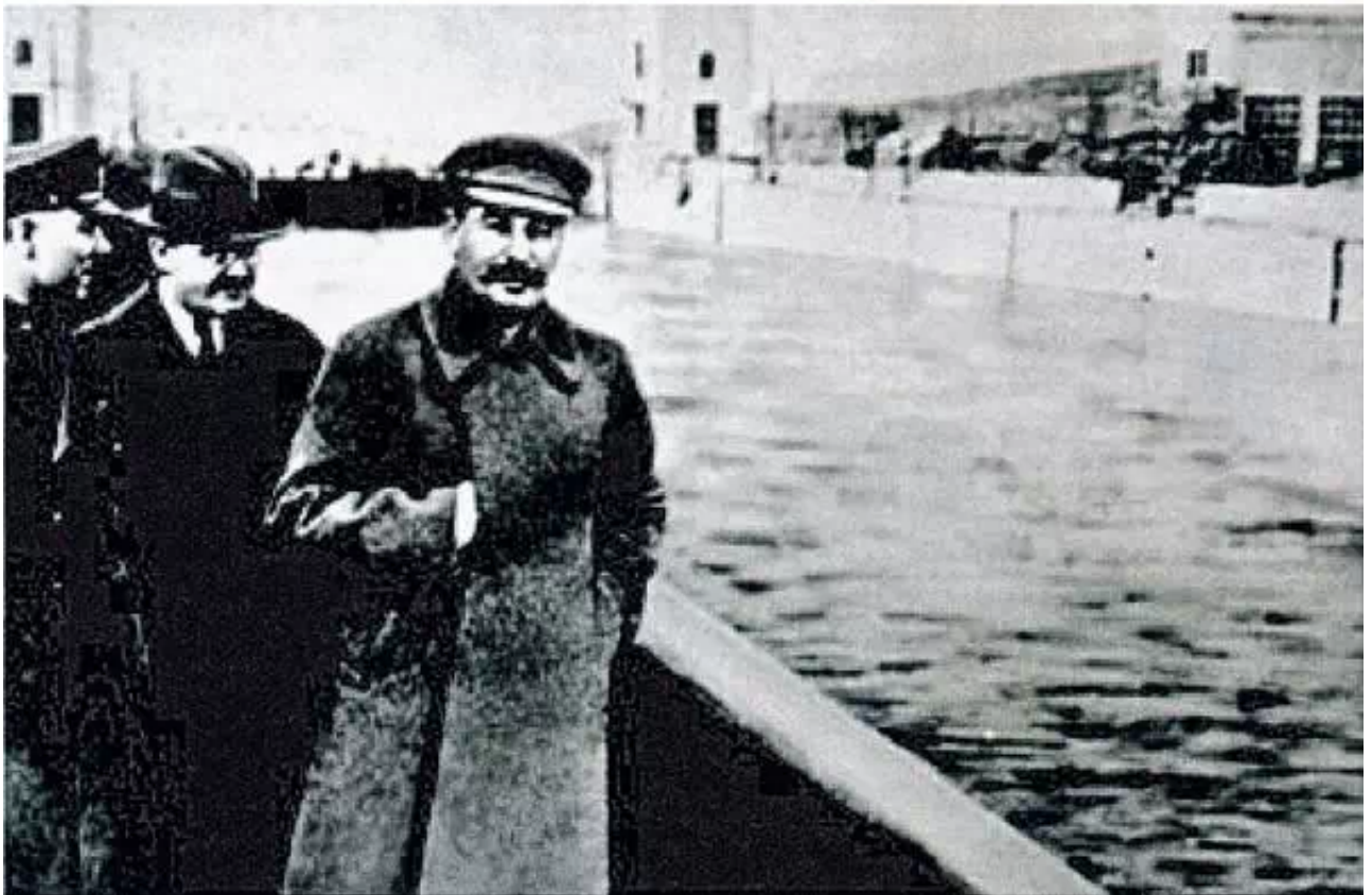
▲ 秘密警察首脑、大清洗计划的执行者叶诺夫，失宠后，就从照片里消失了。上图：修改前。下图：修改后。