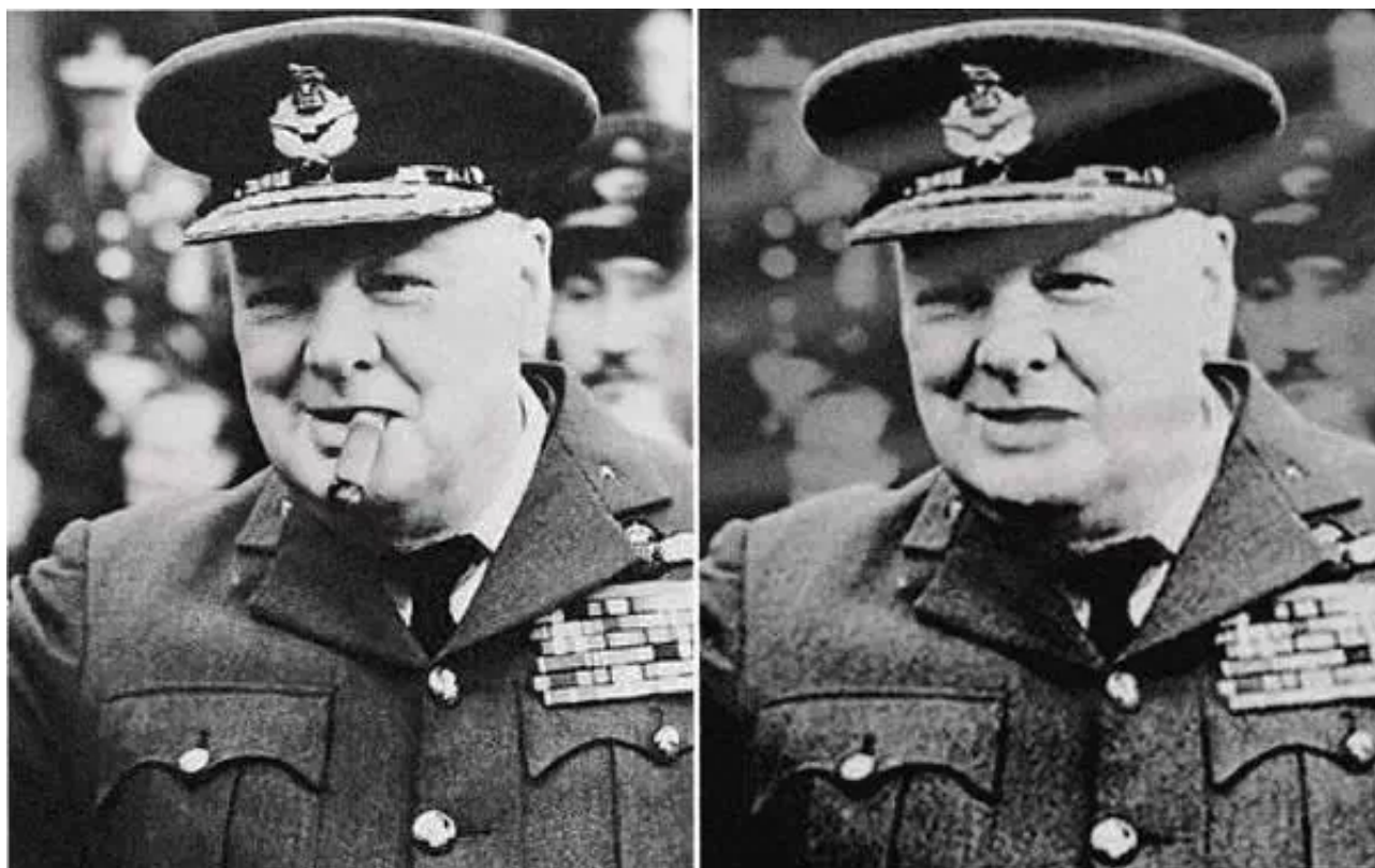
▲ 1948年，丘吉尔吸雪茄烟，2010年，丘吉尔的烟不见了。左图：修改前。右图：修改后。