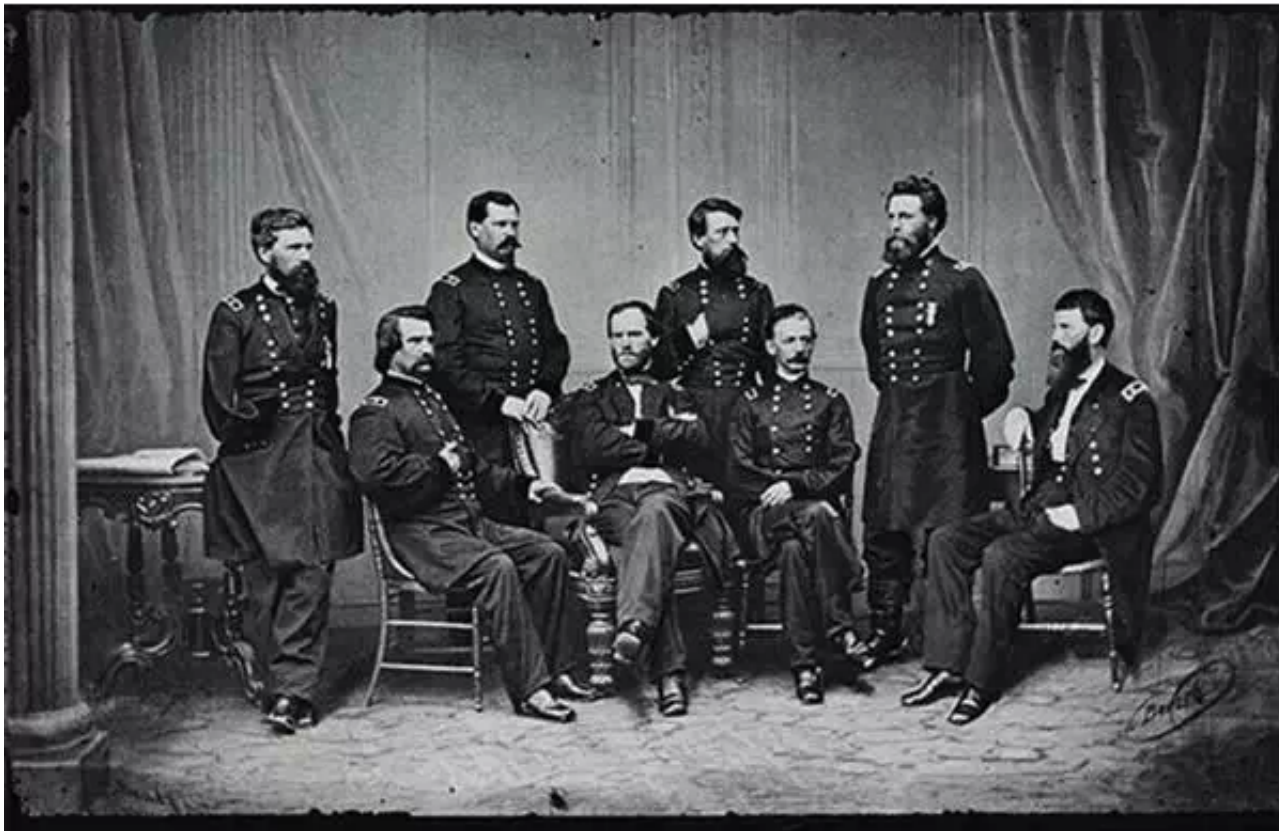
▲ 美国内战的将军们。摄影师马修·玻拉蒂添加了一个原片中不存在的人物。上图：修改前。下图：修改后。