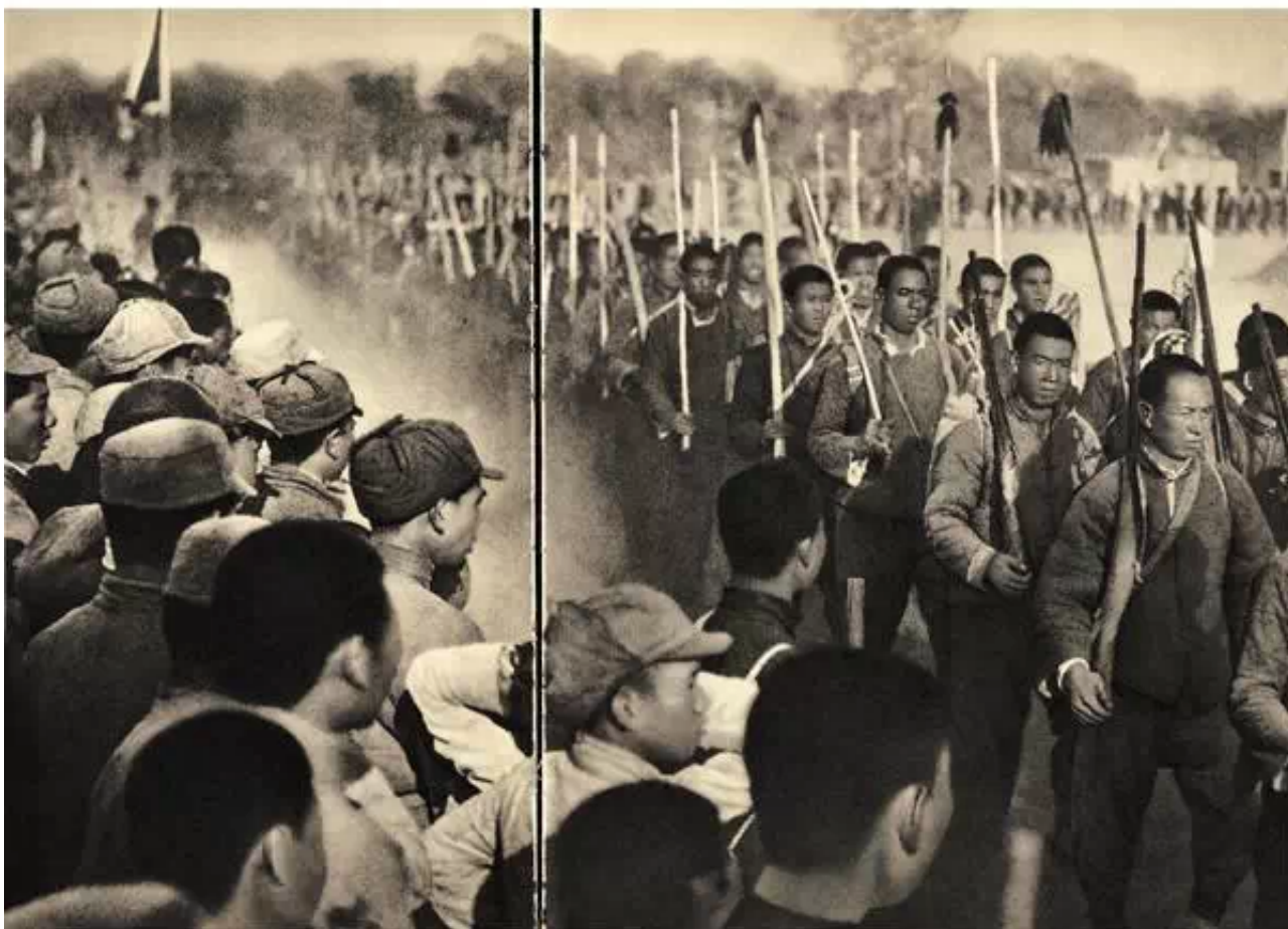
▲ 《人民战争的力量源泉》。左下角面向镜头的人脸被裁剪或重绘成侧面，群众都变得专注认真。上图：修改前。下图：