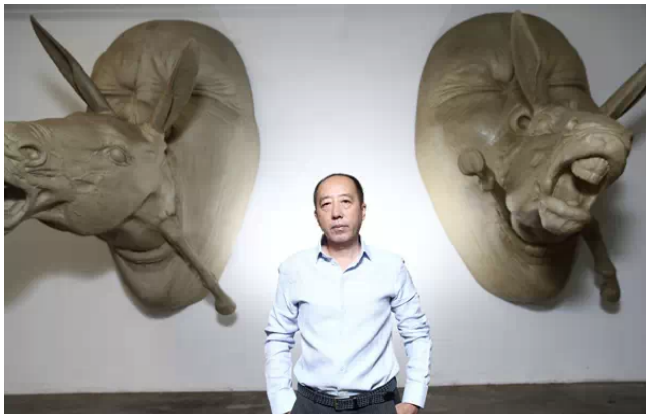
张大力，视觉艺术家，1963年生，现居北京。