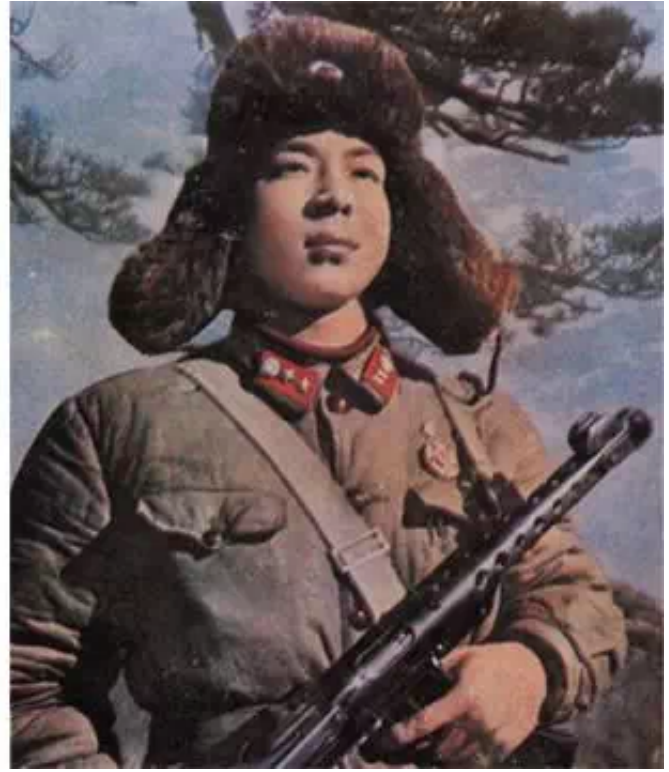
▲ 雷锋肖像照。他的身后长出了一棵挺拔的青松。左图：修改前。右图：修改后。