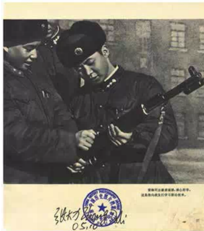
雷锋学习射击 摄影