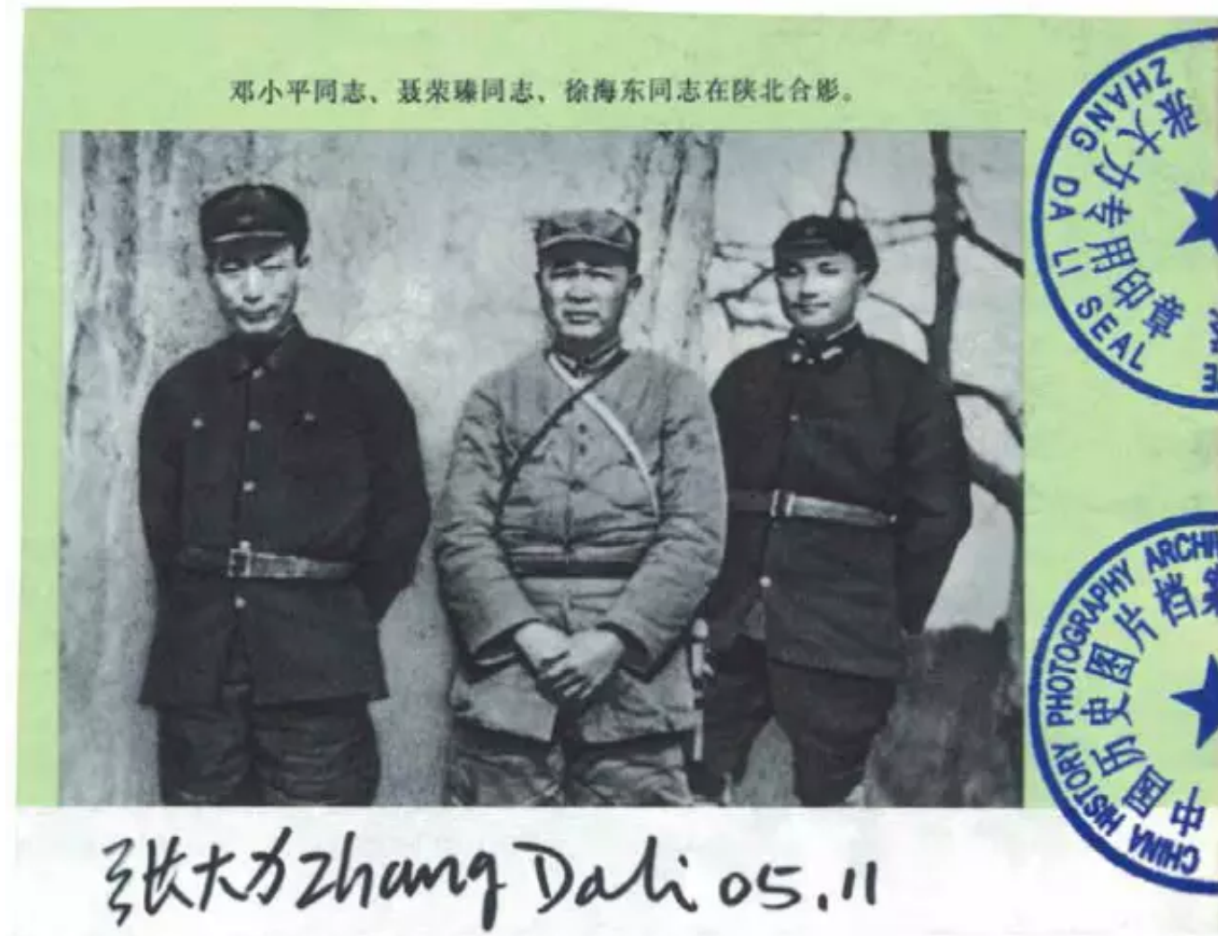
1936年2月邓小平、聂荣臻、徐海东同志等合影 摄影