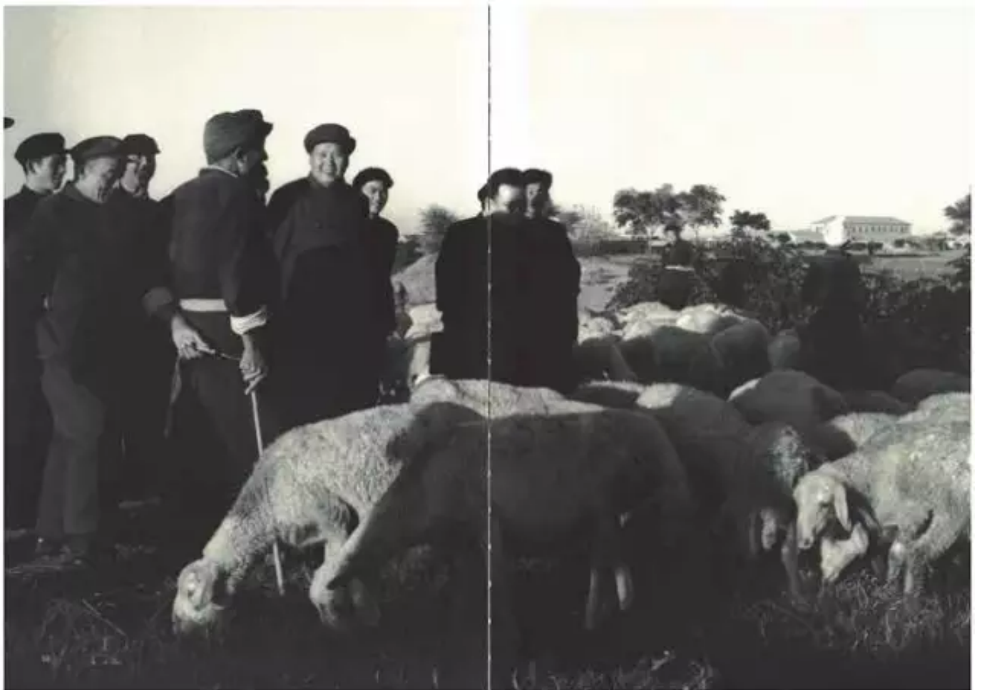
1956年毛主席与牧羊人 摄影