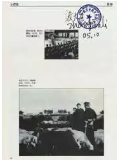
1956年毛主席与牧羊人 摄影