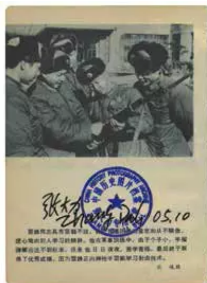
雷锋学习射击 摄影