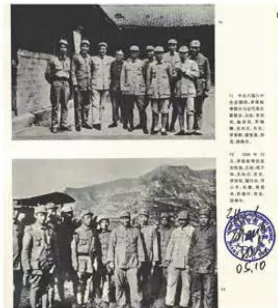
1938年10月延安机场 摄影