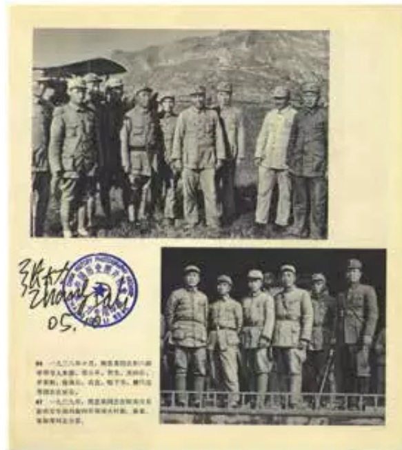
1938年10月延安机场 摄影