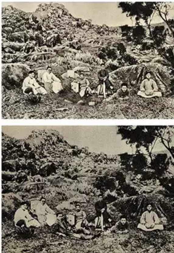
▲ 张大力 1927年1月2日，鲁迅在厦门南普陀与“决决社”青年合影