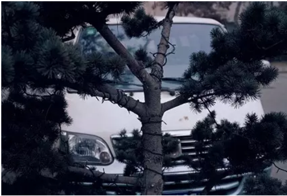
▲ 封岩 松树白车