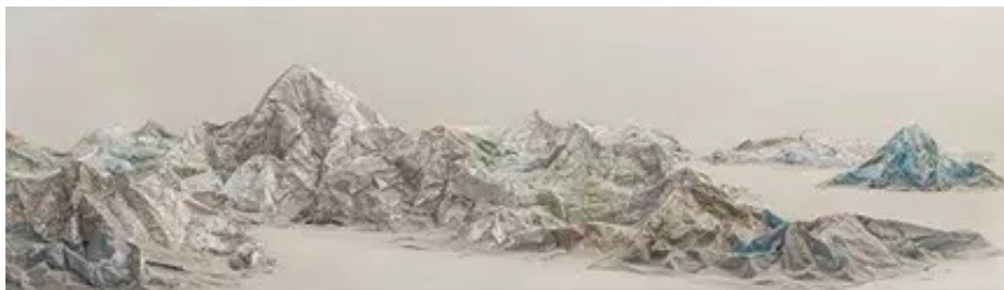
▲ 计洲 地图