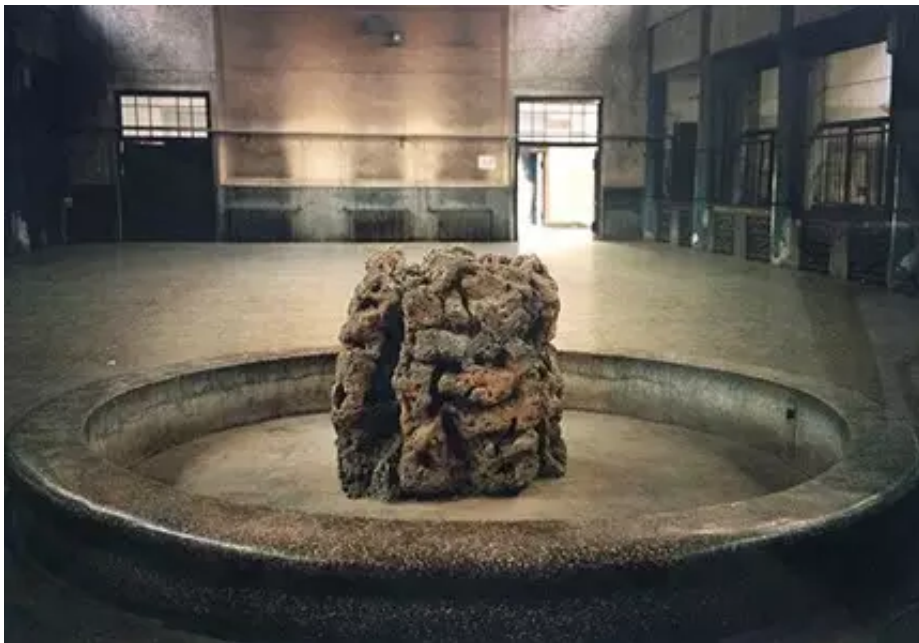
▲ 封岩 动物园池塘