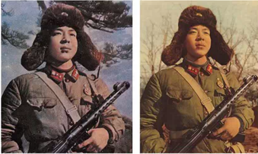
▲ 张大力 伟大的共产主义战士雷锋