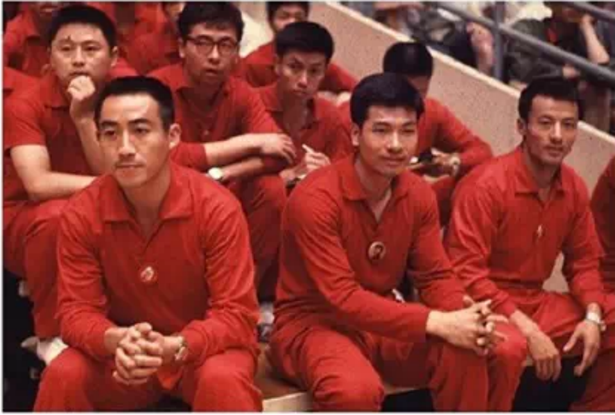
▲ 翁乃强 国手