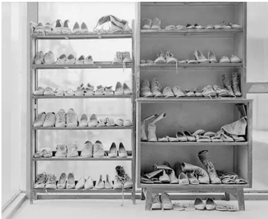
▲ 计洲 灰尘之二