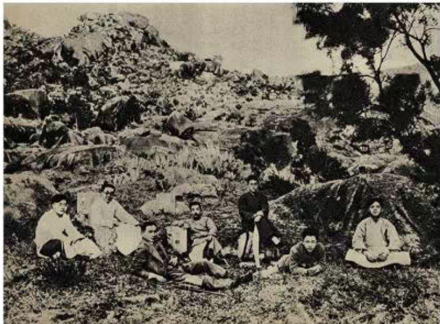
▲张大力 1927年1月2日，鲁迅在厦门南普陀与“决决社”青年合影