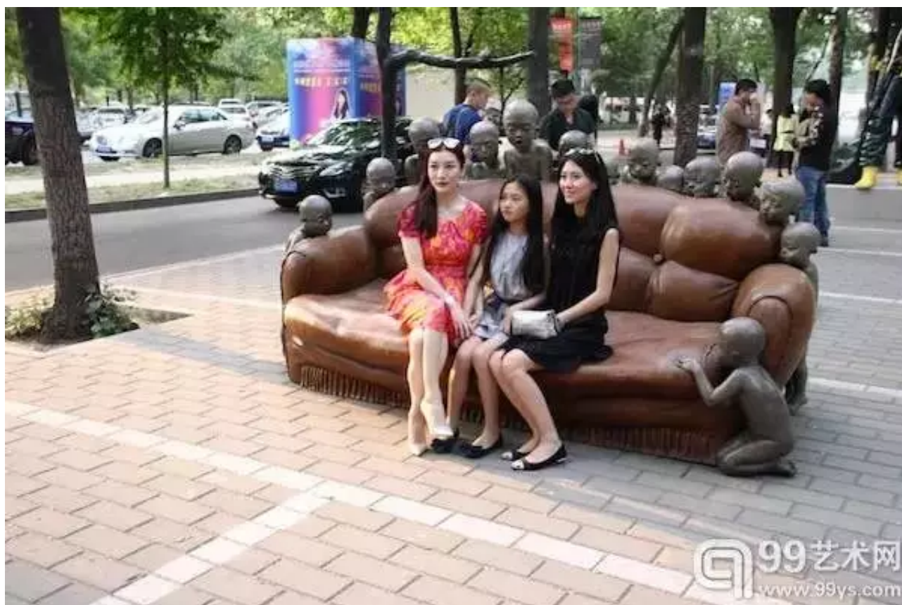
颜石林 《怎么了？空沙发》