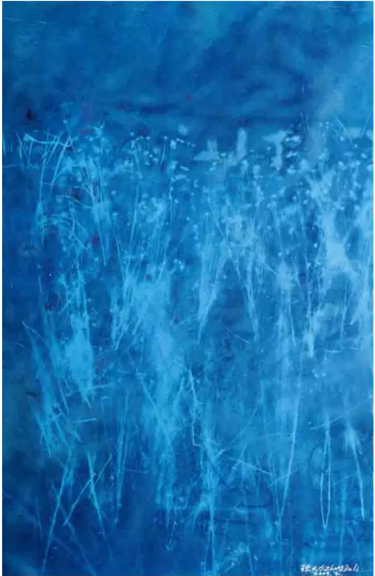
《荒野》 Wild Grass