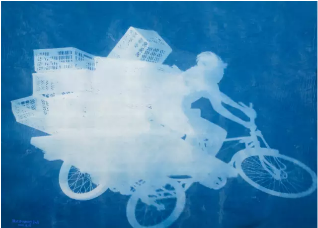
《车夫》 Delivery Bicycles

塔，塔群高者数丈，小者径尺，高低错落，布局规整，古塔历经沧桑，年代久远，却保存完好。据《昌平外志》记载，辽寿昌年间（公元1095—1101年）满公禅师便在此山创建了宝岩寺，其后通理、通圆、寂照三位禅师先后在此说法修行。我用大尺寸的棉布记录下辽塔在上午阳光下的影子，这些影子证明了古塔在有限世界存在的历史和过程，其实它们的影子也是这个宇宙里不朽的灵魂，它让我想起存放在都灵的耶稣裹尸布。难道这些古塔不也是那些圆寂大师的裹尸布吗？日复一日存在近千年的古塔影子跃然到画布上，这真是一个神奇的过程。物影相随，如影随形，心影即世影。到目前为止，还没有艺术家使用蓝晒法做这么大尺寸的作品，因为无论使用化学药品还是操作难度上都是一个巨大的挑战。