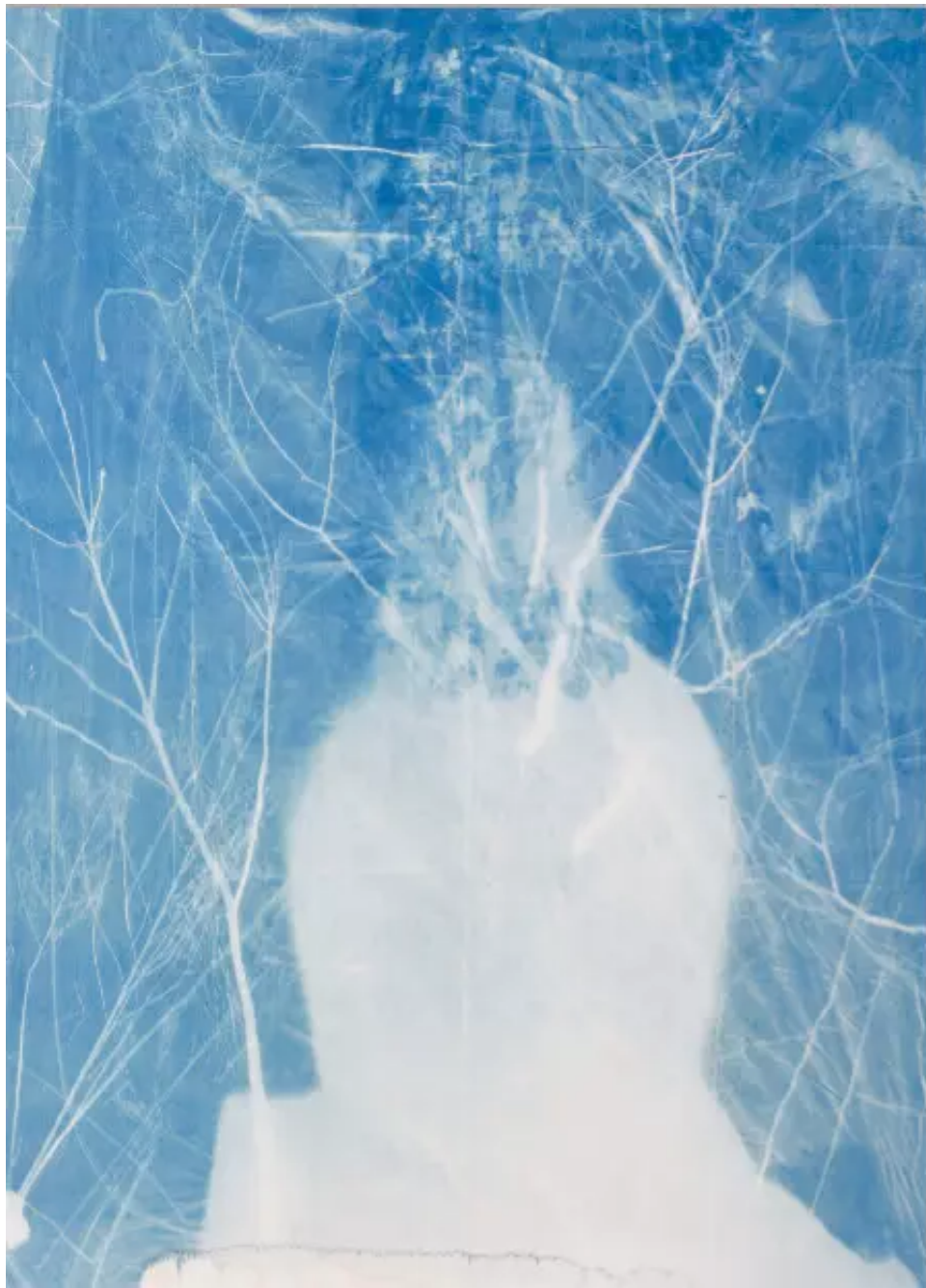
《3号辽塔》 Pagoda No.3