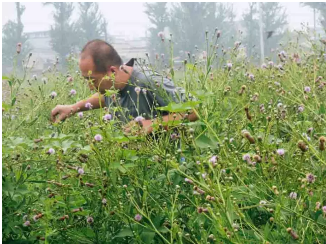
艺术家在黑桥工作室附近荒地

将此地碾平，黑桥村和我的工作室也将不复存在，它们在地图上可能仅仅留下一个莫名其妙的