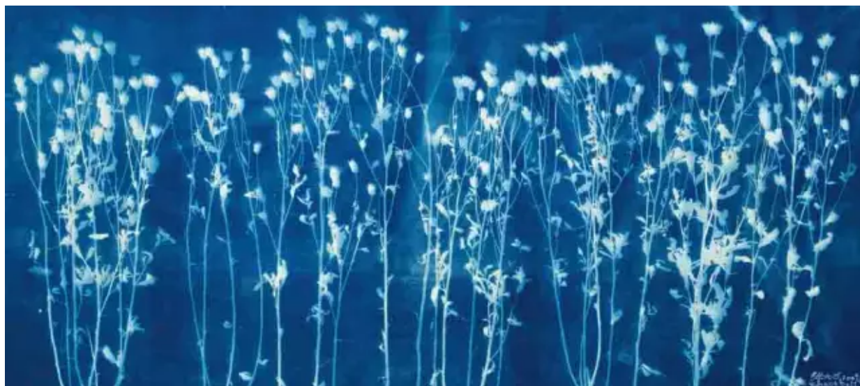
《荒野之灵》 Soul of the Wild Grass

在北京这个巨大的、不友好的城市里，人们生活在各自的洞穴中。出行时汽车堵在毫无规则的钢铁洪流里，我们得小心翼翼的穿越马路，自行车、行人、电动车挤成一团。盲道突然被水泥电线杆阻断，水井盖侧翻。城市面貌千篇一律毫无美感，粗糙的高架桥和瓷砖建筑外立面如同废墟，只有在黑夜里被霓虹灯包裹着才显示出虚假的盛世梦幻。人们几乎没有机会面对自然景观，只能看到路边政府部门以行政命令的方式，种植的整齐的人工花草和单调的树木。我们忘记了自然，忘记了人类和自然的关系，忘记了我们中国人曾经和自然建立起的完美生活，如今已没有几个人能够叫上五种以上野草的名字。珍贵的古迹被愚蠢、贪婪、短视的管理者所毁灭，河流污染，我们离传统越来越远，被卷进了一个巨大的莫名黑洞。2009年春天，我经过那块荒地时，突然想到在这个快速发展的现代都市里，环境由谁来做主？谁才是城市的真正主人？我们的思想永远被改造？命运永远被别人安排？未来永远是永远？这些正确的答案被重复了无数遍，但现实依然在给你看他的另一个面孔，沉重、无奈、失望就在身边，不管你喜不喜欢，你都无法逃离这屎尿之间。但荒野的生命比人类更具有尊严和美感，它们是如此旺盛和茁壮，它们不会低头生活，只要有水和阳光你就无法压制它的成长。人不如草。因为我们失去了文明的土壤，也没有了精神的阳光。我们像瞎子一样狂叫着，跌跌撞撞的向乌有之乡奔跑。在我们这个世界里有些人企图用粗暴的权力控制我们对世界的认识和理解，无视和抹煞这个世界的多样性和价值观，我们不得不生活在单一的价值体系之中，这么活着，其意义简直为零，活着就是为了等死，生命中没有神圣，没有虔诚，没有对无限世界的向往。生活也没有任何质量，只凭本能如动物一般的存在于世界之中，人生的旅程只有最基本的身体意义上的存在，并被动地承受着一切遭遇。当你面对空气时，也许你并不感觉到它的存在和价值，但没有空气的世界，我们都将窒息而死，这个道理并不被大多数人察觉，只有行将大限者才知其深刻的意义。我们视而不见的某些“存在”正是支撑你生命的真正要素和理由。