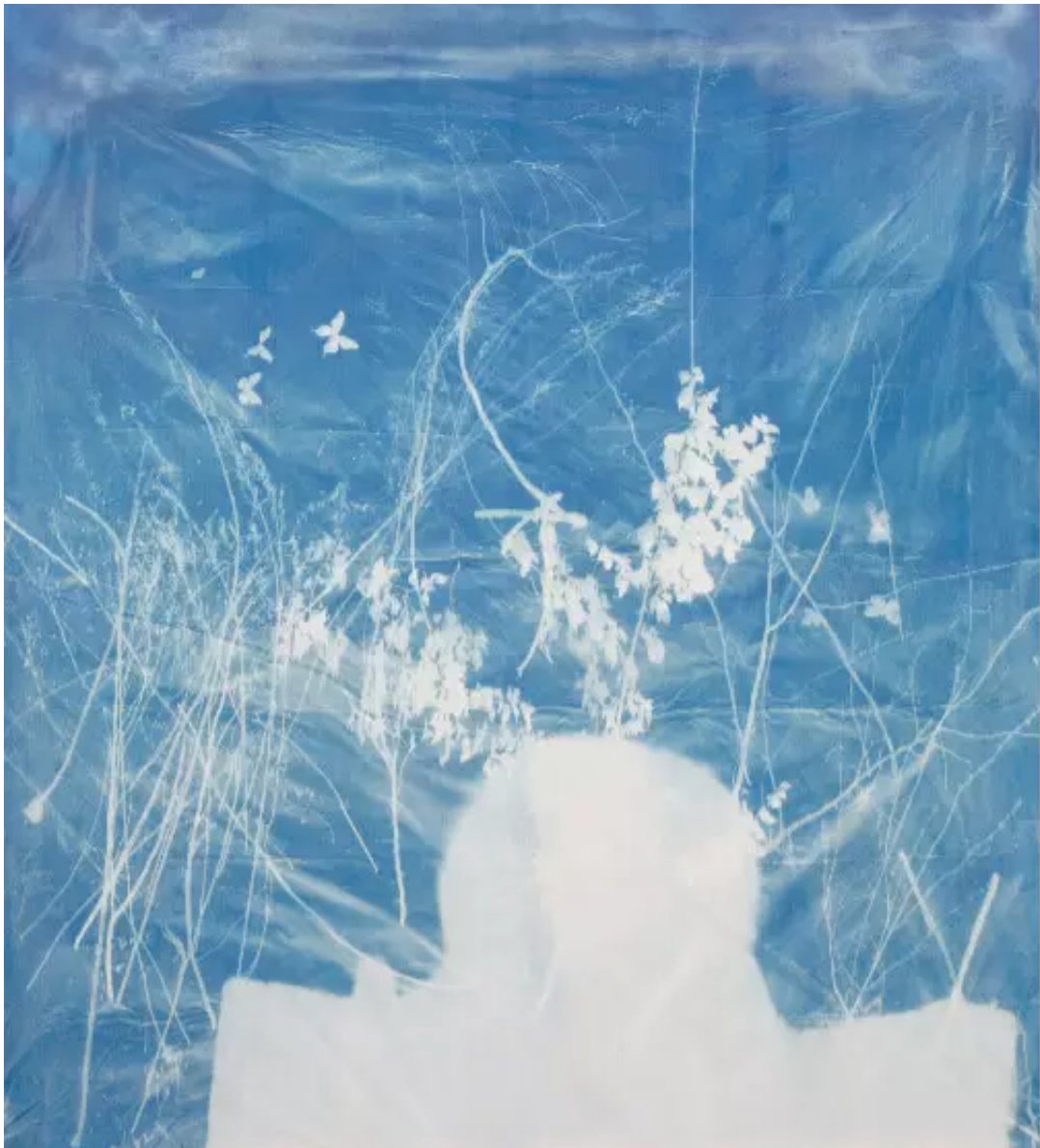
《1号辽塔》 Pagoda No. 1