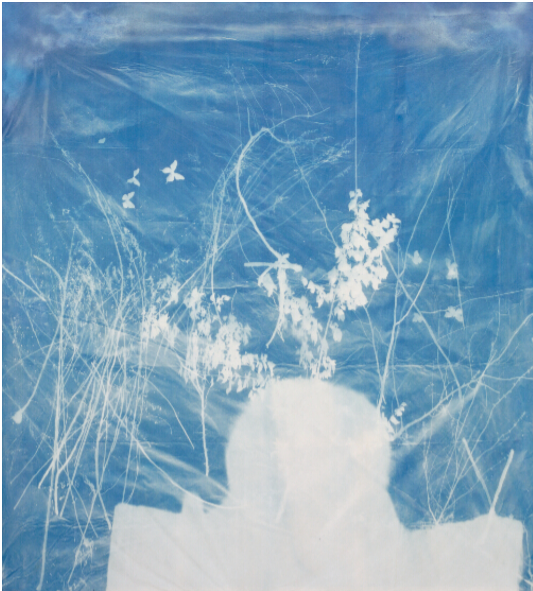
《1号辽塔》纯棉布蓝晒