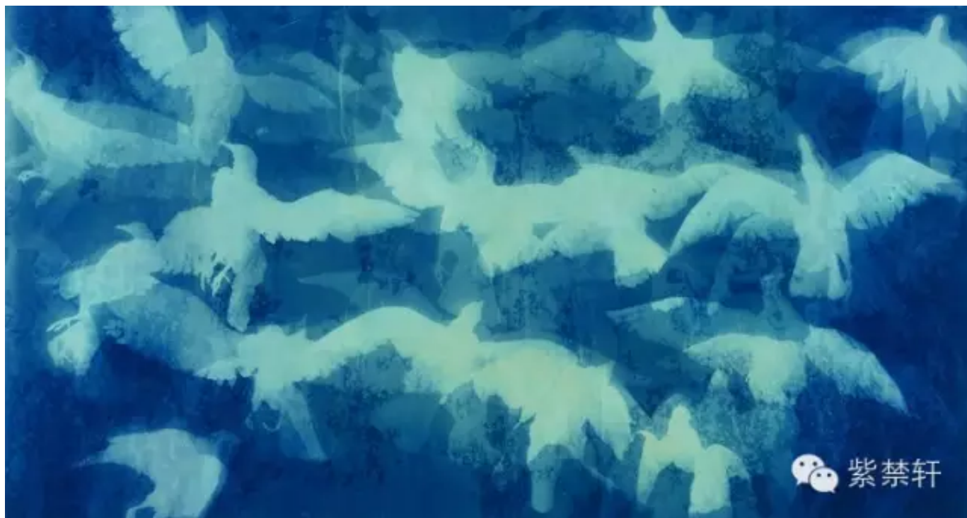
《飞翔的鸽子》 宣纸蓝晒 95X180cm 2013