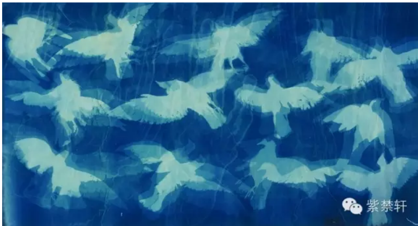
《飞翔的鸽子》 宣纸蓝晒 95X180cm 2013

张大力说：“我开始有点儿唯心了，当唯物做到极致以后必然就有点儿唯心了。当一个赤裸裸的尸体展示在你面前的时候，我已经无力解读它了。一个艺术家终身追求一个东西像一个梦似的，所以我后来的作品开始有唯心的倾向，只有唯心才能满足我，才能让我有梦想，因为真正的唯物已经到头了。我所关心的问题事实上在我这儿已经无力解决了。所以我开始关心人想什么，因为人想什么，思考什么更重要。“蓝晒”只不过是唯心的开始，《广场》也算是一个。”