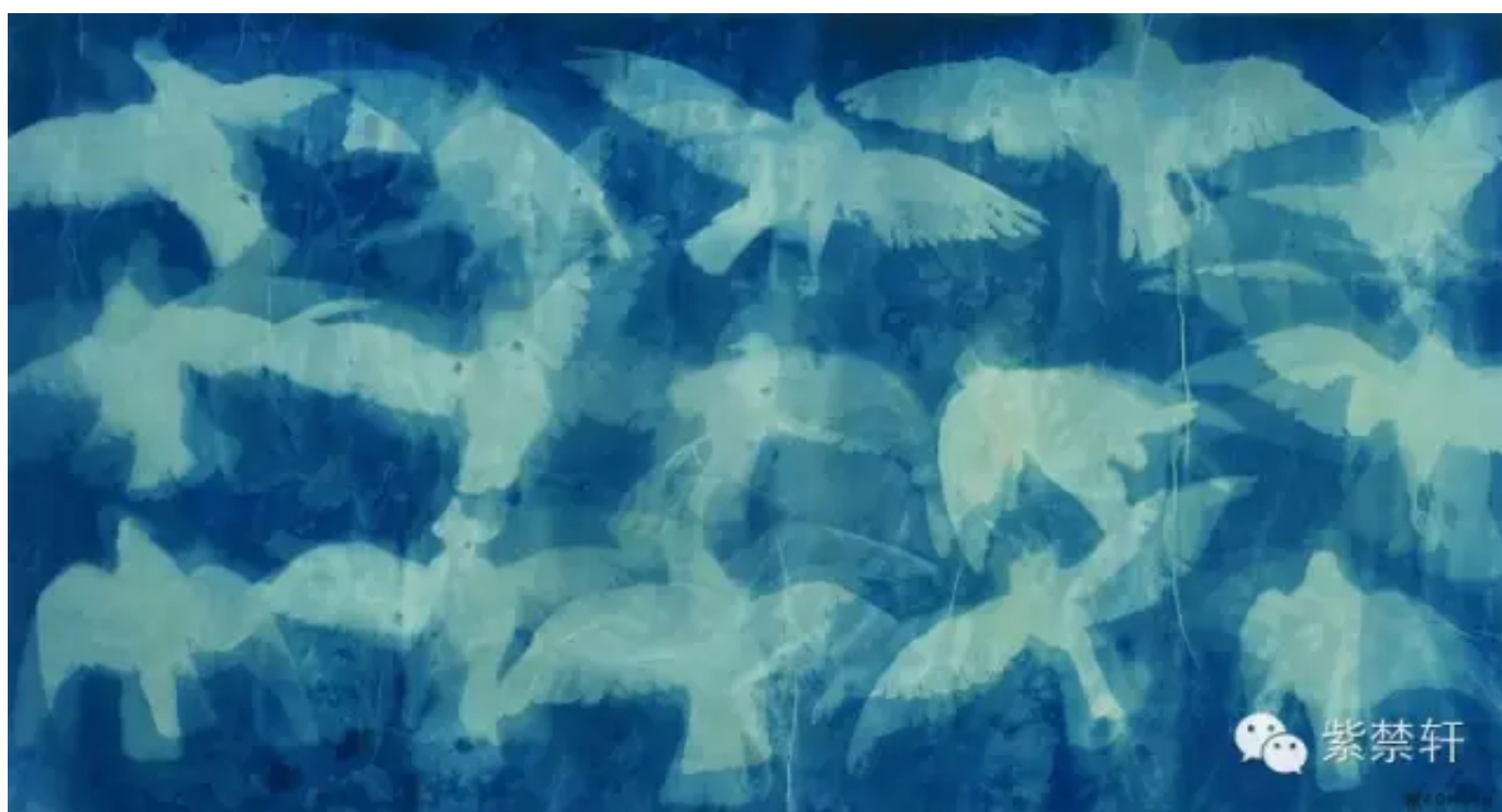
《飞翔的鸽子》 宣纸蓝晒 95X180cm 2013