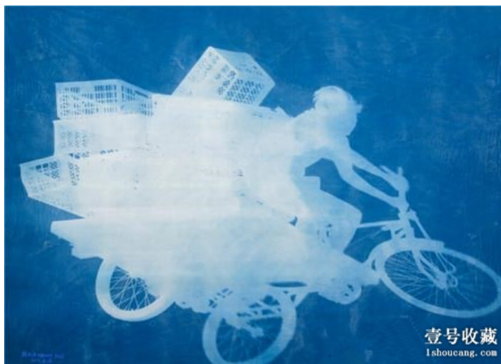
张大力《车夫》 纯棉布蓝晒260cmX360cm 2011年