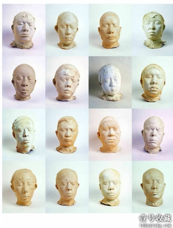
《一百个中国人》拼接图