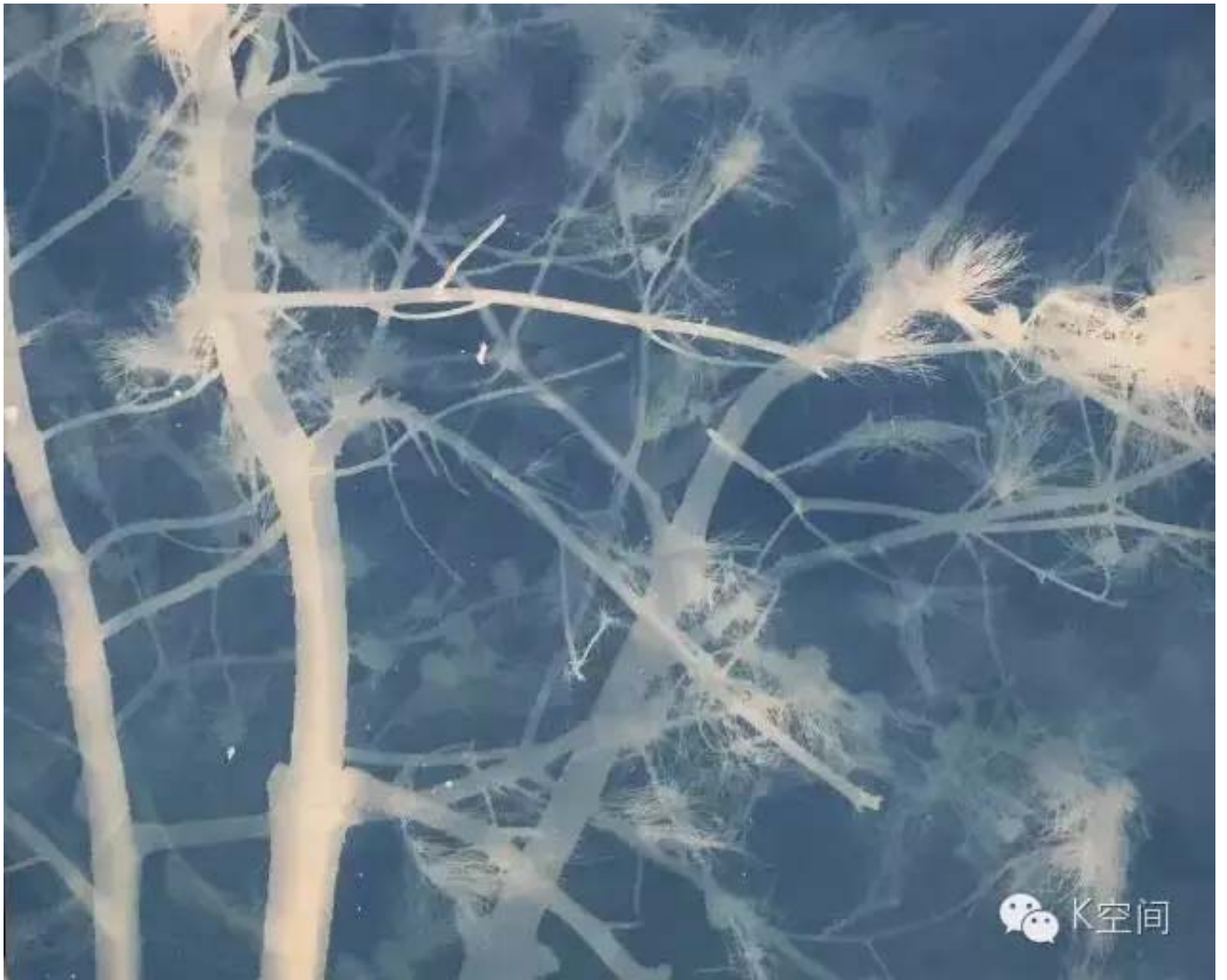
松树 亚麻布蓝晒 2016