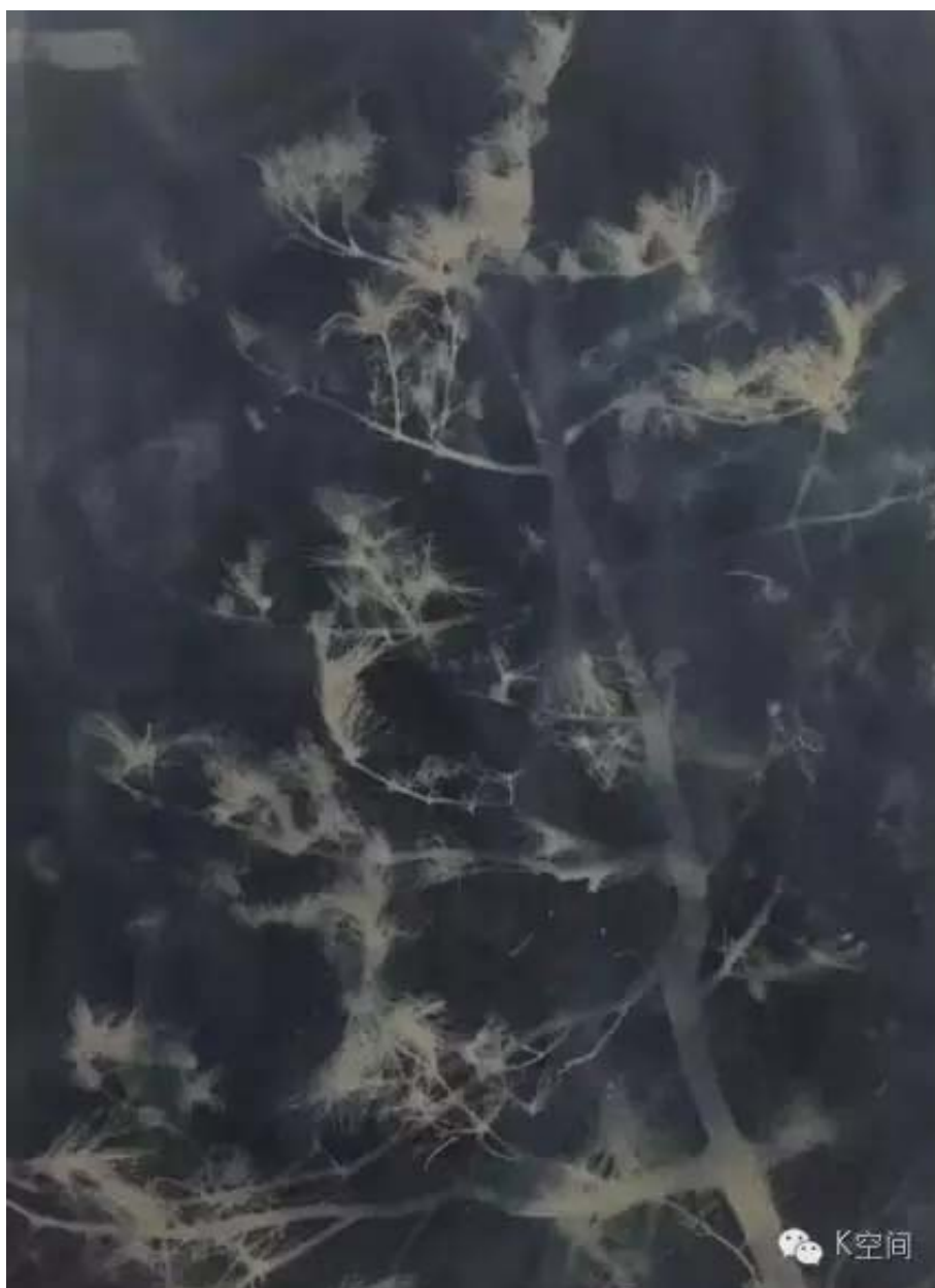
松树 亚麻布蓝晒 2016