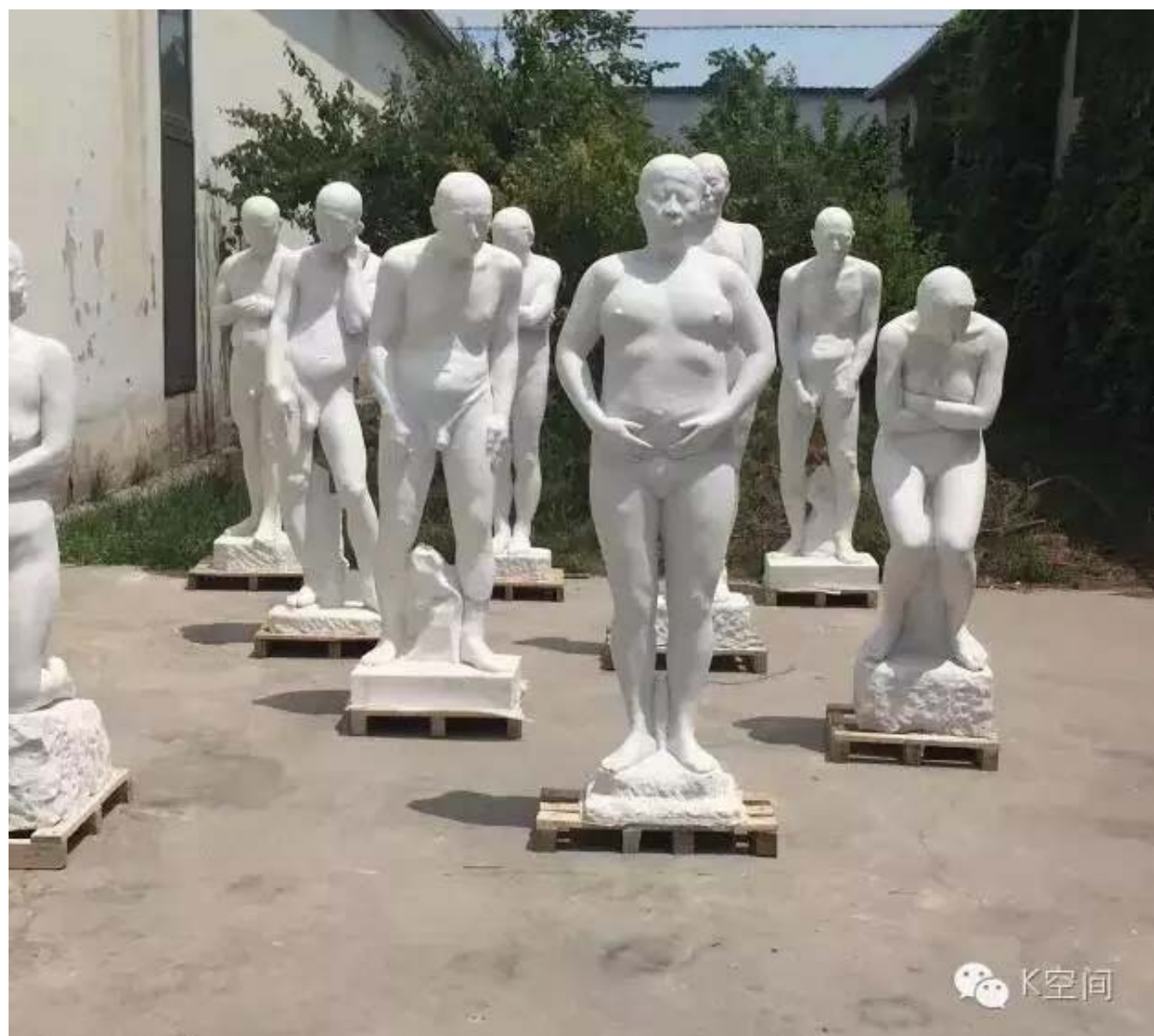
雕塑 汉白玉 2015