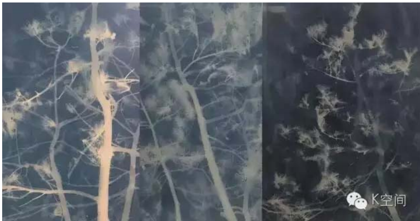
松树 亚麻布蓝晒 2016