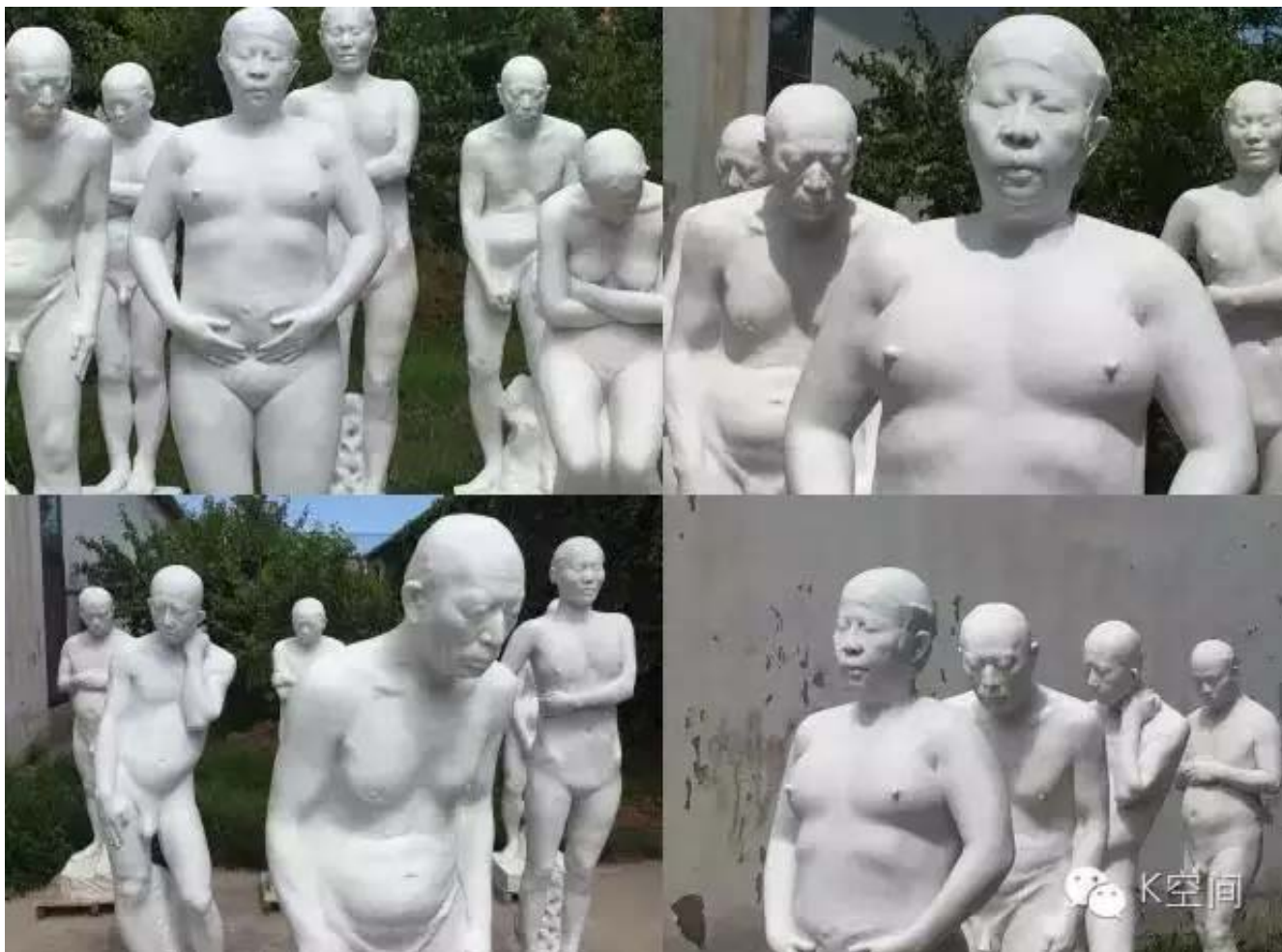
雕塑 汉白玉 2015