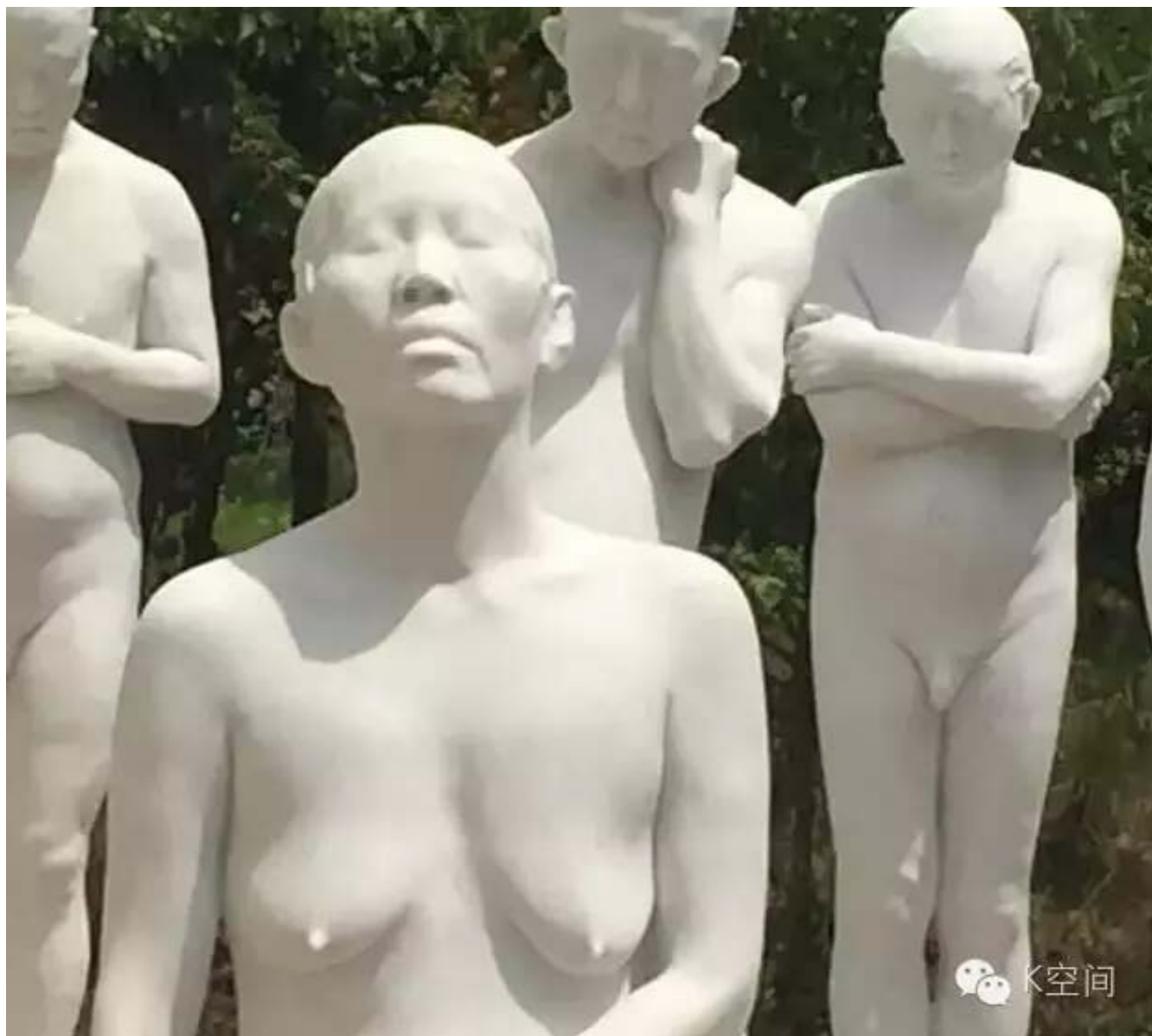
雕塑 汉白玉 2015