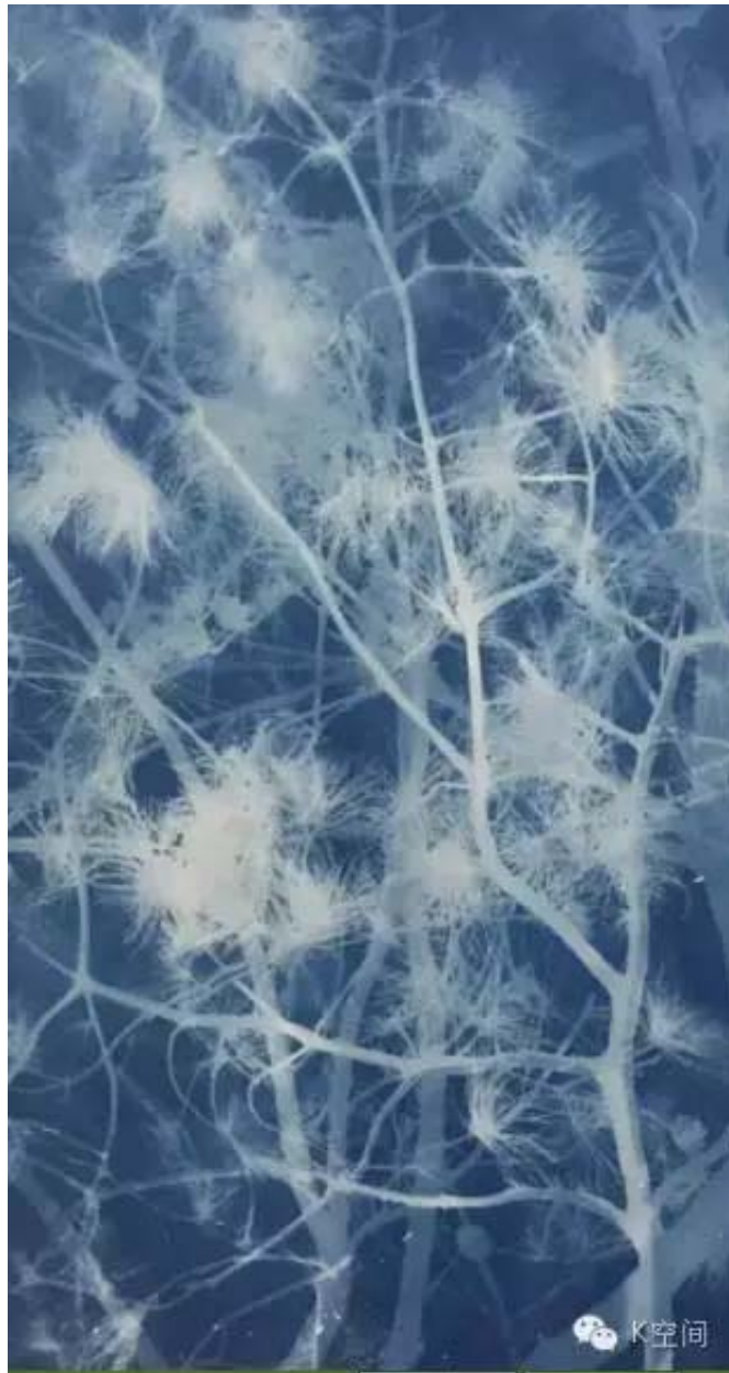
松树 亚麻布蓝晒 2016