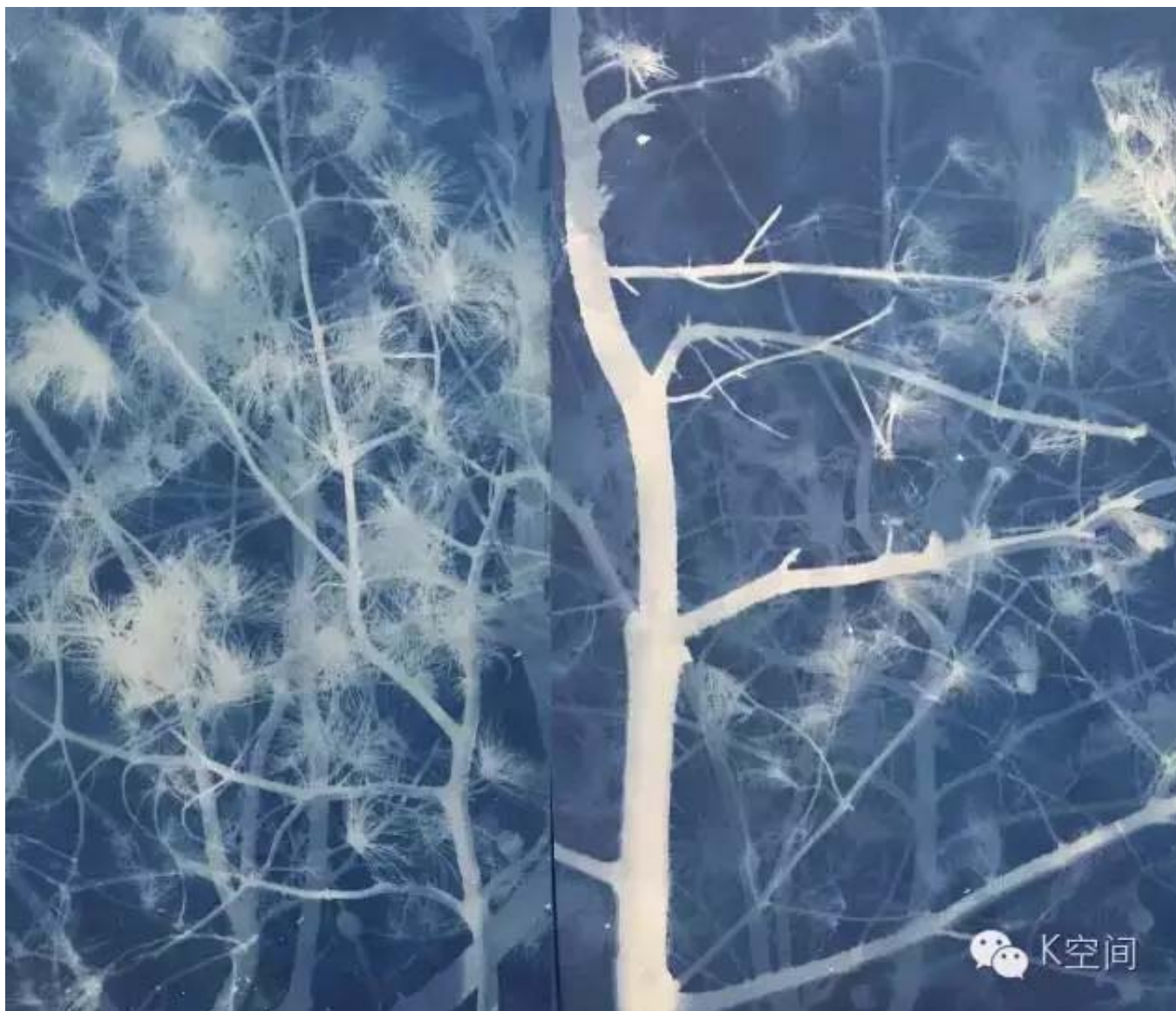
松树 亚麻布蓝晒 2016