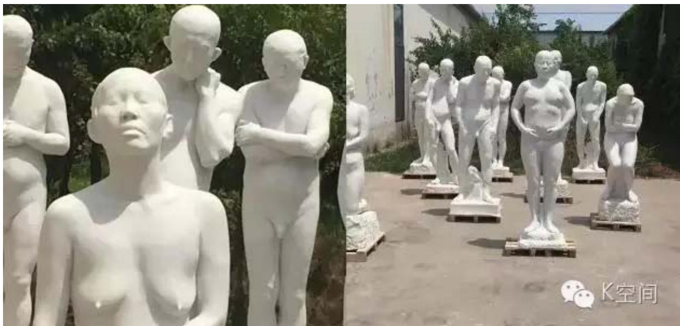
雕塑 汉白玉 2015