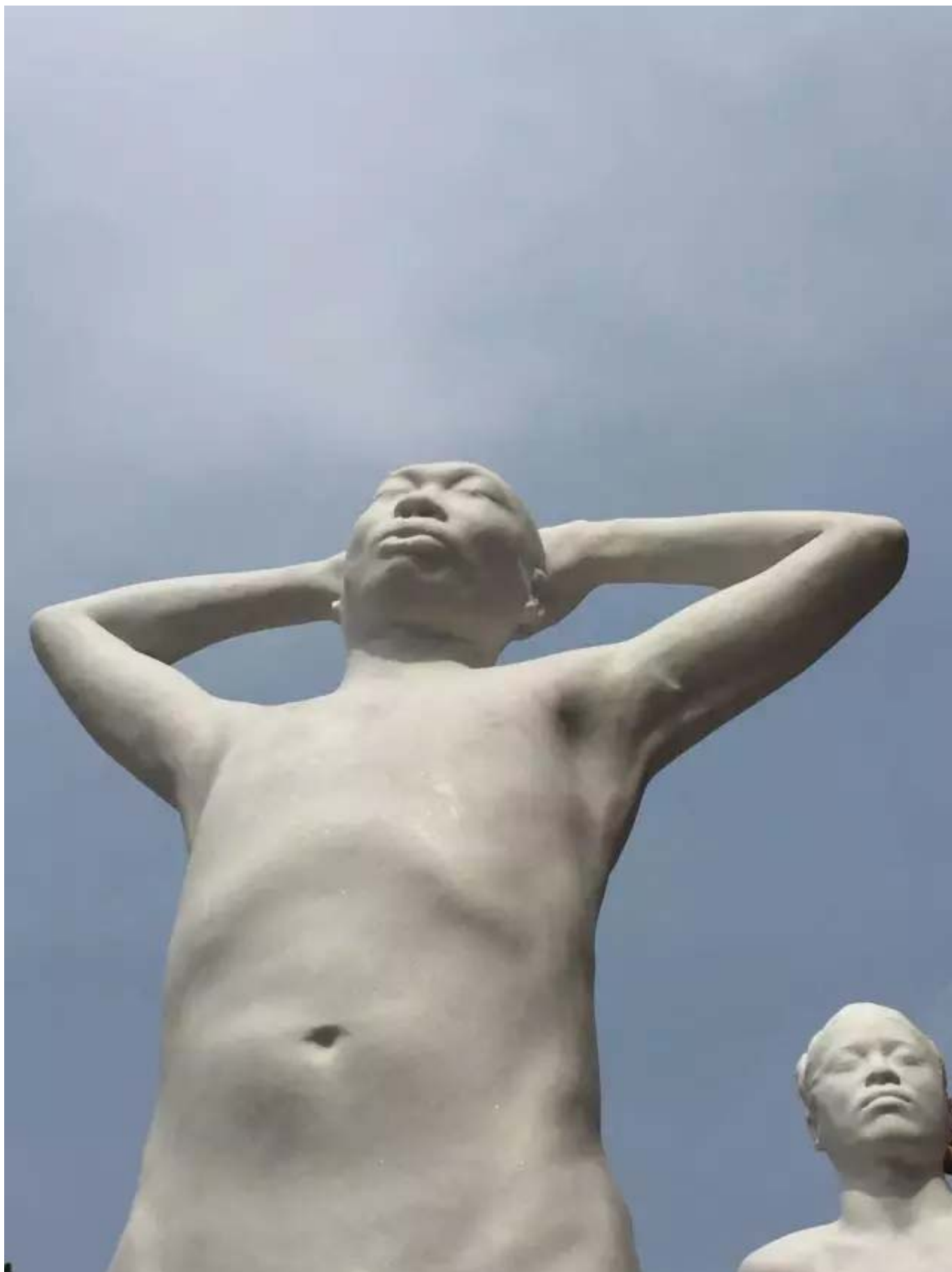
雕塑 sculpture 汉白玉 white marble 2015

Q：策展人是近20多年来的新生事物，您作为策展人，与艺术家之间以及和当下社会之间，往更深层次与我们中国文化之间的关联是什么？