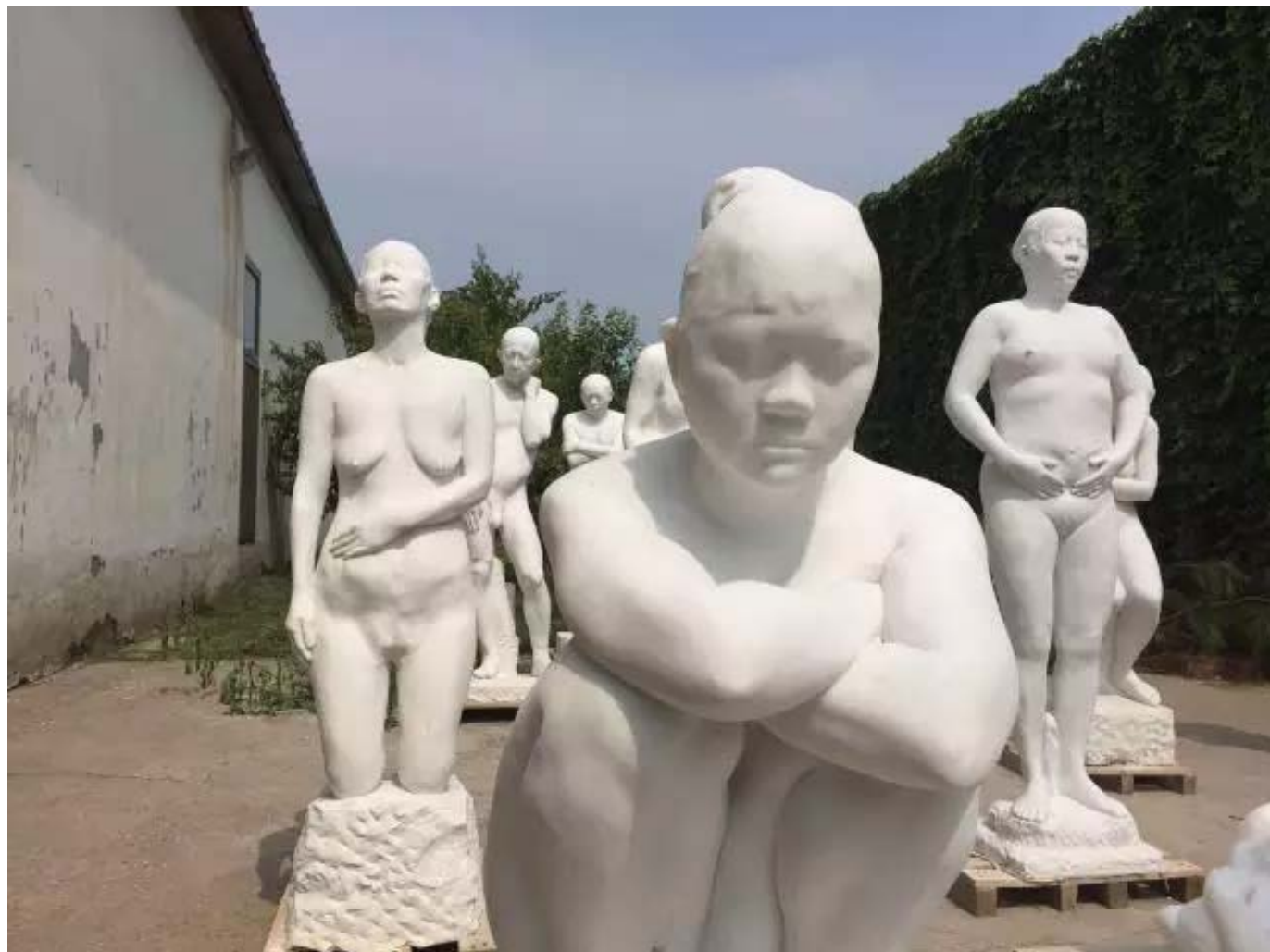
雕塑 sculpture 汉白玉 white marble 2015

A：在当代艺术中，恒久与无常这两个概念可以在各种不同层次上理解。在最高的层次上它们牵涉到哲学和美学的问题，关于艺术和艺术价值是否有永恒性，抑或当代艺术的主要任务是对瞬息万变的“当下”做出反映。在最基础的层面上它们和艺术家使用的材料、媒介以及展示作品的地点和方式有关，由此也牵涉到当代艺术作品的收藏和保护等棘手的问题。