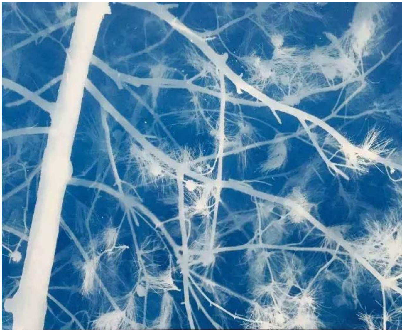
松树 Pine 亚麻布蓝晒 Cyanotype on canvas 180X200cm 2016