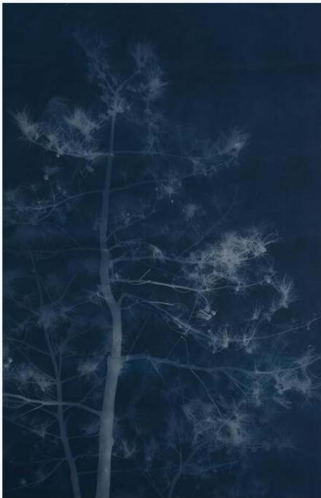
松树 Pine 亚麻布蓝晒 Cyanotype on canvas