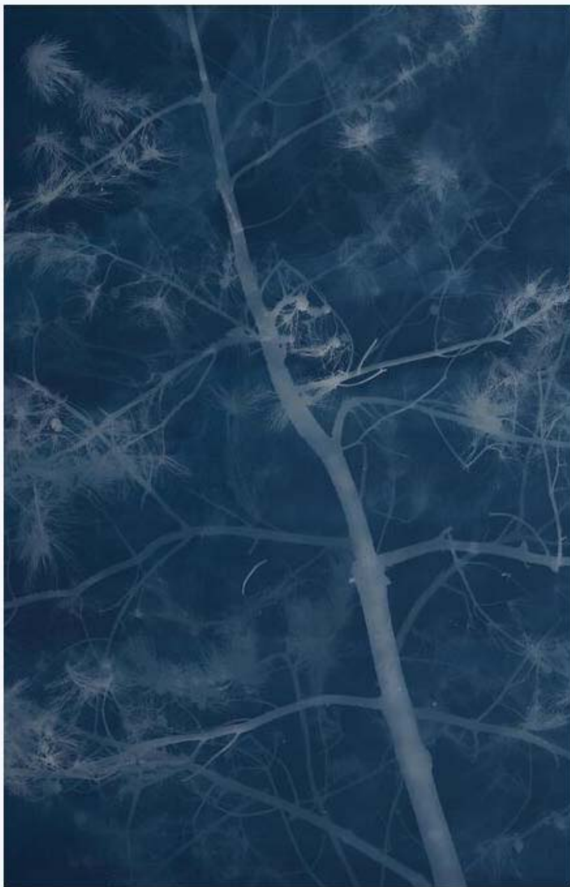
松树 Pine 亚麻布蓝晒 Cyanotype on canvas