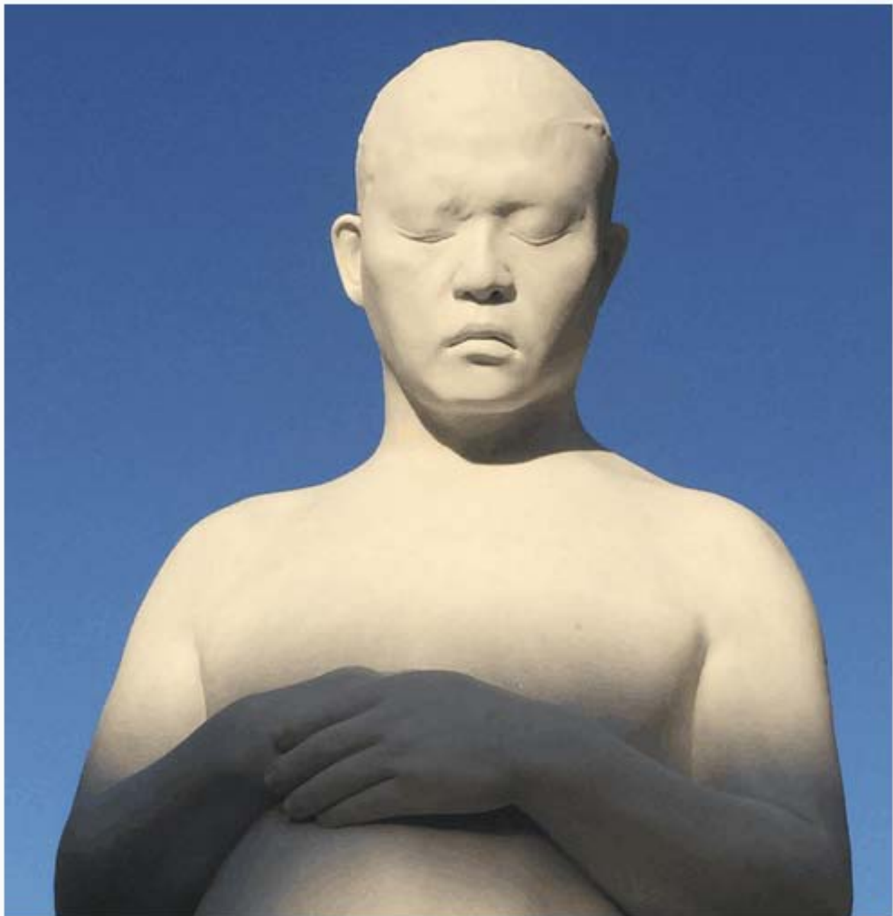
雕塑sculpture 汉白玉 white marble 2015