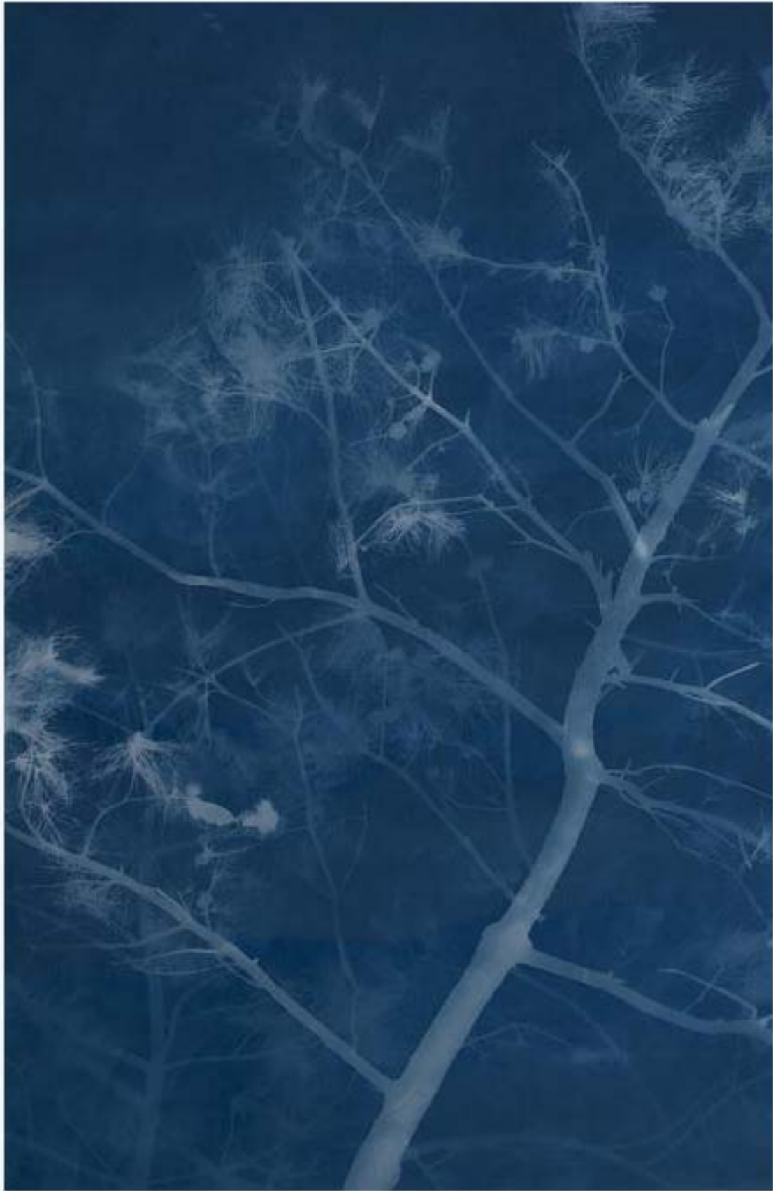
松树 Pine 亚麻布蓝晒 Cyanotype on canvas