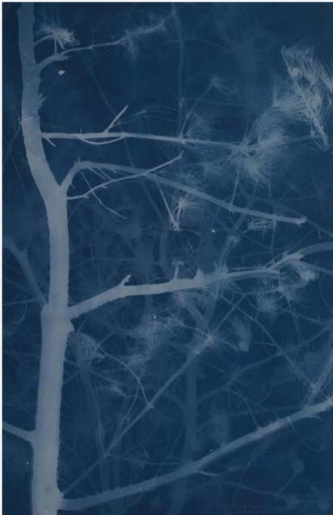
松树 Pine 亚麻布蓝晒 Cyanotype on canvas