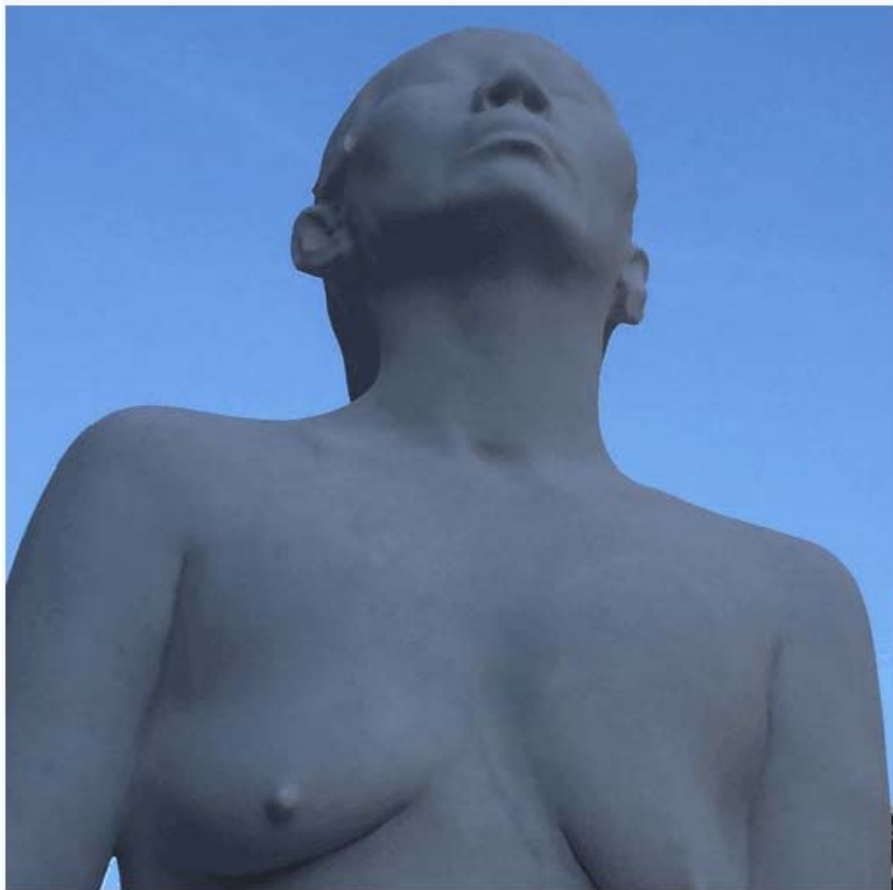
雕塑sculpture 汉白玉 white marble 2015