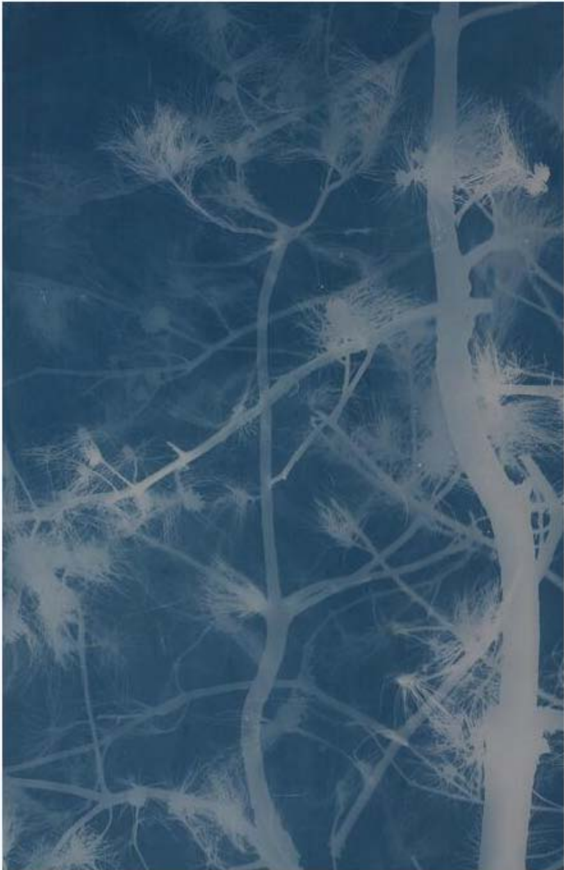
松树 Pine 亚麻布蓝晒 Cyanotype on canvas