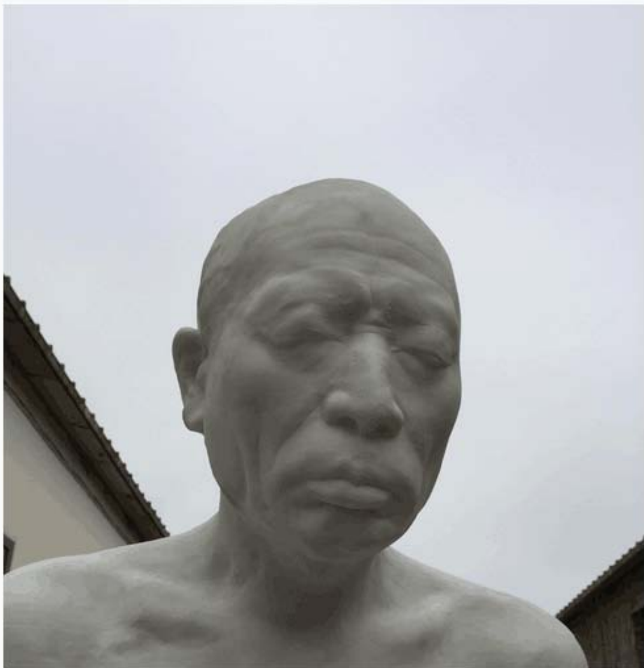
雕塑sculpture 汉白玉 white marble 2015