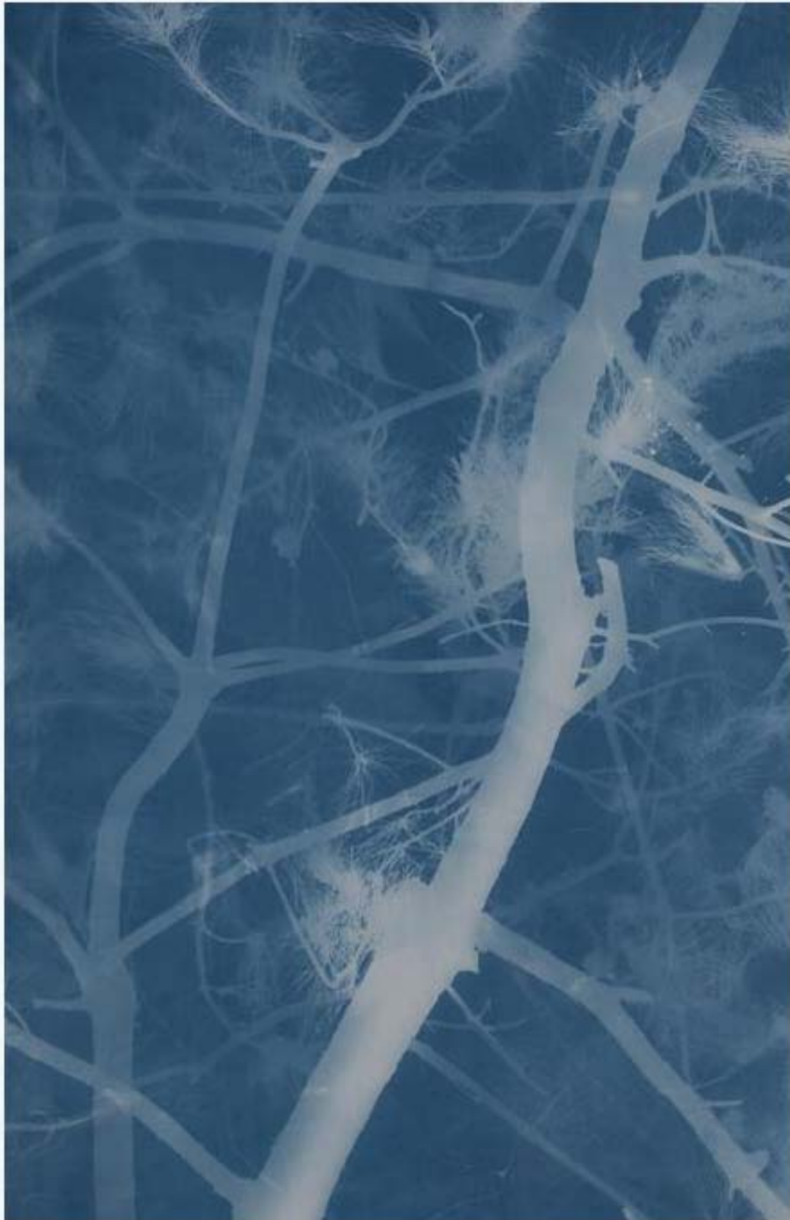
松树 Pine 亚麻布蓝晒 Cyanotype on canvas