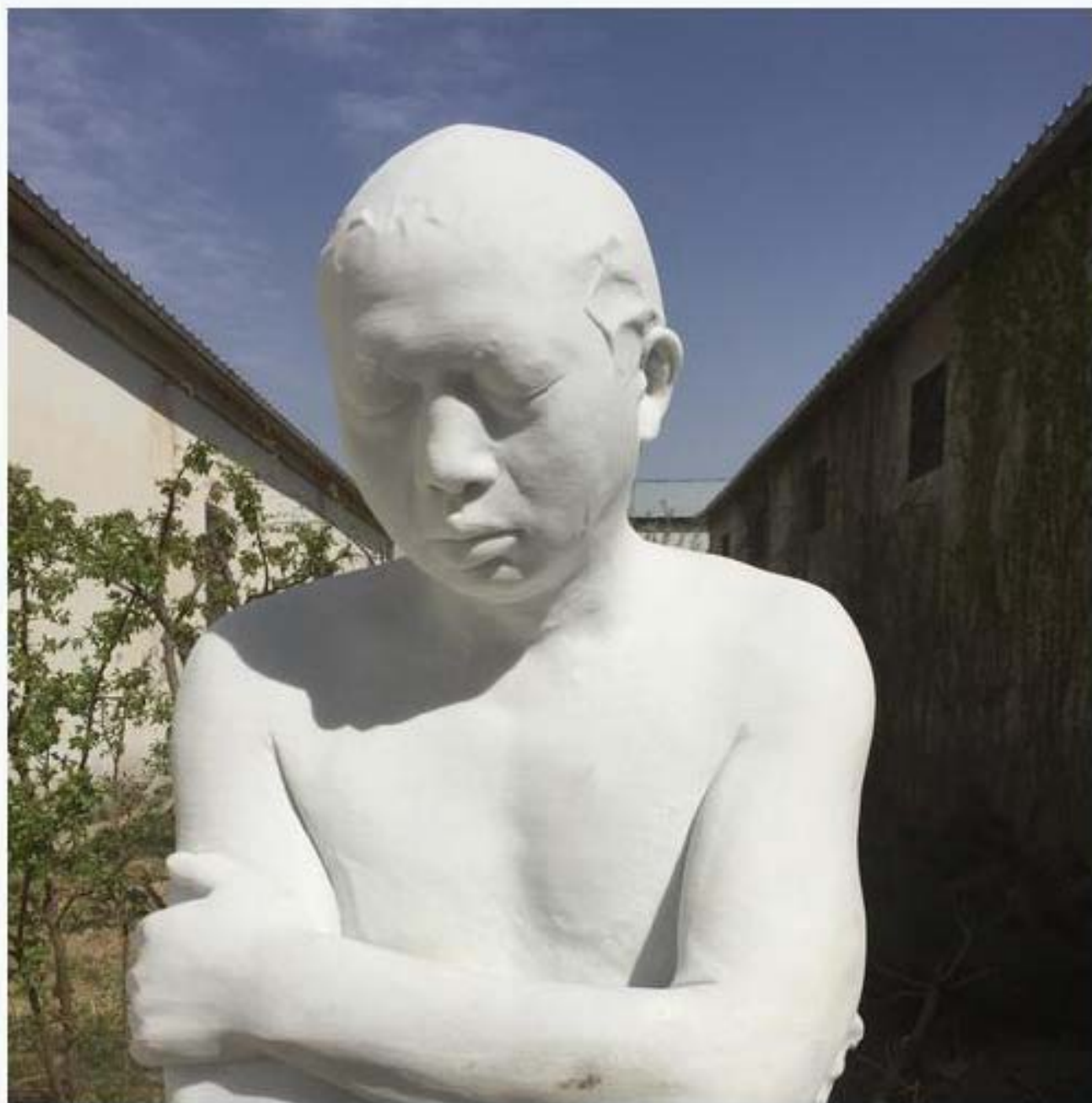
雕塑sculpture 汉白玉 white marble 2015