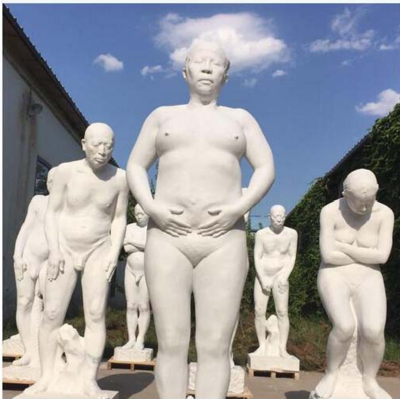
雕塑sculpture 汉白玉 white marble 2015