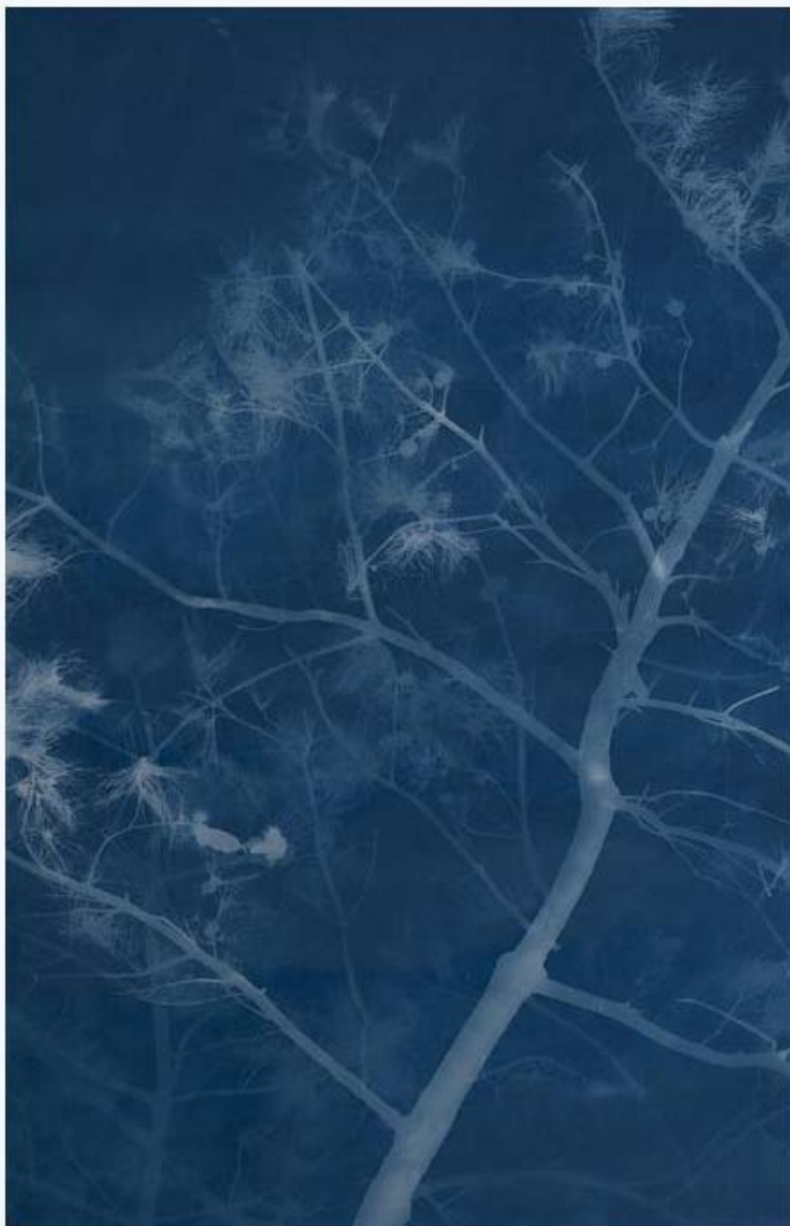
松树 Pine 亚麻布蓝晒 Cyanotype on canvas