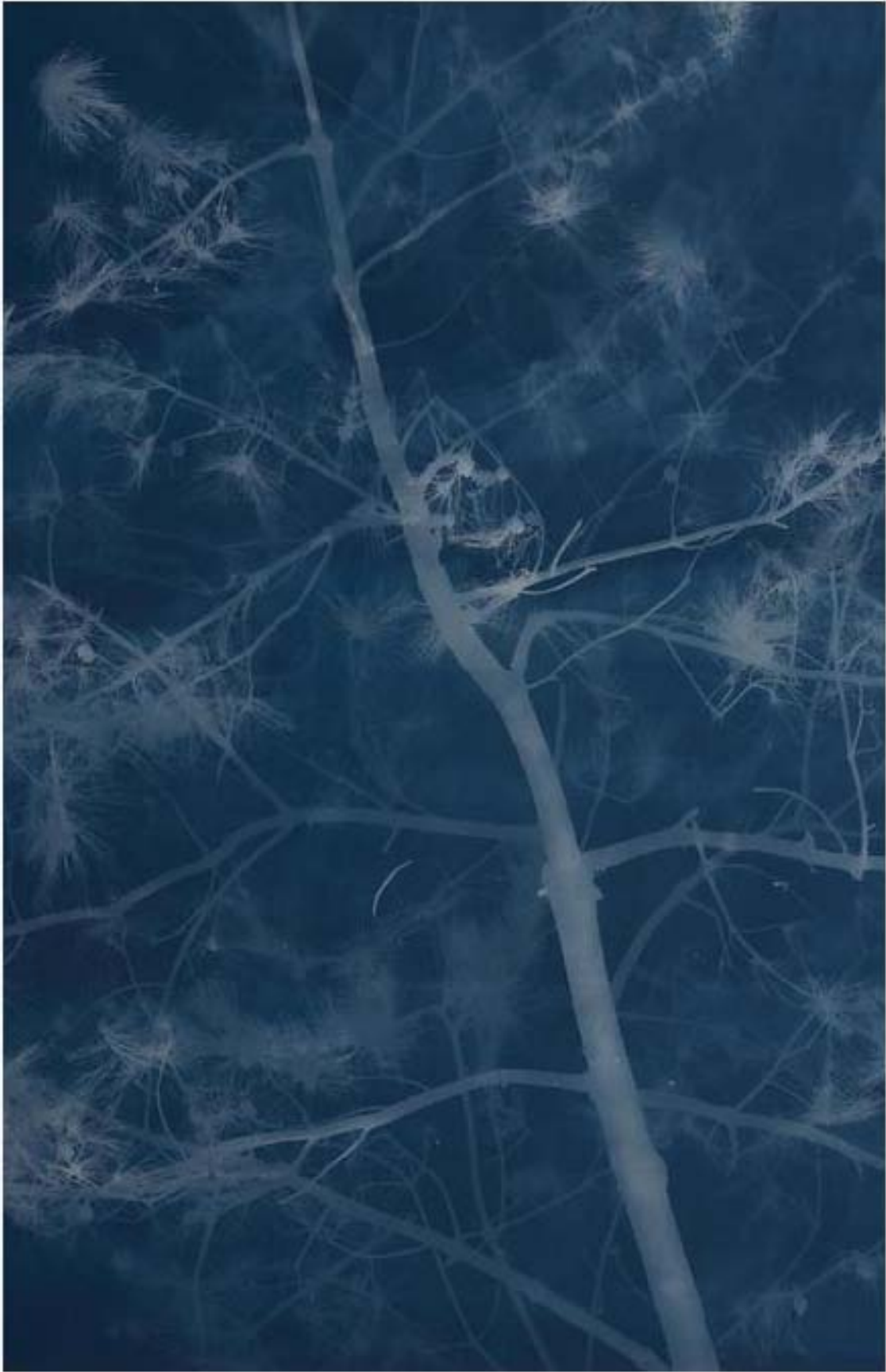
松树 Pine 亚麻布蓝晒 Cyanotype on canvas