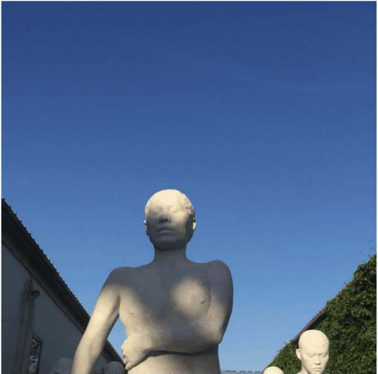
雕塑sculpture 汉白玉 white marble 2015