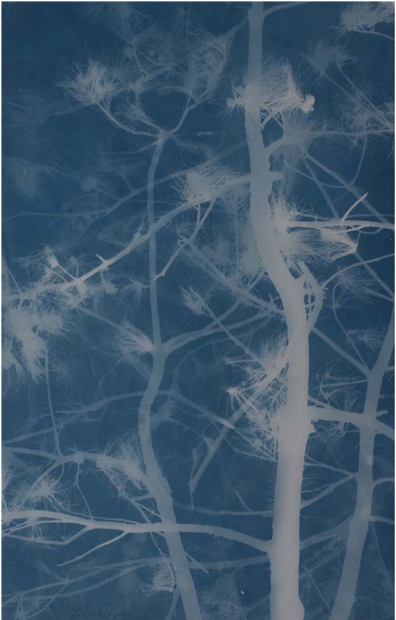
松树Pine(23)亚麻布蓝晒Cyanotype on canvas 195X124cm.2016.5.10.