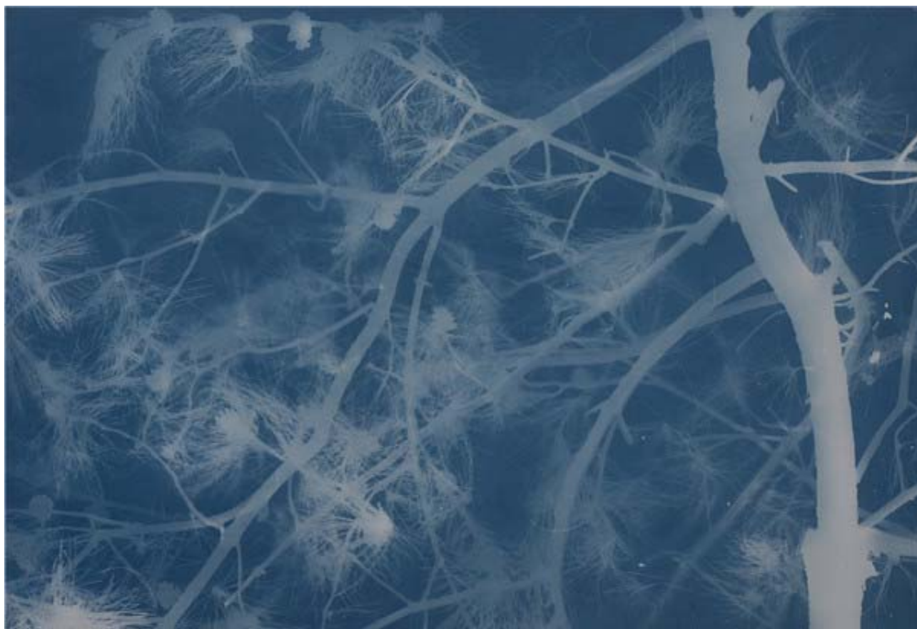
松树Pine(25)亚麻布蓝晒Cyanotype on canvas 100X146cm.2016.5.10