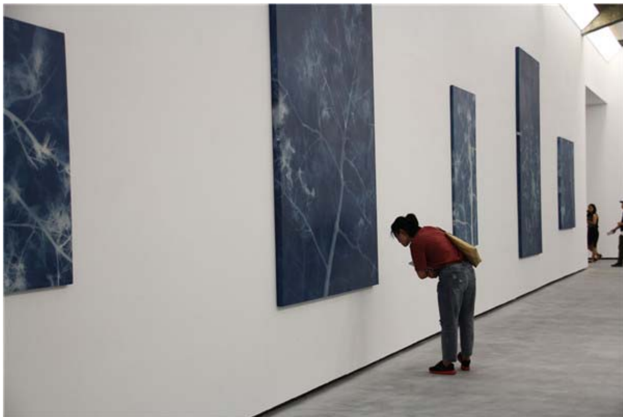
观众观看蓝晒系列

“蓝晒”系列的创作动机是由于大多数人确信摄影机有写真与记实的功能，所以他们的眼睛与思维很容易被其取代、控制与蒙蔽，这也成了我们时代一个很大的问题。而张大力为此要做的就是去机器化与去数码化，其具体做法是借鉴了约翰·赫谢尔爵士的蓝晒法进行创作，蓝晒成像法不需要用相机，而是将柠檬酸铁铵与铁氰化钾混合试剂涂抹在画布的表面上，然后曝光于太阳下，紫外线与试剂发生反应产生氯化铁，没有受光区域的影子形成白色，而曝光部分则会变成蓝色，仿佛X光片。