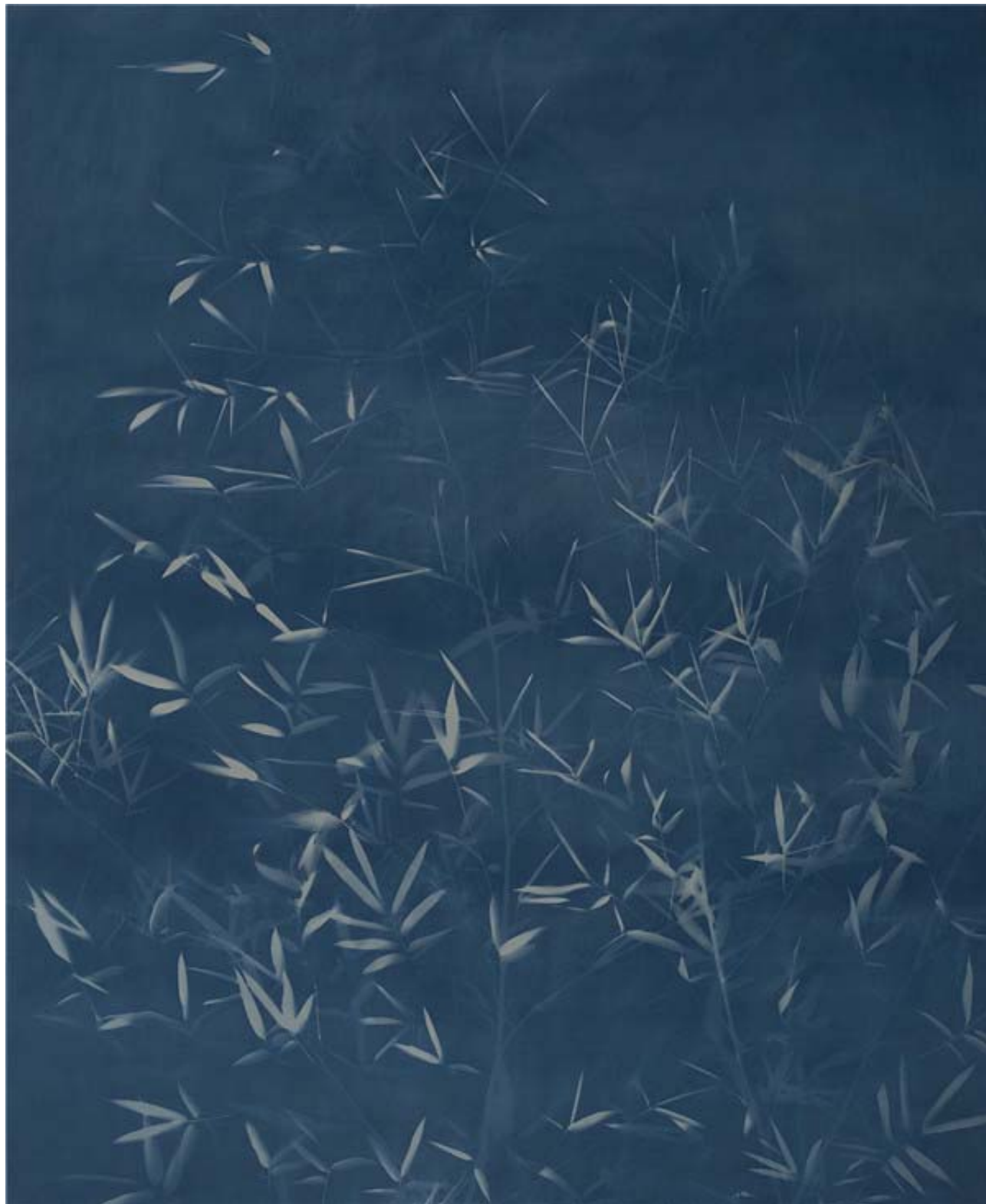
竹子,Bamboo(2).亚麻布蓝晒Cyanotype on canvas ( 240X168cm ) 2015.9.25.