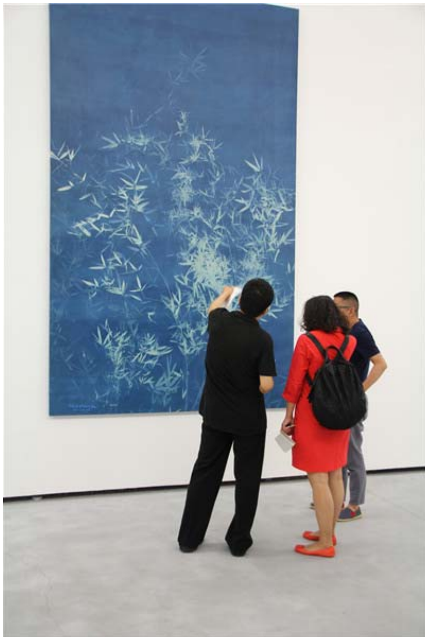
观众观看蓝晒系列