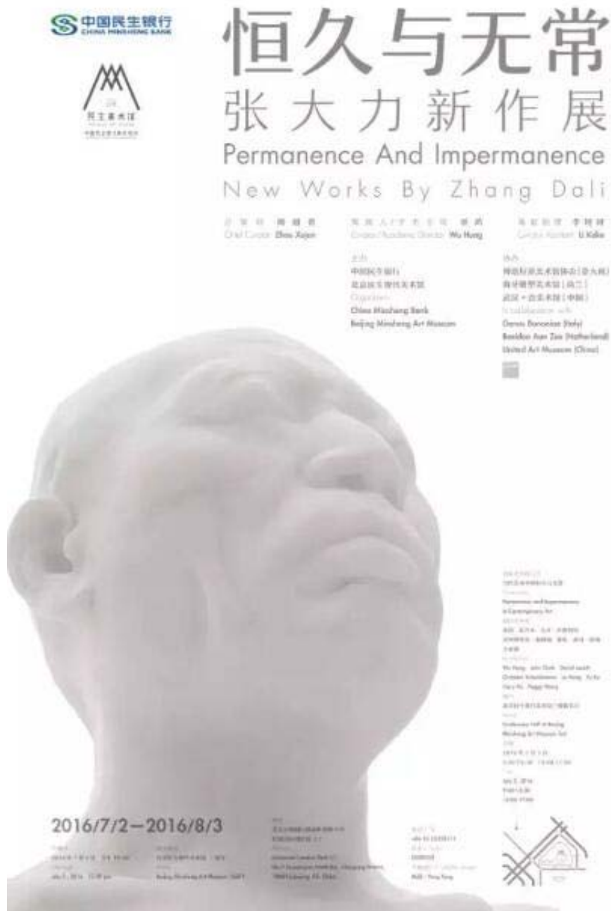
“恒久与无常：张大力新作展”海报

张大力，1987年毕业于中央工艺美术学院（现清华美院），最早在上世纪九十年代就以街头涂鸦的作品“对话”而闻名，是最早关注现实并以此为题材进行创作的艺术家中之一。