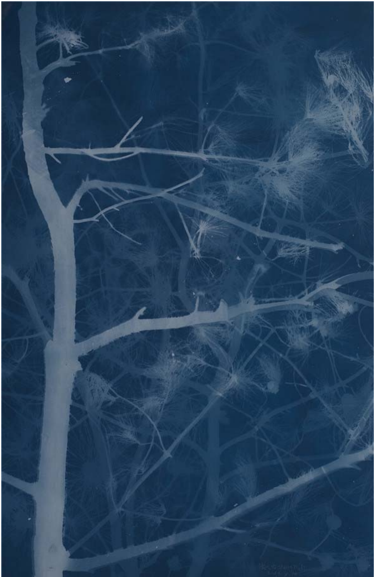
松树Pine(24)亚麻布蓝晒Cyanotype on canvas 174X111cm.2016.5.10