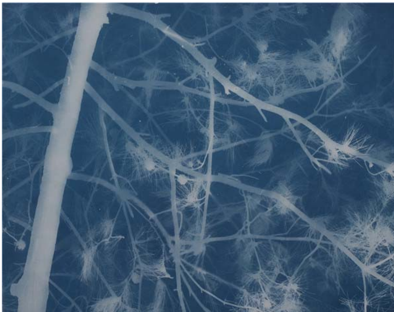
松树Pine(26)亚麻布蓝晒Cyanotype on canvas 120X150cm.2016.5.10 (2)