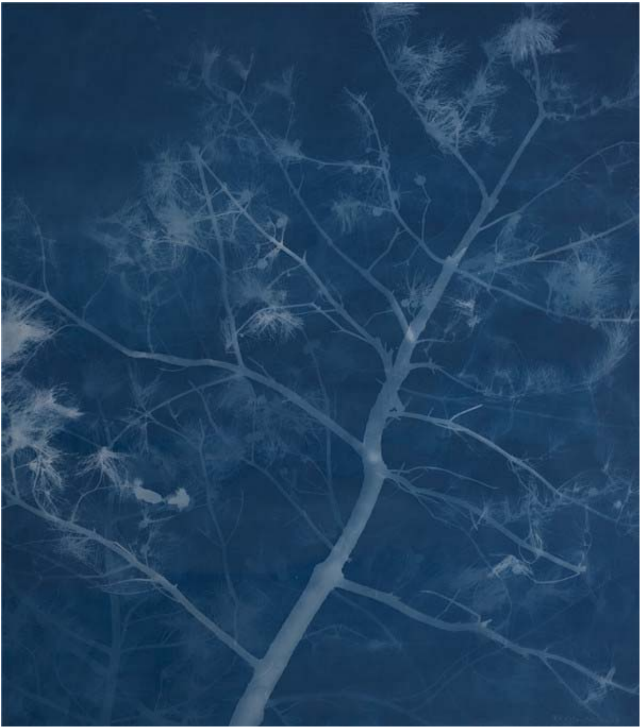
松树Pine(22)亚麻布蓝晒Cyanotype on canvas 259X230cm.2016.5.7.