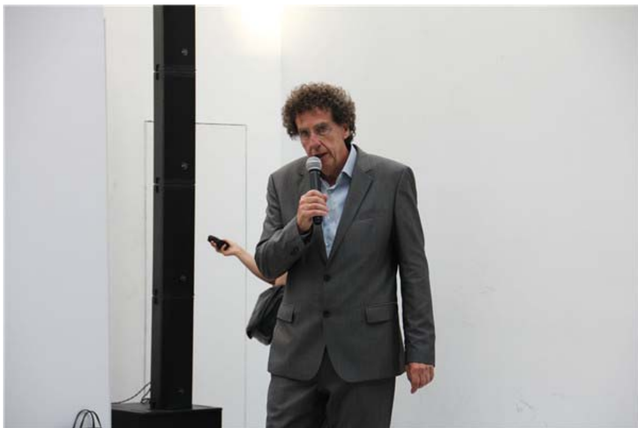
荷兰海牙雕塑美术馆馆长杨·特乌魏斯致辞