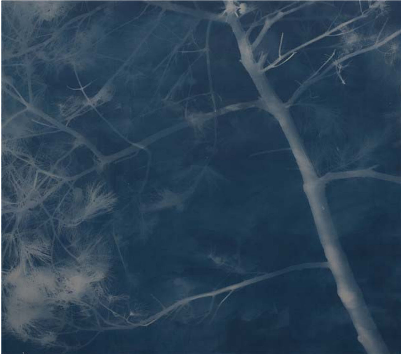
松树Pine(36)亚麻布蓝晒Cyanotype on canvas 180X200cm.2016.5.17