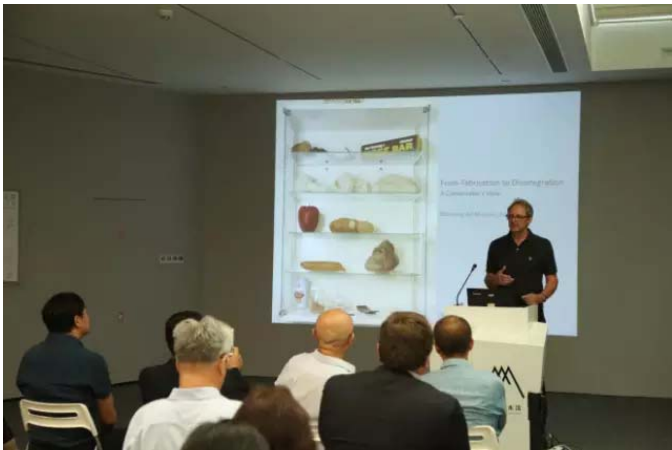
当代艺术材料专家克里斯蒂安·谢德曼主题演讲