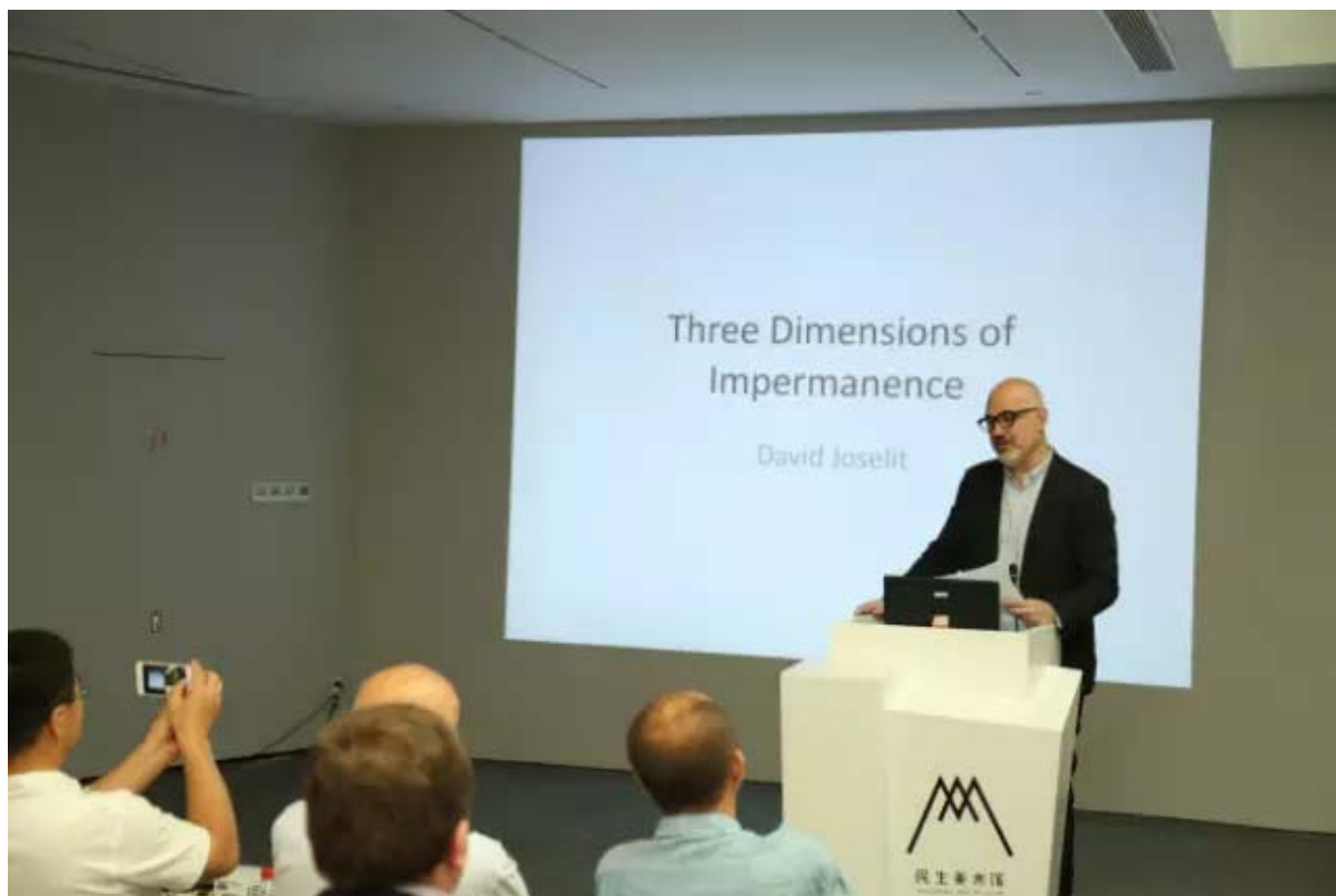
纽约市立大学研究生院教授大卫·乔斯利特主题演讲