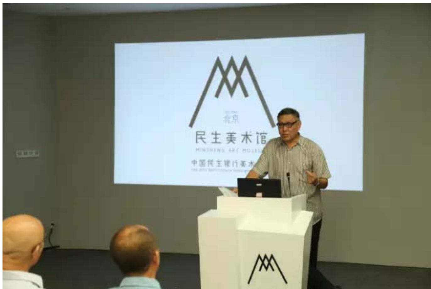
研讨会学术主持巫鸿主题阐述