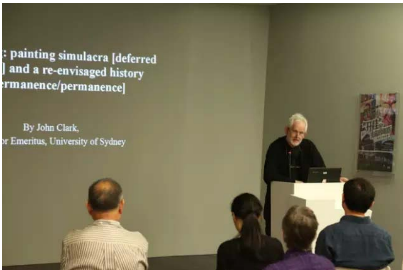
悉尼大学艺术史荣誉教授姜苦乐主题演讲