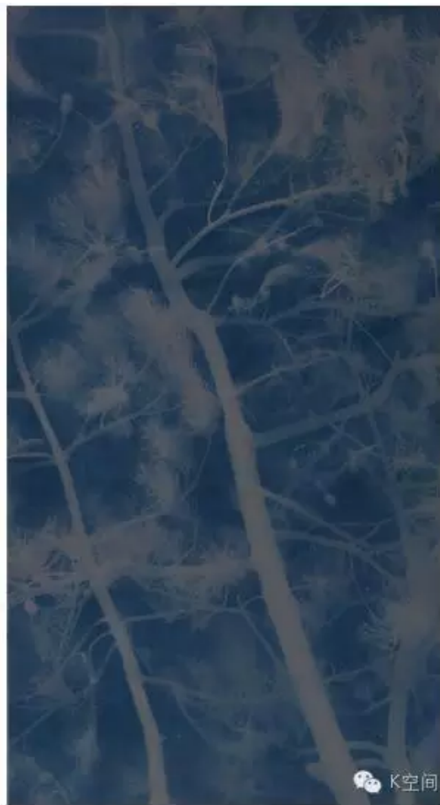
松树14 265×148cm 亚麻布 蓝晒 2016年