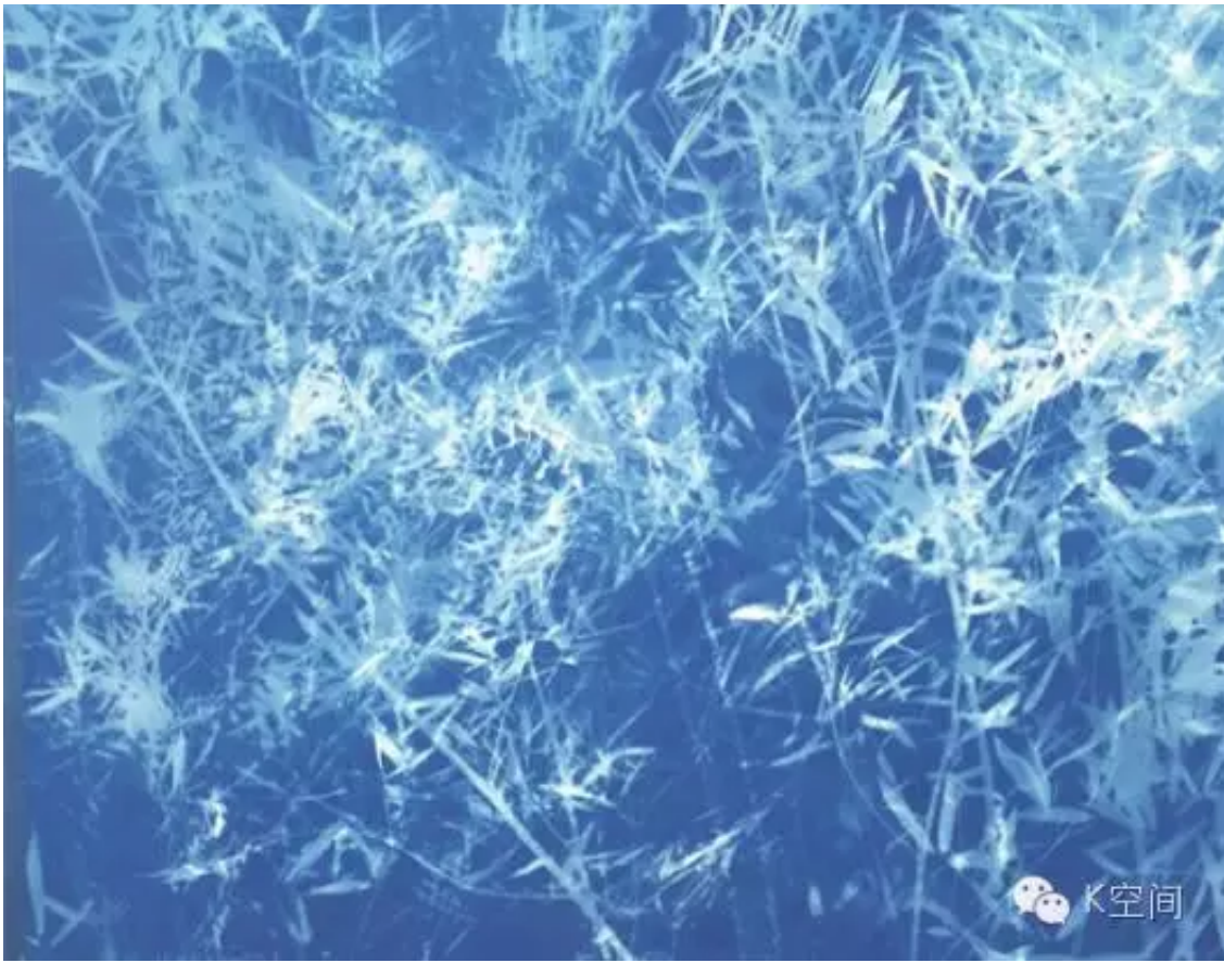
竹子6 126×155cm 亚麻布 蓝晒 2016年