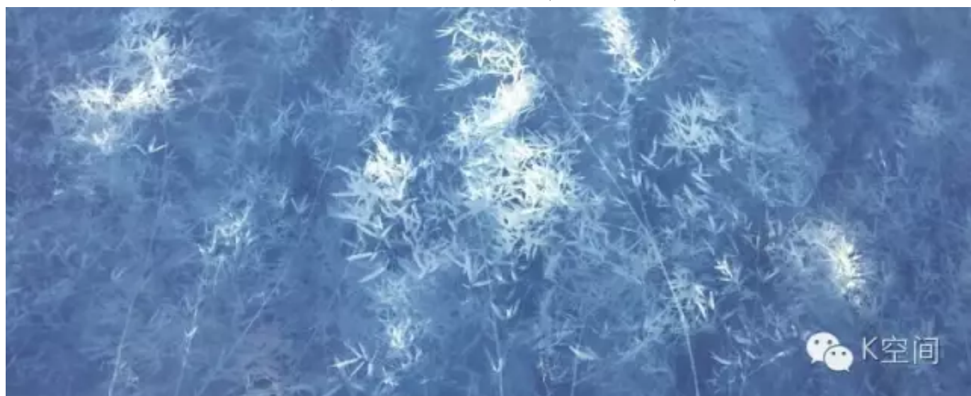
竹子7 242×510cm 亚麻布 蓝晒 2016年