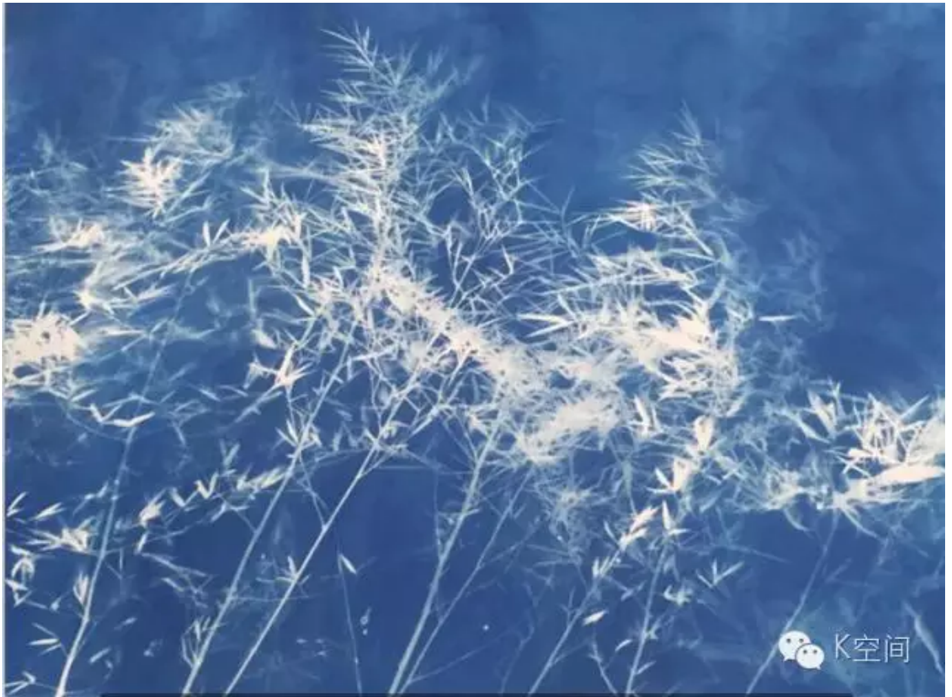
竹子9 245×295cm 亚麻布 蓝晒 2016年