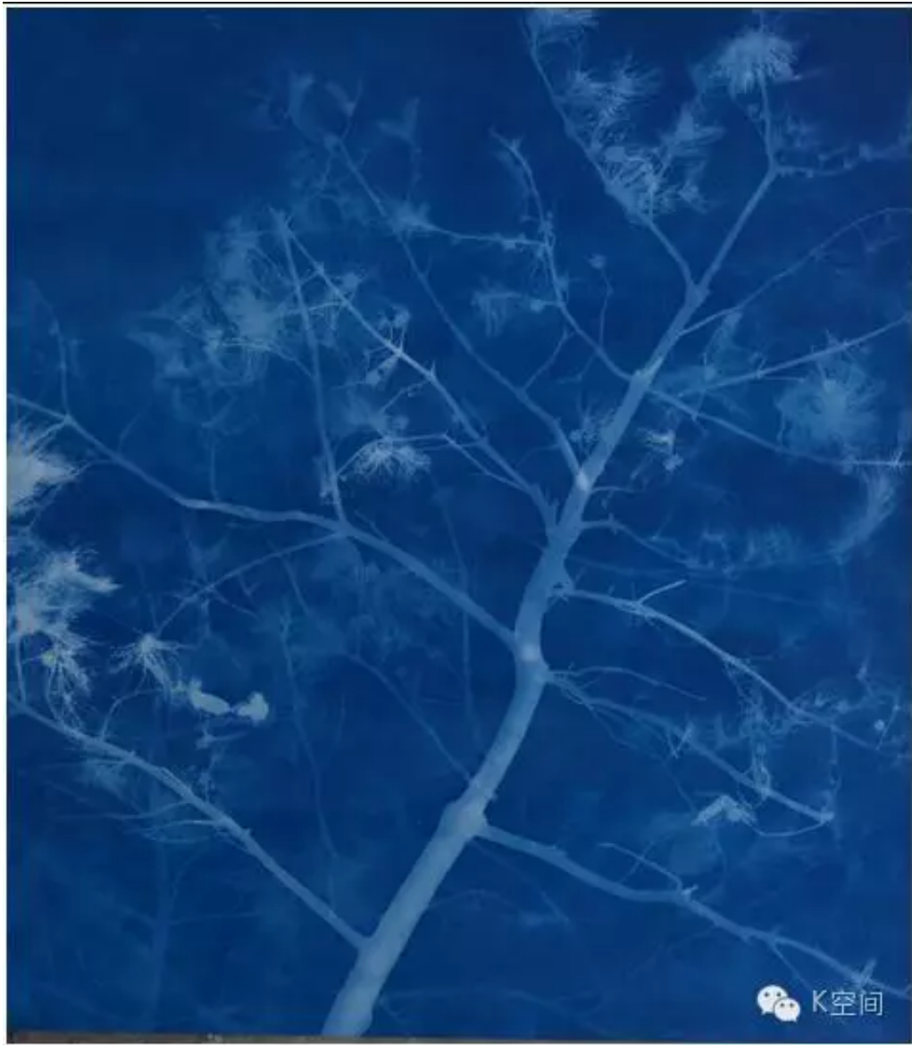
松树22 259×230cm 亚麻布蓝晒 2016年