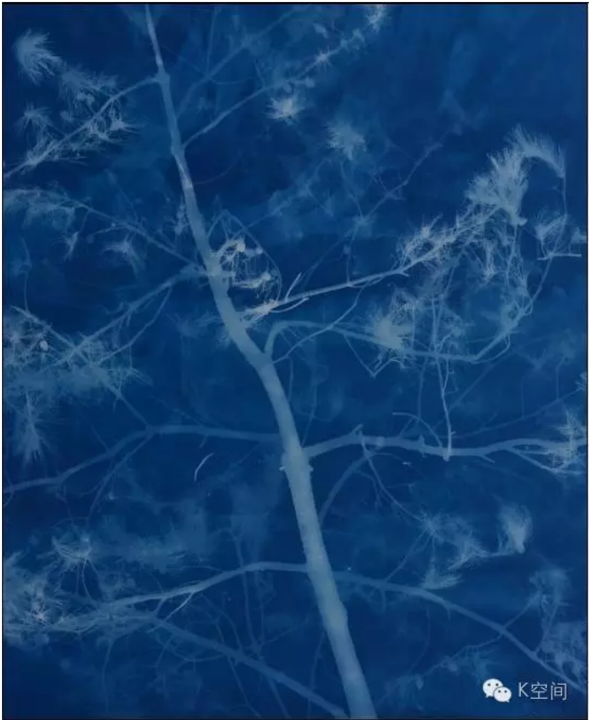
松树18 279×230cm 亚麻布 蓝晒 2016年