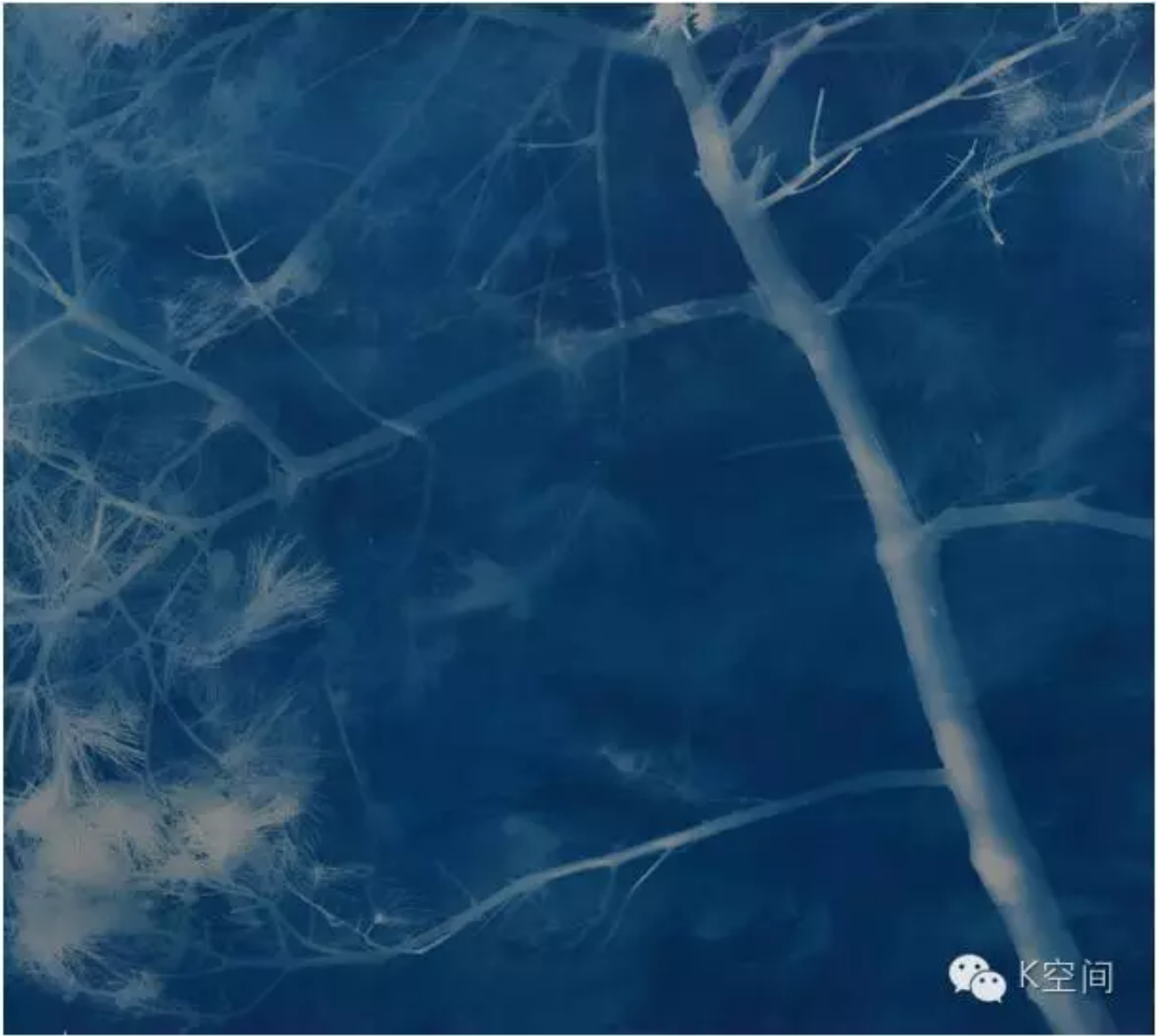
松树36 180×200cm 亚麻布蓝晒 2016年