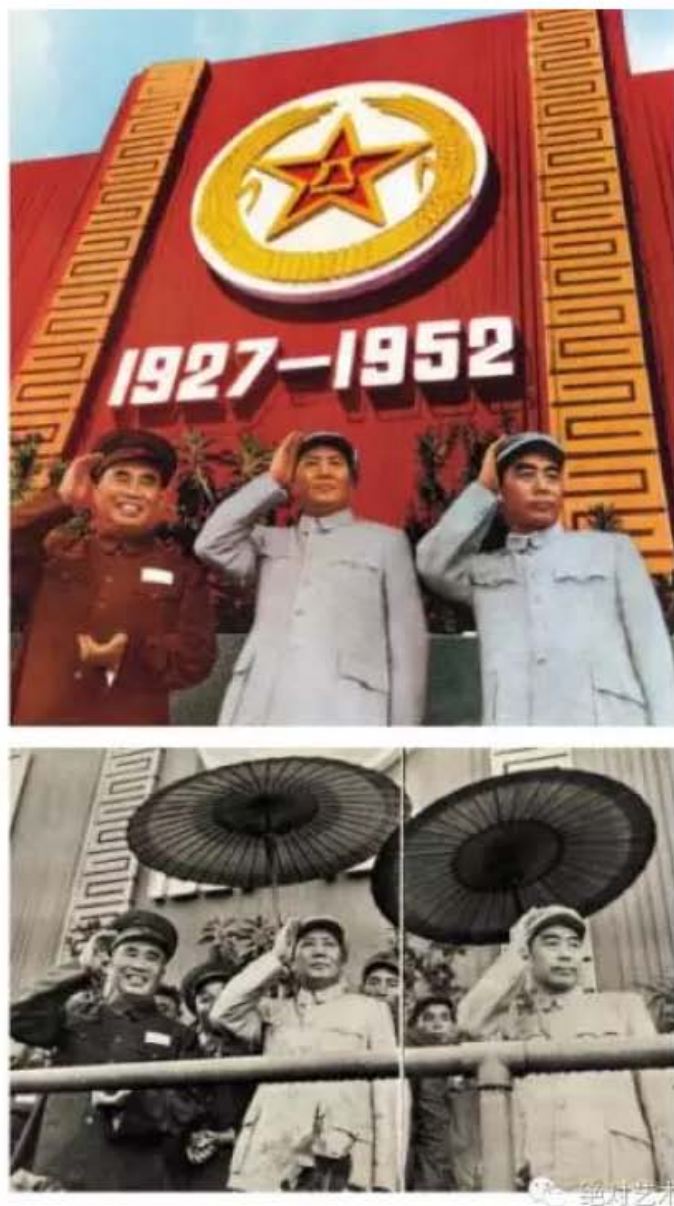
▲1952年第一届全军运动会

自1992年以来，关注当下与批判现实一直是张大力坚持的艺术创作理念，而这一理念皆因他熟知历史，通过思考社会现象来揭示正在发生的时代本质，在此我们应还原到他所经历的时代背景。张大力出生在上世纪六十年代，上学时学的历史只有儒法斗争史，但因自幼就对历史、文学有极大兴趣，后期经过自学，读过《史记》等中国古代经典史书。在他看来历史就是一面镜子，通过历史能看到未来，他将历史与个体比作两个纵横的坐标，作为艺术家，艺术不只表达个体，更代表了所处的时代。诚如他所说，“通过历史能看到未来，艺术不光表达个人或个体经验，而个体经验往往来自于你的民族，你的表达实际代表了你所处的时代更多人的看法，这就是艺术品的时代性。”