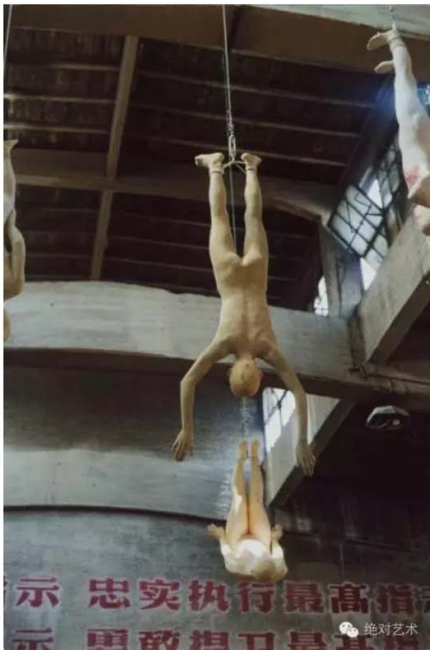
▲ 种族 2003年《左手右手》展览现场

为何持续关注并以这一群体为题材，他的答案是这个身份最能代表三十年来中国的巨变，“民工”既不是农民也不是工人，这一群体是中国现代化进程与城乡改造形成的特殊群体，在中国占了很大的比重，并只在中国有，他们代表了三十年来的巨变！张大力不认为“民工”是底层人群，因为“他们和我们面临的问题都是一样的，他们可能是我们的兄弟姐妹，或者他们就是我们自己。这些人是这个国家的主体，我不关注他们我关注谁呢？”因此，以“民工”为创作主体就成了张大力批判现实最强有力的载体，并让他坚信要将批判现实进行到底。