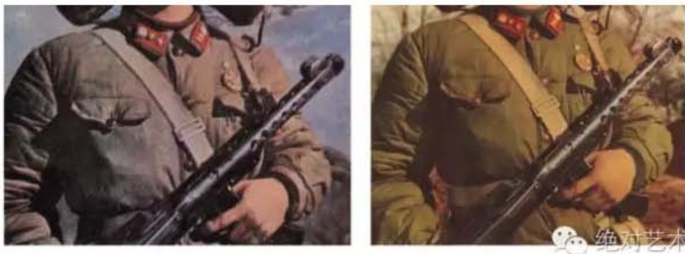
▲伟大的共产主义战士