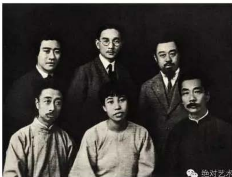
▲ 1927年10月4日鲁迅在上海