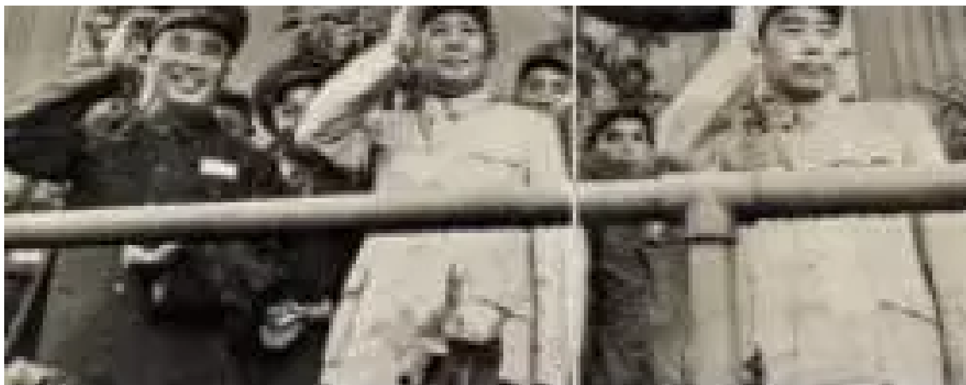
第二历史：1952年第一届全军运动会 2003

通过将报刊或教科书上发表过的照片与原照并置，《第二历史》毫不扭捏地向众人赤裸展示：若干用来说明历史真相的新闻图片，其实是被人修改过的！