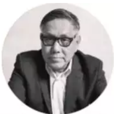
芝加哥大学教授 巫鸿

张大力的艺术实践，特别是《第二历史》，使批评家们感到迷惘：中国艺术为什么会让现实主义这样的表现形式，不只是在艺术史的轨迹中进行，而且越来越靠近社会学？这种有些跨学科的现实主义转型，意味着中国当代艺术将产生什么样的结果？