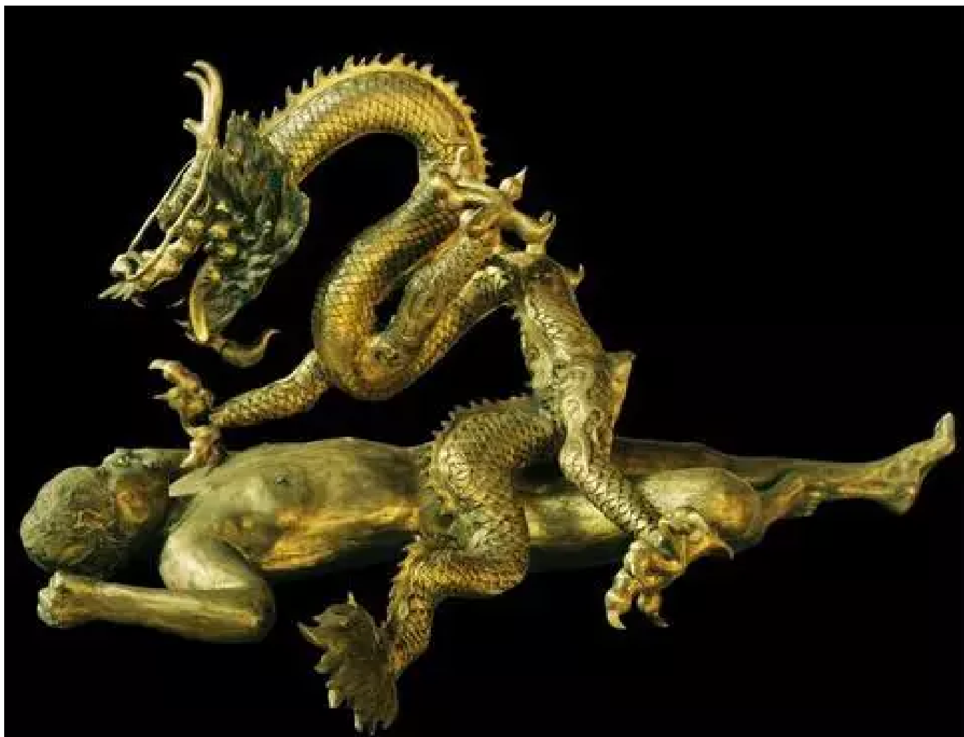
人与兽：飞龙 170X110X90cm 铜 2007

通过将报刊或教科书上发表过的照片与原照并置，《第二历史》毫不扭捏地向众人赤裸展示：若干用来说明历史真相的新闻图片，其实是被人修改过的！