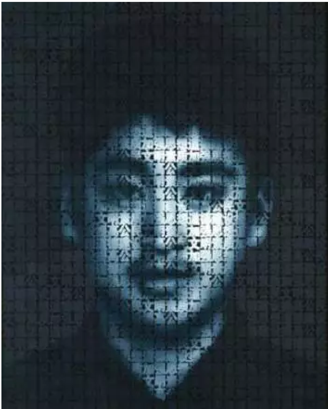
口号：加强思想道德建设2008

《口号》则是《AK-47》暴力侵袭工具的具体化——生活中的各种口号其实就是一种暴力侵袭。对于口号，人们似乎已熟视无睹，感觉麻木，但实际上口号却深刻影响着我们的生活内容和生存状态。口号和面孔的奇妙组合就是我们每个人身处的这个时代的深刻写照，反映出这种社会外力影响之下的人的状态。