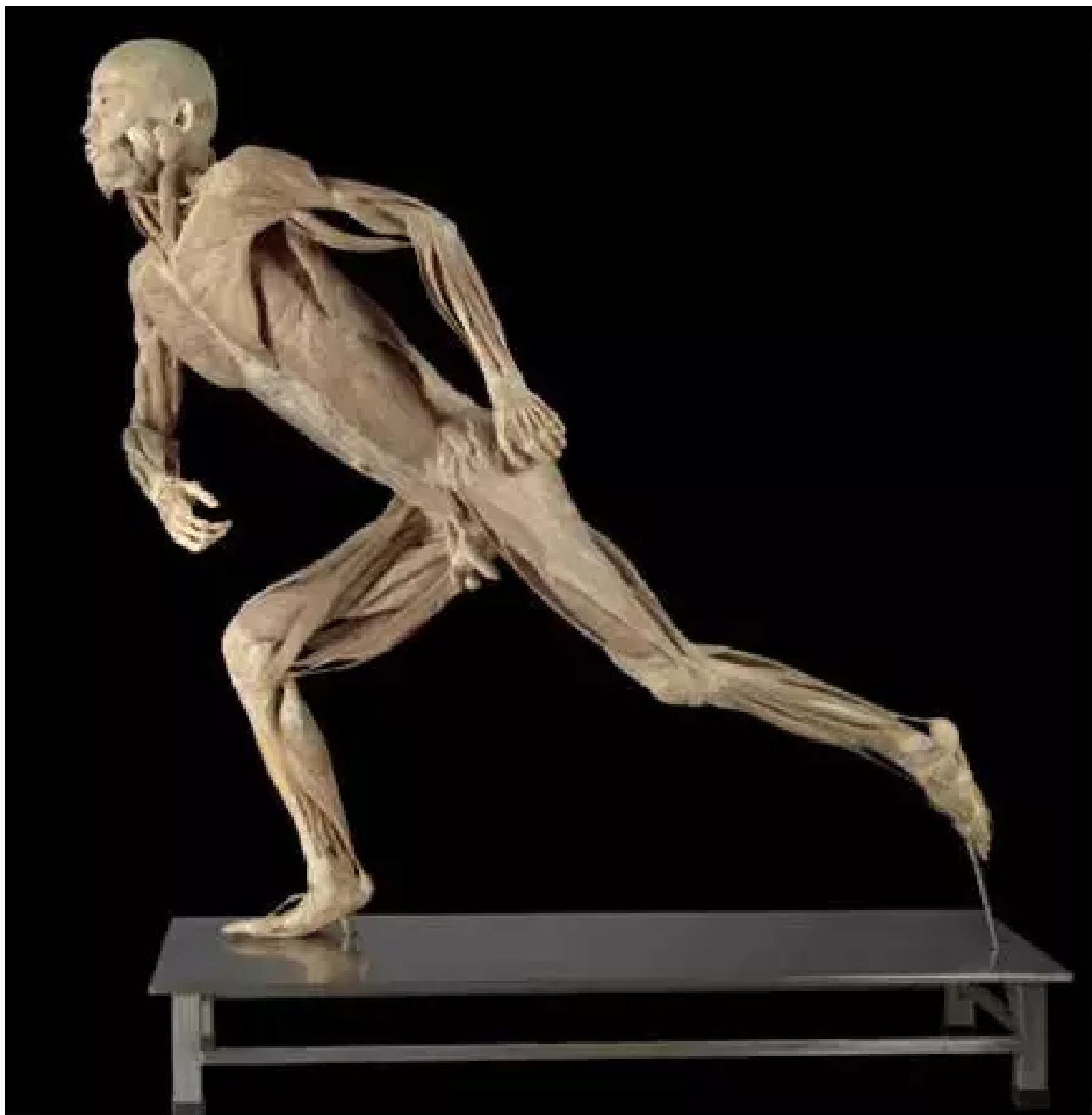
我们 人体等大 人体标本2009年

《我们》通过使尸体标本呈现出政治生活中一些仪式化、符号化、经典化的动作，一方面，对特定年代及支配这些动作的观念的回忆，使人细思极恐；另一方面，灵与肉的巨大视觉冲击，使我们不得不问候我们的灵魂：在无法保存肉体的时代人们往往认为灵魂是永恒的，然而几千年的科技进步人们终于可以保存肉体了，可是灵魂又飞到哪去了呢？咳咳，当然，你也可以看到肉体 and 灵魂间的相互嘲讽。