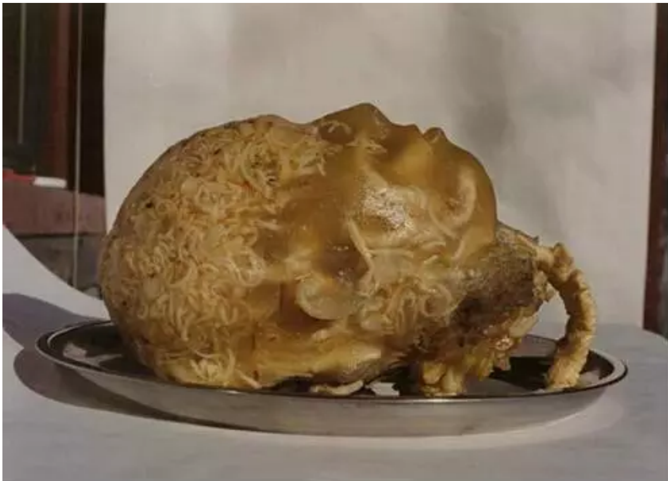
肉皮冻民工 26×20×20cm 2000

《肉皮冻民工》以肉皮冻作为创造材料更能真实反映民工的实际生存状态。一天，张大力到市场溜达，发现很多民工来买肉皮冻，原因是其既便宜又有肉味，将其当肉吃。“改革开放以来，大量农民进城成了民工对社会贡献很大，可在我们的制度里他们却受到排挤成为下等人，这是不是跟革命的理想背道而驰？我们制度的缺陷和悖论该如何修进？”