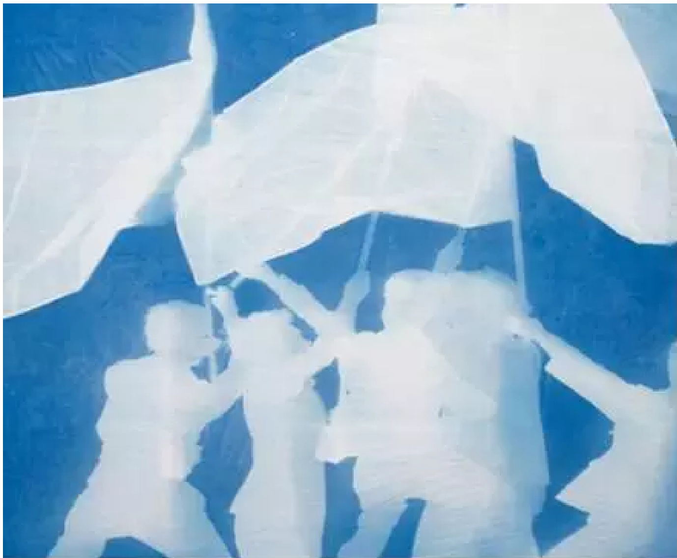
6月 245X297cm 纯棉布蓝晒 2011-6-26