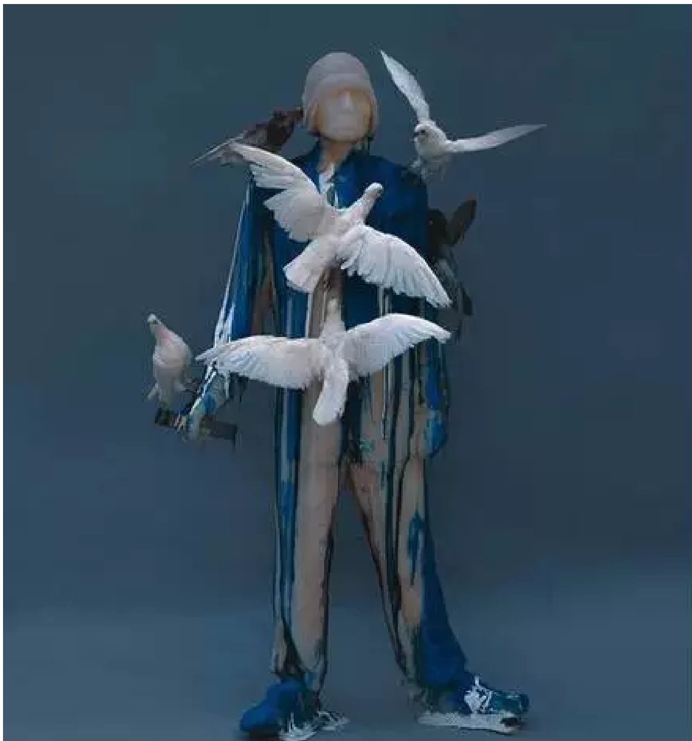
广场5 178x120x85cm 硅橡胶

《广场》是对种族到哪去的终极思考：那附在底层人民身上的鸽子是人们内在希望的超现实表现，而那希望则是这个多灾多难的种族能够不断繁衍生息的源动力！然而思想枷锁仍在：我们每个人到北京都要在天安门广场前照相，我们不知道为什么去，只知道不照相会很遗憾，问题在于：究竟是什么东西控制了我们的大脑？我们是如何不知不觉跟着一个抽象概念走的？