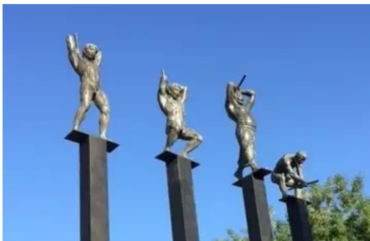
《愚公移山》青铜 (8m) 2015

问：这次从六月到九月的张大力回归展，您为什么选择了《身体与灵魂》作为展览的题目？