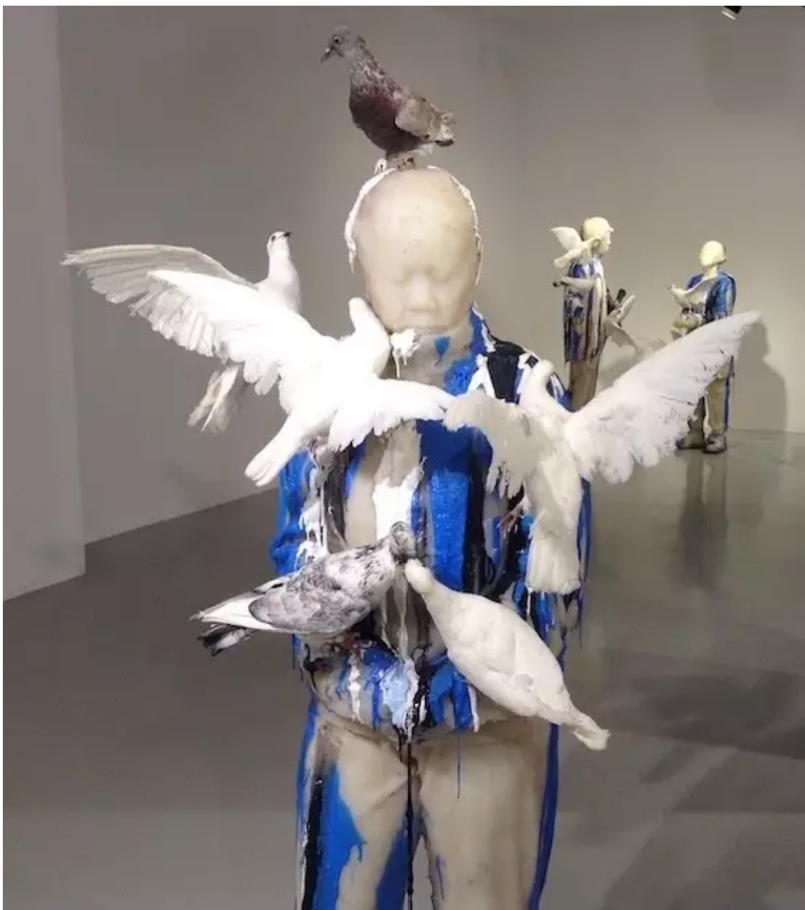
《广场》硅橡胶和鸽子标本2014