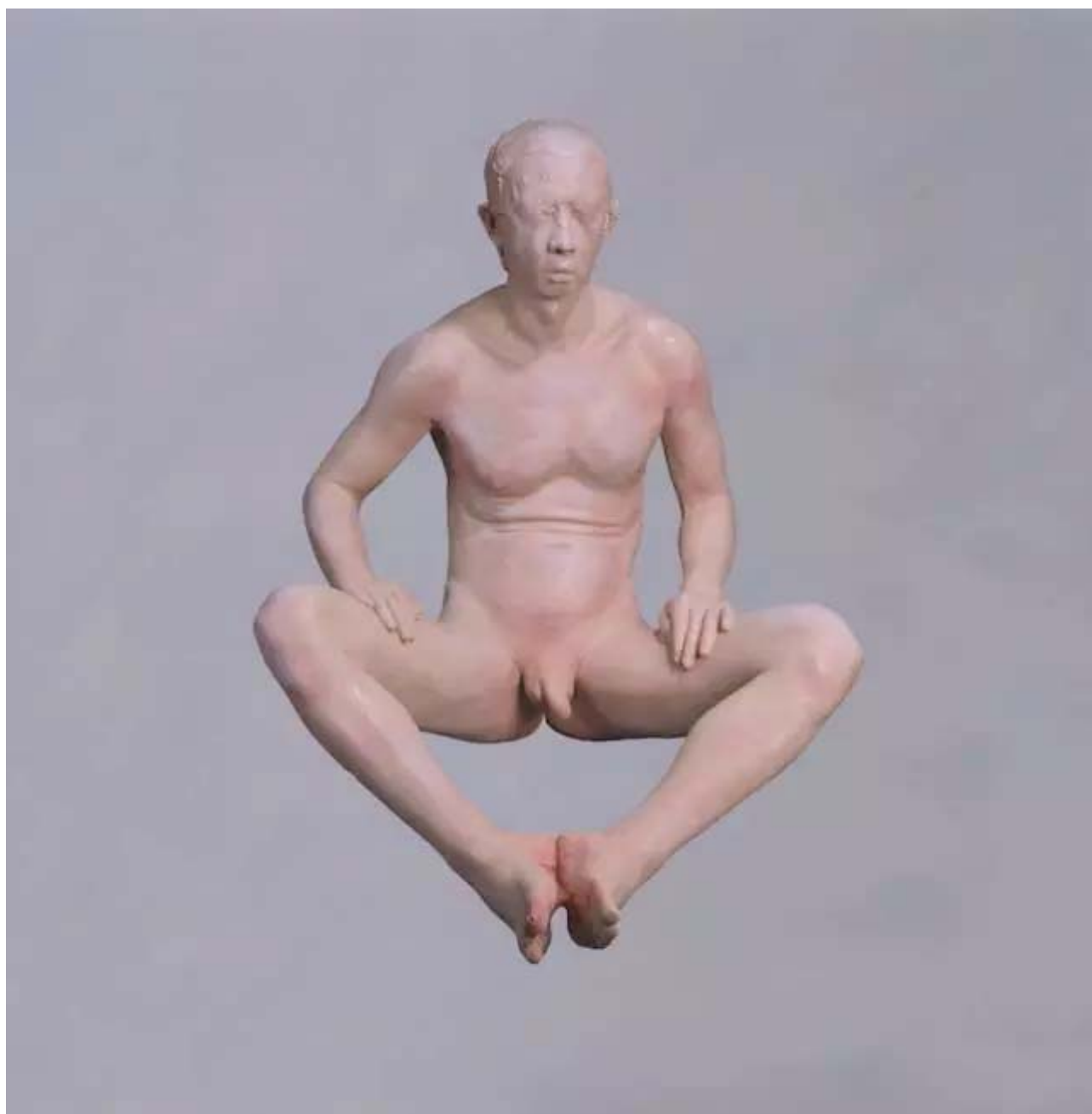
种族 玻璃钢 2005

这种作品之间的思辨关系是需要解释的，艺术家自己须要解释，也须要评论家和策展人来解释，因为当代艺术已经不是单纯视觉的或者形式的艺术，它背后有自己的逻辑与观念，而这些背后的东西必须得靠艺术家和批评家解释出来。