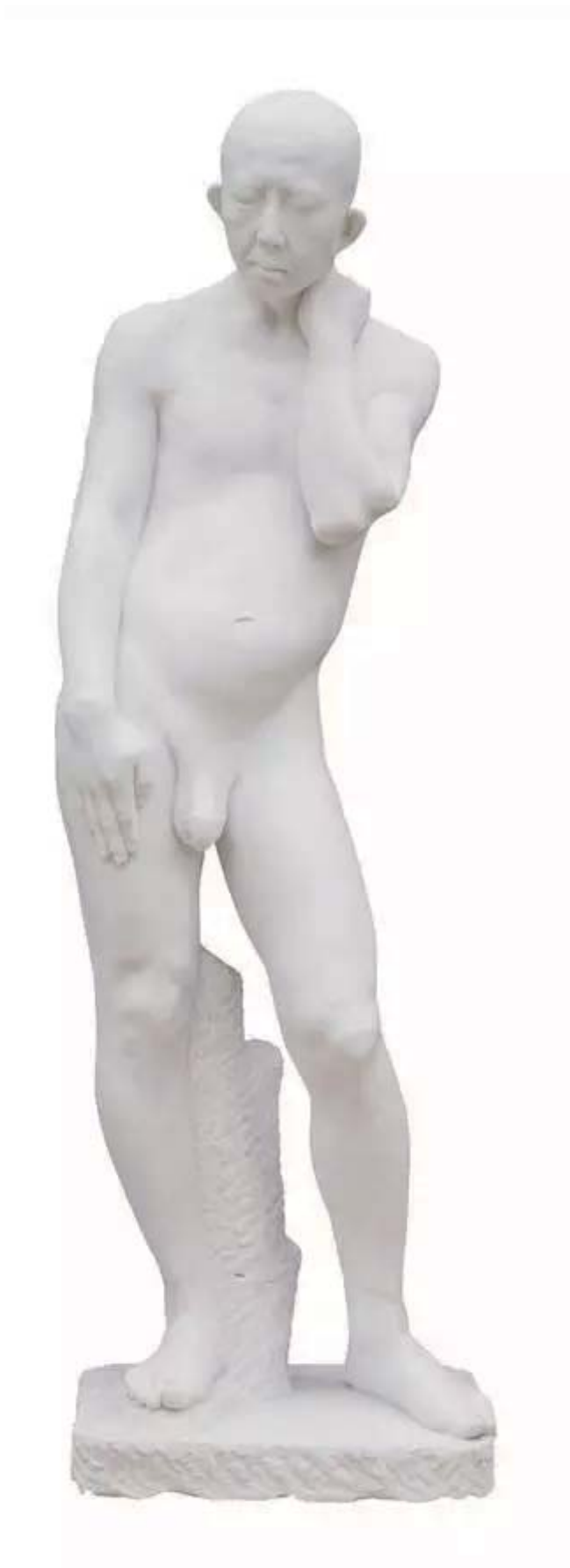
雕塑 171cm×54cm×43cm汉白玉 2015

M: 放在今天, 您觉得汉文化, 或者说中国传统的文化、哲学, 对当下的世界有普适性吗?