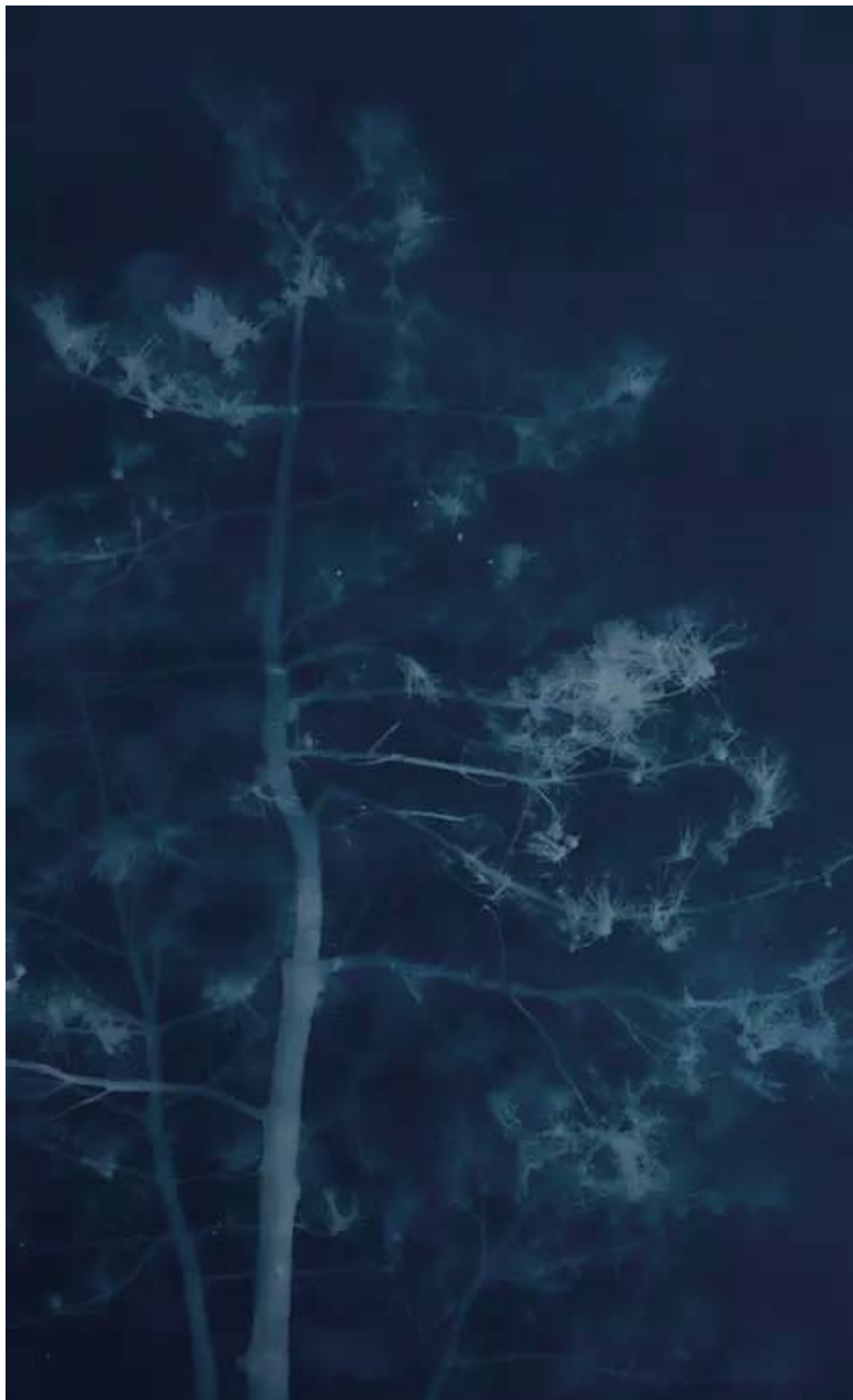
松树12 400cm×245cm 亚麻布蓝晒 2016

Z: 因为我也不是局外人，面对时代我也只能是弱勢的一方，所以这种无力感，我深有体会，我也经历过底层生活。我不是简单的翻制他们的外形，我了解他们。