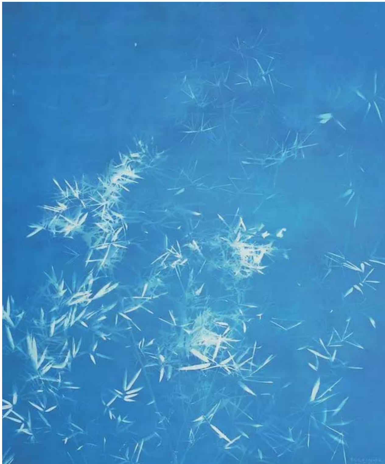
竹子4 200cm×165cm 亚麻布蓝晒 2015

Z：这并不是一次预谋好的转变。首先可能在材料上它呈现的是一种相对沉静的含蓄的效果，并不是像之前的作品那么冲击你的视觉与思想，但并不是有计划有预设的变化。像你说，这个系列的作品在面貌上可能沉静了一些，但是作品背后依然具有思辨性。至于说，外界猜测我是不是不如以前那么锋利了，是不是因为年龄大了，思想上不如以前尖锐了，变得平和了？我也不知道，它只是我最近这个阶段感兴趣的一种表达方式，至于会持续多久，我不知道。