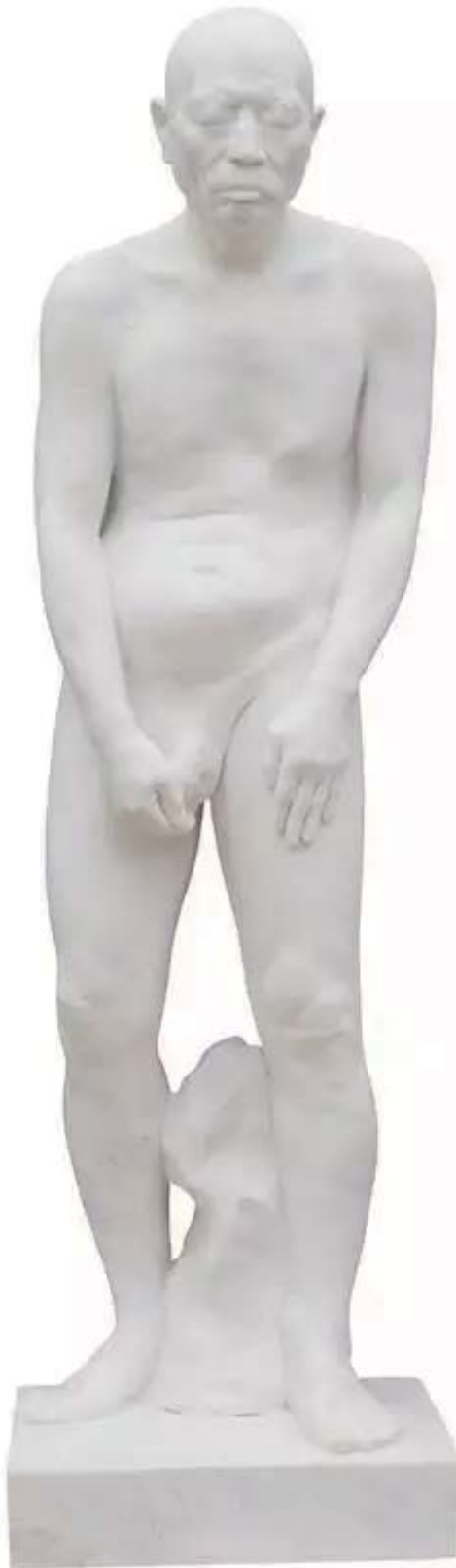
雕塑 171cm×49cm×44cm汉白玉 2015

Z: 我觉得理论上是这样的。但具体来说，形式或者方法上可以没有标准，但是作品背后还是须要有一个脉络，或者叫作出处。这个文化上的出处应该是改变不了的，无论你在形式上怎么更新与转换。这个出处是在所有形式的后面，是你遵循的一个精神坐标，这个坐标是谁，你生活在哪儿。你的知觉和你的精神有一个指向，如果没有这个指向，那就只能是乱来。我觉得一个艺术家最须要解决的问题，就是你是从哪儿来的。