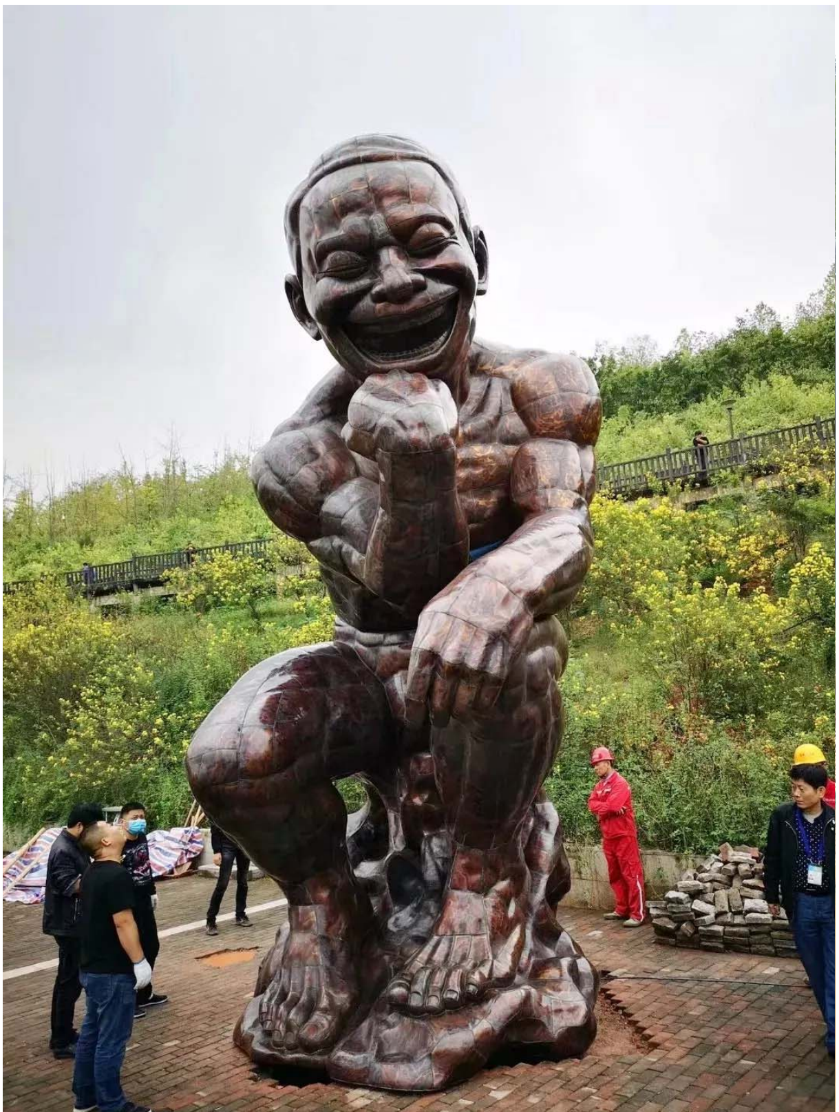
悦来公共艺术展④|帅！高6米重4吨雕塑《重庆思想者》落地悦来！