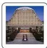
重庆悦来温德姆酒店