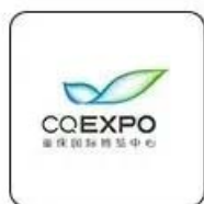
重庆国际博览中心