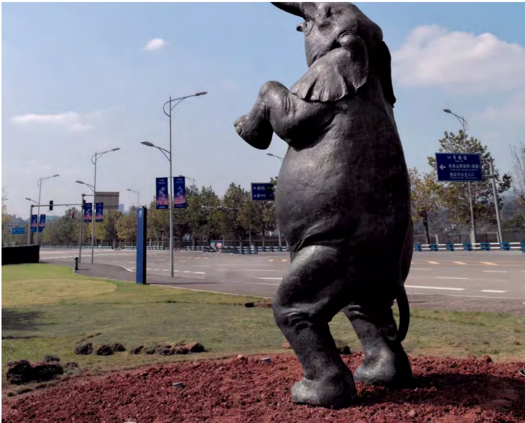
张大力，《感观世界》，青铜铸造/贴金，196×158×800cm，2018

本展览汇集的十位艺术家，到重庆悦来这个新兴都市城区进行现场考察和调研，然后从各自独特的感性视角出发，结合当地文化生态进行跨界公共艺术创作。悦来新城，这个重庆发展的未来城市窗口包含着智能、绿色、消费化的多元世界，向艺术家们发出了新的一系列挑战：